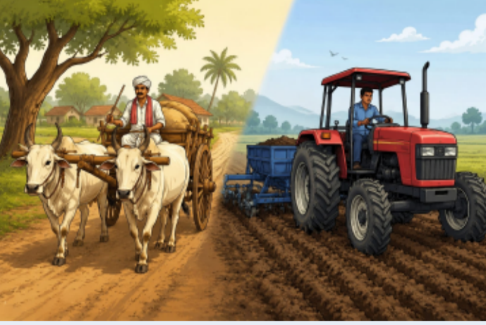
జగిత్యాల, తెలంగాణ పత్రిక ప్రతినిధి జూలై 7:

-ఆధునిక యంత్రాల రాకతో కసుమరుగవుతున్న గ్రామీణ సంస్కృతి..!