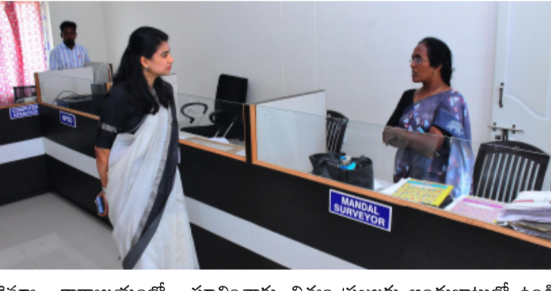
రెవెన్యూ కార్యాలయంలో సూచించారు. నిత్యం ప్రజలకు అందుబాటులో ఉండి సేవలు అందించాలని ఆదేశించారు. భూ భారతి, సాదాబైనామా కింద వచ్చిన దరఖాస్తులను పరిశీలించి.. నిర్ణీత గడువులోగా పరిష్కరించాలని తెలిపారు. కార్యాలయంలోని అన్ని పైళ్లను జాగ్రత్తగా భద్రపరచాలని, ఆవరణ అంతా పరిశుభ్రంగా ఉండేలా చూసుకోవాలని ఆదేశించారు. పరిశీలనలో ఇంచార్జి తహసీల్దార్ మురళీ సిబ్బంది తదితరులు ఉన్నారు

సిరిసిల్ల జిల్లా ప్రతినిధి, జూలై 07, తెలంగాణ పత్రిక రెవెన్యూ అధికారులు, సిబ్బంది సమయ పాలన పాటించాలని జిల్లా కలెక్టర్ గరిమ అగ్రవాల్ ఆదేశించారు. తంగళ్లపల్లి మండల కేంద్రంలోని