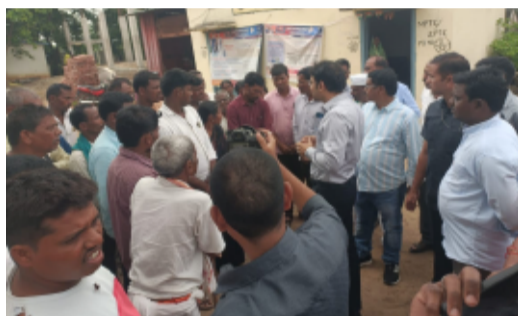
అడిగి తెలుసుకున్నారు. గ్రామంలో మౌలిక వసతులపై ప్రజల నుంచి వివరాలను సేకరించి పెండింగ్ సమస్యలను త్వరితగతిన పరిష్కరించాలని అధికారులను సూచించారు. కలెక్టర్ వెంట