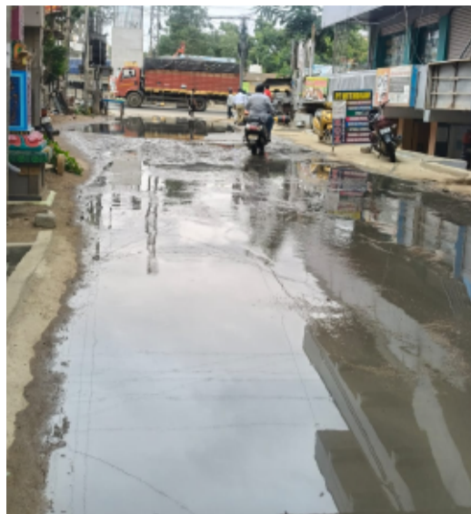
రోడ్లంతా వ్యాపించి దుర్వాసన వెదజల్లుతుండటంతో

-అయ్యప్ప స్వామి కమాన్ వద్ద పొంగిపొర్లుతున్న మురుగు -పాదాచారులు, వాహనదారులకు నిత్యనరకం -ఫిర్యాదులు చేసినా స్పందించని అధికారులు.. శాశ్వత పరిష్కారం కోరుతున్న స్థానికులు మేడ్చల్, జూలై 9 తెలంగాణ పత్రిక