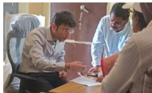
తహసీల్దార్ మహేందర్ నాథ్, ఎపీఓఎస్ అమీర్ ఖాన్, గ్రామ సర్పంచ్, అధికారులు, గ్రామపంచాయతీ సిబ్బంది, ప్రజా ప్రతినిధులు, గ్రామస్తులు, పాల్గొన్నారు.