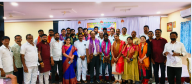
సిరిసిల్ల జిల్లా ప్రతినిధి, జూలై 01, తెలంగాణ పత్రిక

వేములవాడ పట్టణ మున్నూరు కాపు సంఘం ఆధ్వర్యంలో డాక్టర్స్ డే వేడుకలు మున్నూరు కాపు కళ్యాణ మండపంలో నిర్వహించారు ఈ కార్యక్రమంలో భాగంగా మున్నూరు కాపు కులం లోని డాక్టర్స్ ని మున్నూరు కాపు సంఘం కార్యవర్గం ఆధ్వర్యంలో శాలువాతో సన్మానించి వారికి మెమెంటోను అందజేసి వారికి శ్రీ రాజరాజేశ్వర స్వామి వారి ప్రసాదం ను అందజేశారు. అనంతరం డాక్టర్ వృత్తి యొక్క గొప్పతనం డాక్టర్స్ సమాజానికి చేస్తున్న సేవల గురించి కొనియాడారు మున్నూరు కాపు కులంలో ఇంత మంది పవిత్రమైన డాక్టర్ వృత్తిలో ఉండడం ఎంతో గొప్ప వైన విషయమని మున్నూరు కాపు కార్యవర్గం తెలియజేసింది. ఈ కార్యక్రమంలో వేములవాడ పట్టణ మున్నూరు కాపు కులం లోని డాక్టర్స్, వేములవాడ పట్టణ మున్నూరు కాపు సంఘం కార్యవర్గ సభ్యులు, కుల బాంధవులు పాల్గొన్నారు