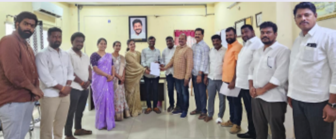
కామారెడ్డి, జూలై 1, (తెలంగాణ పత్రిక జిల్లా ప్రతినిధి)

-కమిషనర్యు విసతి పత్రం అందజేసిన బిజెపి కౌన్సిలర్లు