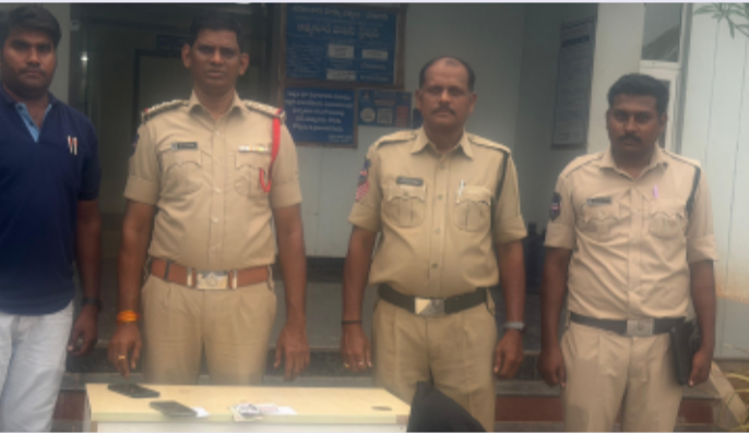
ఆత్మకూర్ జూలై 01, (తెలంగాణ పత్రిక):