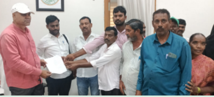
కామారెడ్డి, జూలై 1, (తెలంగాణ పత్రిక జిల్లా ప్రతినిధి)