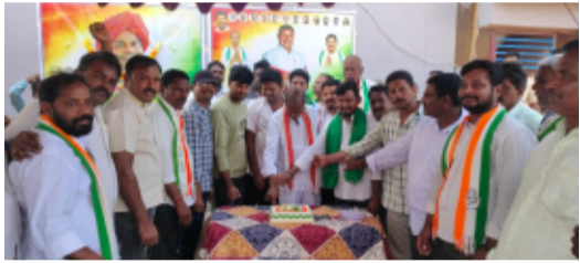
-యువ భారత్ శక్తి ఫౌండేషన్ అధ్యక్షులలో రక్తదాన శిబిరం, ఉత్సాహంగా పాల్గొన్న జారే అభిమానులు తెలంగాణ పత్రిక దమ్మపేట, జూలై 08