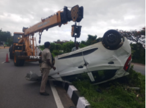
అనంతరం హైవే పెట్రోలింగ్ సిబ్బంది, పోలీసులు వెంటనే ఘటనాల్లికి చేరుకుని సహాయక చర్యలు చేపట్టారు. అనంతరం వారిని మరో వాహనంలో చేగుంట పోలీస్ స్టేషన్ కు తరలించారు. ఘటనపై చేగుంట పోలీసులు కేసు నమోదు చేసి దర్యాప్తు చేపడుతున్నారు.