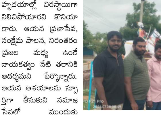
హృదయాల్లో చిరస్థాయిగా నిలిచిపోయారని కొనియాడారు. ఆయన ప్రణాళిక, సంక్షేమ పాలన, నిరంతరం ప్రజల మధ్య ఉండే నాయకత్వం నేటి తరానికి ఆదర్శమని పేర్కొన్నారు. ఆయన ఆశయాలను స్ఫూర్తిగా తీసుకుని సమాజ సేవలో ముందుకు సాగాలని పిలుపునిచ్చారు.అనంతరం కేకే కల్ చేసి స్వీట్లు పంచి, వైఎస్సార్ చిత్రపటానికి పూలమాలలు వేసి నివాళులర్పించారు.ఈ కార్యక్రమంలో కడుదుల

రాజన్న సిరిసిల్ల జిల్లా బోయినపల్లి మండలం నీలోజిపల్లి గ్రామంలో దివంగత నేత, ఉమ్మడి ఆంధ్రప్రదేశ్ మాజీ ముఖ్యమంత్రి గారి 77వ జయంతి సందర్భంగా వైఎస్సార్ అభిమానులు ఘనంగా జన్మదిన వేడుకలను నిర్వహించారు. ఈ సందర్భంగా కేకే కల్ చేసి, గ్రామ ప్రజలకు స్వీట్లు పంపిణీ చేస్తూ ఆయనకు ఘన నివాళులు అర్పించారు.ఈ సందర్భంగా పలువురు మాట్లాడుతూ, వైఎస్ రాజశేఖర రెడ్డి ముఖ్యమంత్రిగా పనిచేసిన కాలంలో రైతులు, పేదలు, విద్యార్థులు, మహిళలు, వృద్ధులు, నిరుపేదల సంక్షేమం కోసం అనేక ప్రణాళిక పథకాలను అమలు చేసి ప్రజల