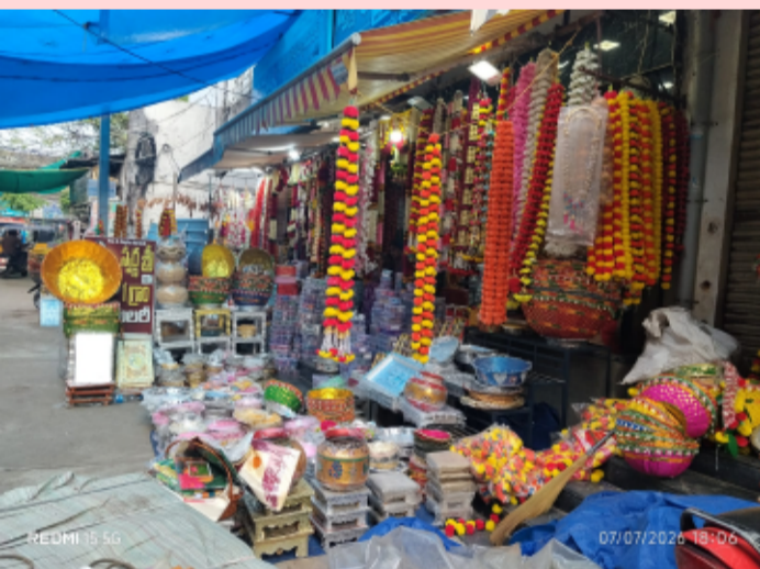
కొత్తగూడెం, జూలై 8 (తెలంగాణ పత్రిక):

-ఎంజీ రోడ్డులో ఆక్రమణలతో ప్రజలకు అవస్థలు -చర్యలు చేపట్టాలని కొత్తగూడెం కార్పొరేషన్ అధికారులకు విజ్ఞప్తి