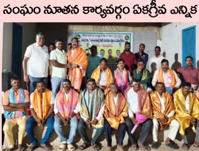
ఆత్మకూరు, జూన్ 22 : (తెలంగాణ పత్రిక):