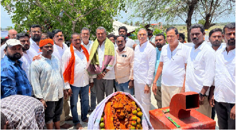
-3కోట్లతో విటి రోడ్డు నిర్మాణ పనులకు శంకుస్థాపన