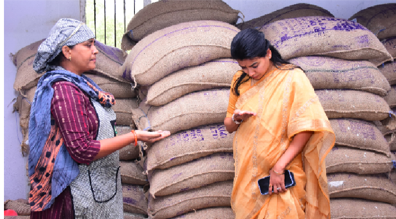
తనిఖీ చేశారు. ముందుగా డైనింగ్ హాల్ కి వెళ్లి విద్యార్థులు భోజనం చేస్తుండగా వారితో మాట్లాడారు. ఈరోజు ఏ ఏ ఆహార పదార్థాలు వడ్డించారో అలా తీశారు. మెనూ ద్వారా పరిశీలించి.. అధికారులను వివరాలు అడిగి తెలుసుకున్నారు. కిచెన్ గోదాంలో బియ్యం, పప్పులు ఇతర ఆహార పదార్థాలను నాణ్యతను పరిశీలించారు. ఎంతమంది విద్యార్థులు వచ్చారో అలా తీశారు. అనుతరం వసతి గదులను, టాయిలెట్లను