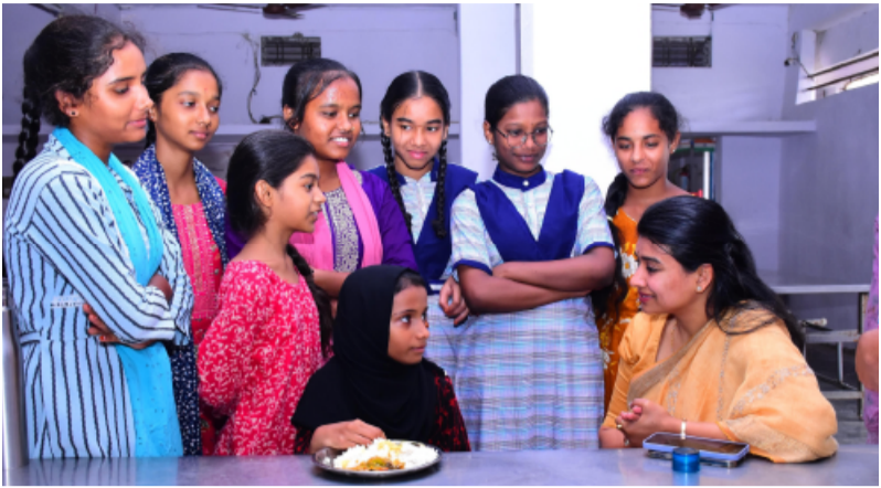
-హాస్పిల్, విద్యాలయం ఆవరణ పరిశుభ్రంగా ఉండాలి