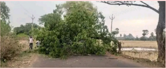
-ఓడెల, జూన్ 22 తెలంగాణ పత్రిక

సోమవారం ఓడెల మండలంలోని భారీగా గాలి తో కూడిన వర్షం కురవడంతో రోడ్డుకు అడ్డంగా భారీ వృక్షం పడింది ప్రయాణికులకు తీవ్ర అంతరాయం కలిగింది స్థానిక వివరాలకు వెళ్తే ఓడెల మండలంలోని కనగర్తి గుండ్లపల్లి గ్రామాల మధ్య ప్రధాన రహదారిపై సోమవారం మధ్యాహ్నం భారీగా గాలితో వర్షం రావడంతో ప్రధాన రోడ్డుపై పెద్ద వృక్షం ప్రధాన రహదారిపై అడ్డంగా కూలింది ప్రయాణికులకు గంటపాటు అంతరాయం ఏర్పడింది దీంతో ఆ మార్గంలో రాకపోకలకు తీవ్ర ఇబ్బంది కలిగింది ఈ విషయం తెలుసుకున్న గ్రామస్థులు అధికారులు వెంటనే స్పందిస్తూ చెట్టును తొలగించే చర్యలు చేపట్టి ప్రయాణికులకు అంతరాయం లేకుండా చర్యలు తీసుకున్నారు.