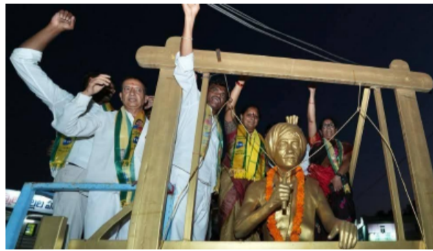
విమర్శలు వచ్చిన లెక్కవేయకుండా తాను ఎందుకున్న మార్గంలో నడుస్తున్న కవిత టీఆర్ఎస్ ముందుకు సాగుతున్నట్లు కనిపిస్తుంది.

సిరిసిల్ల నియోజకవర్గం ఏర్పడిన నాటినుండి అటు రాజకీయ పార్టీలకు జవసత్వాలను అందించి ఆ రాజకీయ పార్టీల భవిష్యత్తు బాటలు వేసింది. ఉమ్మడి రాష్ట్రం లో కమ్యూనిస్టు, కాంగ్రెస్, టిడిపి, అనంతరం తెలంగాణ రాష్ట్ర సమితి కి సిరిసిల్ల రాజకీయ భవిష్యత్తు అందిస్తూ వస్తుంది. ఎన్నో రాజకీయ పరిణామాలకు సిరిసిల్ల వేదిక గా నిలుస్తుంది. తెలంగాణ రాష్ట్రం ఏర్పాటు తర్వాత ప్రధానంగా తెలంగాణ రాష్ట్ర సమితి పరిధిగా ప్రెసిడెంట్ కల్యాణంబ్ల తారక రామారావు వెన్నుబట్టి సిరిసిల్ల ప్రజలు నడుస్తున్నట్లు రాజకీయ పరిశీలకులు చెబుతూ వస్తున్నారు. పరిస్థితులు కూడా అవే రూపాన్ని చేస్తున్నట్లు కనిపిస్తుంది.