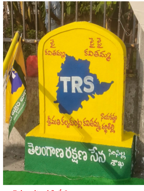
రైతుల పట్ల పట్టంపెడిది.

రాష్ట్రంలోనే అత్యధిక సంఖ్యలో నేత కార్యకులు ఉన్న సిరిసిల్లకు ఎంతో ప్రాధాన్యత ఉంది. ఈ విషయంలో గతంలో నేత కార్యకులను ఊరించి ఉన్నరు మనిపించిన పథకం "వర్కర్ టు ఓనర్". గతంలో స్థానిక శాసనసభ్యులు కేటీఆర్ పెద్దూరు సమీపంలోని ఆపేరాల పార్ట్ లో వర్కర్ టు ఓనర్ పథకం కోసం సామూహిక వర్క్ షెడ్ నిర్మాణం కూడా కొంత జరిగింది. అయితే ప్రస్తుతం కాంగ్రెస్ పార్టీ అధికారంలోకి వచ్చి అసలు వర్కర్ టు ఓనర్ పథకం ఉందా లేదా అన్న విషయంపై ఇలాంటి స్పష్టత ఇచ్చిన పరిస్థితి లేదు. ప్రస్తుతం ఆపేరాల పార్ట్ లోని షెడ్లను వడ్ల గోదాముల కోసం వాడడంపై కవిత ఆగ్రహం వ్యక్తం చేశారు. సిరిసిల్ల నేత కార్యకులు తాము ఓనర్లు మారతామన్న కల గానే మిగిలింది. ఈ విషయంలో అధికార పక్షం, ప్రతిపక్షమైన బిఆర్ఎస్ ఎలా స్పందిస్తూందో అన్న విషయంలో సిరిసిల్ల పట్టణంలో తీవ్ర చర్చనీయాంశంలో మారింది.