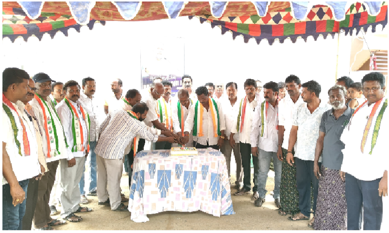
-రాష్ట్ర మంత్రి పొంగులేటి శ్రీనివాసరెడ్డి పై కేటీఆర్ అవినీతి, అక్రమాలు, ఇందిరమ్మ ఇళ్ల పై చేసిన ఆరోపణలను ఖండించిన దమ్మపేట కాంగ్రెస్ శ్రేణులు