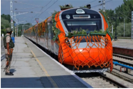
తెలుగు రాష్ట్రాల్లో తొలి వందే భారత్ స్టీపర్..

తెలుగు రాష్ట్రాల్లో తొలి వందే భారత్ స్టీపర్ రైలుకు మార్గం సుగమమైంది. ఈ మేరకు రైల్వేశాఖ ప్రవేశపెట్టేందుకు సిద్ధమవుతోంది. ఇప్పటికే మార్గాన్ని కూడా ఖరారు చేసింది. దేశంలో తొలి స్టీపర్ రైలును హౌరా-గువహాతి మధ్య ప్రారంభమైంది. త్వరలోనే మరొక రైల్వే రానున్నాయితెలుగు రాష్ట్రాల రైల్వే ప్రయాణికులకు గుడ్ న్యూస్. ఏపీ, తెలంగాణ మీదుగా ఇప్పటికే పలు వందే భారత్ రైళ్లు నడుస్తున్న విషయం తెలిసిందే. హైదరాబాద్, విజయవాడ, తిరుపతి, విశాఖపట్నం, చెన్నై, బెంగళూరు లాంటి ప్రధాన నగరాల మధ్య ఈ రైళ్లు కనెక్టివిటీని అందిస్తున్నాయి. వీటి రాకతో వేగవంతమైన ప్రయాణం అందుబాటులోకి వచ్చింది. ప్రస్తుతం ఉన్న ఈ రైళ్లలో స్టీపర్ కోచ్లు లేవు. కేవలం కూర్చోని మాత్రమే ప్రయాణం చేసే సౌకర్యం ఉంది. దూరపు ప్రయాణాలు చేసేవారు ఎక్కువదూరం కూర్చోని ప్రయాణం చేయడం కష్టమైన పని. అందుకే రైల్వేశాఖ వందే భారత్ స్టీపర్ కోచ్లను అందుబాటులోకి తీసుకొస్తోంది. ఇప్పటికే హౌరా-గువహాతి మధ్య తొలి స్టీపర్ రైల్ ప్రారంభమవ్వగా.. మరొక స్టీపర్ రైళ్లకు తీసుకొచ్చే ప్రయత్నం చేస్తోంది