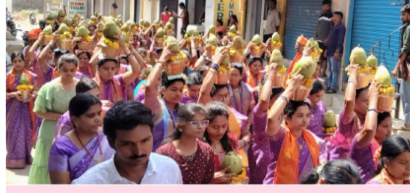
చేగుంట జూన్ 28 (తెలంగాణ పత్రిక) రిపోర్టర్)

చేగుంట మండల కేంద్రంలోని హనుమాన్ దేవాలయం నుంచి వానవి మాత దేవాలయం వరకు ఆర్యవైశ్య సంఘం ఆధ్వర్యంలో 108 కళాశాలతో అమ్మవారిని భారీగా ఊరేగింపు నిర్వహించి దేవాలయంలో అమ్మవారికి అభిషేకం ఘనంగా నిర్వహించారు మూడు రోజులపాటు నిర్వహించే ఉత్సవాలను అమ్మవారి అభిషేకంతో ప్రారంభమై కుంకుమార్చన తదితర కార్యక్రమాలు నిర్వహిస్తున్నట్లు తెలిపారు.