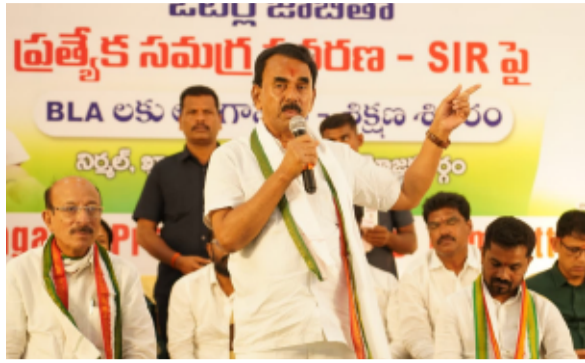
దీనిపై పరిపాలన పరమైన అంశాలను క్యాబినెట్ సమావేశంలో ప్రస్తావిస్తానని భరోసా ఇచ్చారు. ఎవరు కూడా నిరాశ నిస్పృహలకు గురి కావద్దని సూచించారు సమష్టిగా కష్టపడి పనిచేసి పార్టీ బలోపేతం చేయడానికి పని చేయాలని హితవు పలికారు బిహార్, పశ్చిమ బెంగాల్ రాష్ట్రాల్లో