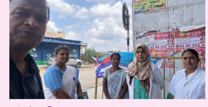
కామారెడ్డి, జూన్ 28, (తెలంగాణ పత్రిక జిల్లా ప్రతినీధి) కామారెడ్డి జిల్లా లోని ఆయా మండలాల కేంద్రాలతో పాటు గ్రామాలలో సూశివనగర్ మండల కేంద్రం తో పాటు భూపల్లి జనగాం లింగంపల్లి తుక్కుజివాడి తిమ్మాజివాడి ఉత్తూర్ పల్లి. పల్లిపల్లి తండా. యాచారం తండా సజ్జనాయక్ తాండ. పూర్వ నాయక్ తాండ. తగ్గి కల్వూర్. పద్మా జీవడి మొదలగు. అడ్లూరు ఎల్లారెడ్డి మర్ల తిరుమన పల్లి కుత్తియ్యార ధర్మరావుపేట ప్రాథమిక ఆరోగ్య కేంద్రం పరిధిలో ఈరోజు నిర్వహించిన పల్నే పోలియో కార్యక్రమం విజయవంతంగా జరిగింది. మొత్తం 3,044 మంది 5 సంవత్సరాల లోపు చిన్నారులు లక్ష్యంగా ఉండగా, 96.4% కవరేజ్ సాధించి 2,934 మంది చిన్నారులకు పోలియో చుక్కలు వేయబడినాయి. ఈ కార్యక్రమంలో 80 మంది సిబ్బంది ( ఏఎన్ఎం, ఆశా కార్యకర్తలు, అంగన్వాడీ టీచర్లు, వాలంటీర్లు, 2 సూపర్వైజర్ బృందాలు, 1 మొబైల్ టీమ్, 1 ట్రాన్సిట్ టీమ్ పాల్గొని 19 పోలియో బూతుల ద్వారా సేవలు అందించారు. బూత్లో పోలియో చుక్కలు వేయించుకోలేకపోయిన చిన్నారులను గుర్తించి, రాజీయే 2 రోజుల పాటు ఏఎన్ఎం మరియు ఆశా కార్యకర్తలు ఇంటింటికీ వెళ్లి పోలియో చుక్కలు వేస్తారు. ఐదు సంవత్సరాల లోపు ఏ చిన్నారి కూడా పోలియో చుక్కలు మిస్ కాకుండా తల్లిదండ్రులు పూర్తి సహకారం అందించాలని సూశివనగర్ ప్రాథమిక ఆరోగ్య కేంద్రం వైద్యాధికారి డా. అస్మా అప్పీన్ కోరారు. ఈ కార్యక్రమంలో హెల్త్ డిపార్ట్మెంట్ నాగరాజు మరియు ఏఎన్ఎం లు ఆశ వర్కర్లు తదితరులు పాల్గొన్నారు.