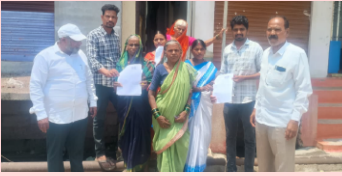
తానూర్: 28జూన్ (తెలంగాణ పత్రిక)