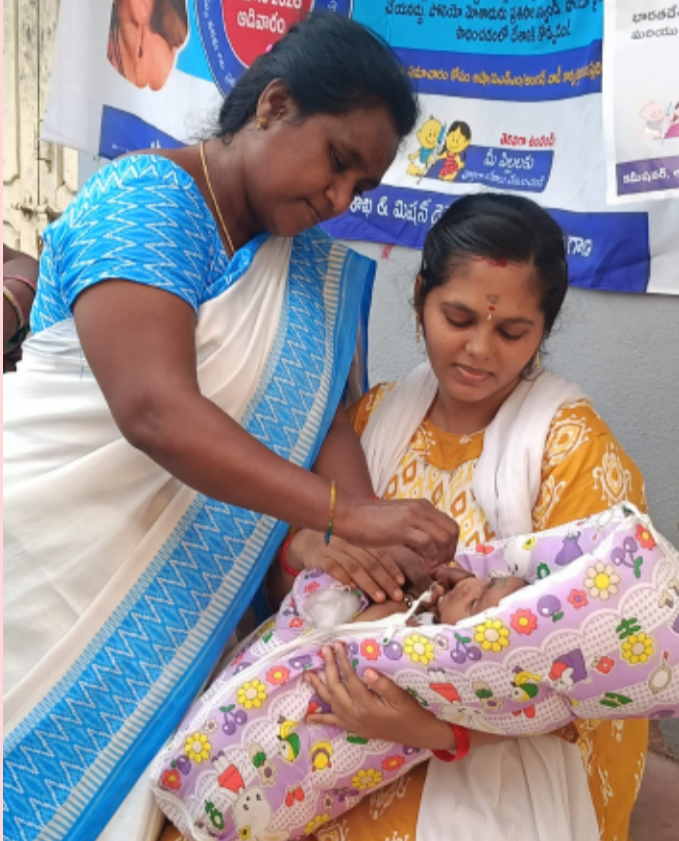
పెద్దపల్లి, ప్రతినది జూన్ 28 ( తెలంగాణ పత్రిక )

తెలంగాణలో ఐదేళ్లలోపు చిన్నారులందరికీ పల్స్ పోలియో చుక్కలు అందించే రాష్ట్రవ్యాప్త కార్యక్రమం జూన్ 28న ప్రారంభం కానుంది. ఈ ప్రత్యేక టీకా కార్యక్రమంలో పుట్టిన శిశువుల నుంచి ఐదేళ్లలోపు ప్రతి చిన్నారికి పోలియో చుక్కలు వేయాలని ప్రభుత్వం నిర్ణయించింది. తల్లిదండ్రులు తమ పిల్లలను తప్పనిసరిగా సమీప పల్స్ పోలియో కేంద్రాలకు తీసుకువచ్చి టీకాలు వేయించాలని విజ్ఞప్తి చేశారు. రాష్ట్రంలోని ఏ చిన్నారి కూడా ఈ కార్యక్రమానికి దూరం కాకుండా అన్ని చర్యలు తీసుకున్నామని పోలియో కెందర్స్ వల్ల వచ్చే ప్రమాదకరమైన వ్యాధి అని, దీనికి చికిత్స కంటే నివారణే ఉత్తమ మార్గమని తెలియచేసి పోలియో వ్యాధిని పూర్తిగా నిర్మూలించాలంటే ప్రతి చిన్నారికి తప్పనిసరిగా పోలియో చుక్కలు వేయించాలని తల్లిదండ్రులకు సూచించారు. ఐదేళ్లలోపు పిల్లలను సమీప పోలియో కేంద్రాలకు తీసుకువచ్చి చుక్కలు వేయించాలన్నారు. ఈ కార్యక్రమంలో వైద్య సిబ్బంది, ఆశా కార్యకర్తలు, అంగన్వాడీ సిబ్బంది, గ్రామ పెద్దలు పాల్గొన్నారు.