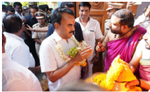
ఆలయాన్ని మంత్రి సందర్శించి ఘటనపై ఆరా తీశారు. ఆలయ భద్రతా ఏర్పాట్లపై అధికారులతో

-ఆలయ అభివృద్ధి పనులపై సమీక్ష -బెండ్ర ప్రక్రియను వేగవంతం చేయాలని ఆదేశం నిర్మల్ జిల్లా ప్రతినిధి బాసర,జూన్ 28 (తెలంగాణ పత్రిక) పర్యాటక, సాంస్కృతిక శాఖ మంత్రి జూపల్లి కృష్ణారావు ఆదివారం బాసరలోని శ్రీ జ్ఞాన సరస్వతీ అమ్మవారిని దర్శించుకుని ప్రత్యేక పూజలు నిర్వహించారు. ఆలయానికి చేరుకున్న మంత్రికి ఆలయ అధికారులు, అర్చకులు మంగళమాయిద్యాలు, పూర్ణకుంభంతో ఘన స్వాగతం పలికారు. అనంతరం ఇటీవల చోరీ జరిగిన మహంకాళి అమ్మవారి