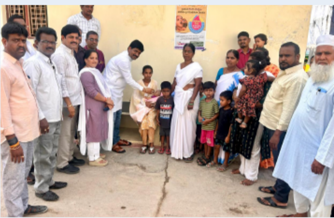
చందూరు తెలంగాణ పత్రిక జూన్ 28