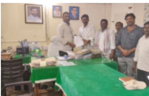
ఉంచాలని యూరియా కొరత లేకుండా ముందస్తు ప్రణాళికలు సిద్ధం చేయాలని భూమి ఉండి పాస్ పుస్తకం రాని రైతులు అనేకమంది యూరియా కొరకు ఇబ్బంది పడుతున్నారు భూమిని నమ్ముకొని సాగు చేస్తున్న ప్రతి రైతుకు యూరియా అందించాలని పాస్ పుస్తకం తో సంబంధం లేకుండా యూరియా సరఫరా