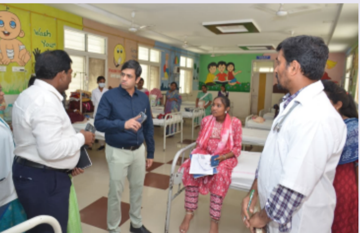
యాదాద్రి భువనగిరి తెలంగాణ పత్రిక జూన్ 17

భువనగిరి పట్టణ కేంద్రంలోని ప్ర భుత్వ జనరల్ ఆసుపత్రిని జిల్లా కలెక్టర్ సందర్శించారు. ఈ సందర్భంగా జిల్లా కలెక్టర్ ఆసుపత్రిలో ఆబా రిజిస్ట్రేషన్ చేసే విధానాన్ని స్వయంగా పరిశీలించి సంబంధిత అధికారులను తెలుసు కున్నారు. మన యాదాద్రి భువనగి రి జిల్లా మోడల్ జిల్లాగా ఎంపిక చేసినందుకు ఆయుష్మాన్ భారత్ డిజిటల్ మిషన్ లో భాగముగా ఆయుష్మాన్ భారత్ టాల్ ఎకౌంటు లో నమోదు సంఖ్య పెంచమని ఆదేశించడం జరిగింది. ఆసుపత్రిలో శానిటేషన్, బ్లడ్ బ్యాంకు, నవజాత శిశువు ప్రత్యేక సంరక్షణలో అందిస్తున్న సేవలగు రించి, బాలింత తల్లలకు, పిల్లలకు అందుతున్న సేవలు, ల్యాబ్ లో అందిస్తున్న పరీక్షల వివరాలు, టీ హాట్ లో అందుతున్న సేవల వివ రాలను కలెక్టర్ అడిగి తెలుసుకు న్నారు. ఆసుపత్రిలో పనిచేయచున్న ఉ ద్యోగుల, ల్యాబ్ టెక్నిషియన్స్ భర్తీ చేయుటకు అవకాశాలు గురించి తెలుసుకున్నారు. ఆసుపత్రి అభివృద్ధి సంఘం సమా వేశం నిర్వహించుటకు తేదీని నిర్ణ యించమని ఆదేశాలు ఇవ్వడ మైనది. ఆసుపత్రిలో డాక్టర్లు, సిబ్బంది స మయానికి వస్తున్నారా అడిగి తె లుసుకున్నారు. ఆసుపత్రికి వచ్చే రోగులకు నాణ్యమైన వైద్యం అం దించాలన్నారు. ప్రతి రోజు ఇన్ పే షెంట్, బెట్ పేషంట్ ఎంతమంది పేషంట్లు వస్తున్నారని అడిగి తెలు సుకున్నారు. ఆసుపత్రిలో ఉన్న వార్డులను పరిశీలించారు. వార్డు లో చికిత్స పొందుతున్న పేషెంట్ల ను వారికి అందుతున్న వైద్యం గురించి అడిగి తెలుసుకున్నారు. ప్రతి నెల ఎన్ని డెలివరీలు జరుగు తున్నాయని అడిగి తెలుసుకొని ప్రభుత్వ ఆసుపత్రిలో సాధారణ ప్రసవాల సంఖ్య పెరిగేలా సిబ్బంది కృషి చేయాలన్నారు. ఆసుపత్రిలో మందుల కొరత లేకుండా చూడా లన్నారు.