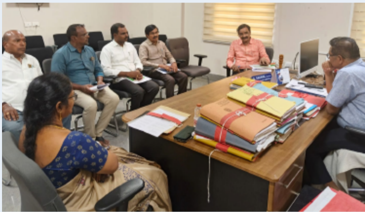
సిరిసిల్ల జిల్లా ప్రతినిధి, జూన్ 17, తెలంగాణ పత్రిక

రాజన్న సిరిసిల్ల జిల్లాలో రబీ 2025-26 సీజన్కు సంబంధించి ధాన్యం కొనుగోళ్లు కొనసాగుతున్నాయి. జిల్లాలో ఏర్పాటు చేసిన మొత్తం 236 కొనుగోలు కేంద్రాల ద్వారా తేదీ 16.06.2026 వరకు 46,378 మంది రైతుల నుంచి 3.65 లక్షల మెట్రిక్ టన్నుల ధాన్యాన్ని కొనుగోలు చేయడం జరిగింది. జిల్లా అదనపు కలెక్టర్ ఆదేశాల మేరకు జిల్లాలోని అన్ని ధాన్యం కొనుగోలు కేంద్రాల నుంచి కొనుగోలు చేసిన ధాన్యాన్ని నిబంధనల ప్రకారం రైస్ మిల్లులు, గోదాములకు ట్రక్ చీట్ ప్రకారం తరలించాల్సి ఉంటుంది. ధాన్యం తరలింపు ప్రక్రియలో ఏవైనా అవకతవకలు జరిగినా, నిబంధనలకు విరుద్ధంగా వ్యవహరించినా సంబంధిత కొనుగోలు కేంద్రాల ఇన్చార్జీలు, ఏపీఎంలు, సీఈఓలు, సీసీలు, బాధ్యత వహించాల్సి ఉంటుందని జిల్లా పౌర సరఫరాల శాఖ అధికారి తెలిపారు. ప్రస్తుతం విజిలెన్స్ అండ్ ఎన్ఫోర్స్ మెంట్ బృందం, హైదరాబాద్ వారు ధాన్యం కొనుగోలు కేంద్రాలను పరిశీలిస్తున్నారని, కావున అధికారులు, సిబ్బంది అప్రమత్తంగా ఉండి నిబంధనలను తప్పనిసరిగా పాటించాలని సూచించారు.