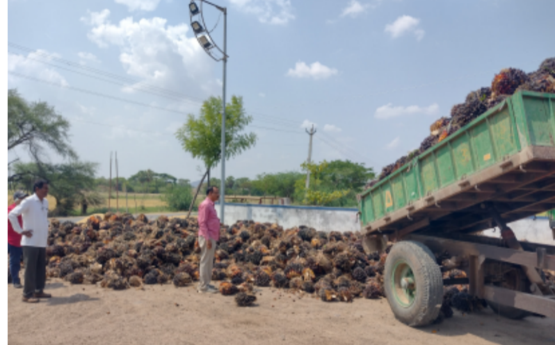
సిరిసిల్ల జిల్లా ప్రతినిధి, జూన్ 17, తెలంగాణ పత్రిక

రాజన్న సిరిసిల్ల జిల్లాలో 2022-23 ఆర్థిక సంవత్సరం నుండి ఆయిల్ పామ్ పంట సాగు ప్రారంభమైంది. 2022-23 నుండి 2025-26 ఆర్థిక సంవత్సరం వరకు నాలుగు సంవత్సరాల కాలంలో జిల్లాలో మొత్తం 2,515 ఎకరాల్లో ఆయిల్ పామ్ సాగు జరుగుతోంది. ఆయిల్ పామ్ మొక్కలు నాణీన తర్వాత నాలుగో సంవత్సరం నుంచి దిగుబడి ప్రారంభమవుతుంది. మొదటి సంవత్సరం ఎకరానికి సుమారు 4 నుంచి 5 టన్నుల దిగుబడి వస్తుండగా, ప్రతి సంవత్సరం దిగుబడి క్రమంగా పెరుగుతూ ఎనిమిదో సంవత్సరం నుంచి 10 నుంచి 11 టన్నుల వరకు ప్రతి సంవత్సరం దిగుబడి పొందే అవకాశం ఉంటుంది. ఈ దిగుబడి సుమారు 35 సంవత్సరాల వరకు కొనసాగుతుంది. మొక్కలు నాణీన నాలుగో సంవత్సరం నుంచి 35 సంవత్సరాల వరకు రైతులకు