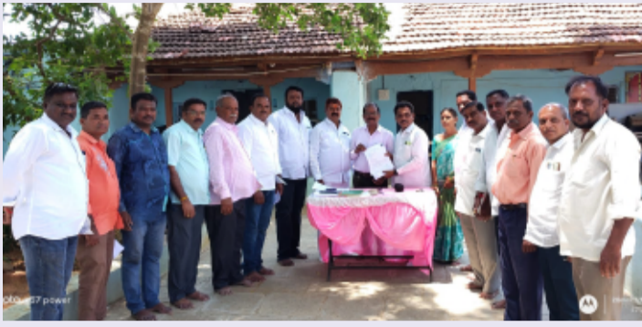
కామారెడ్డి, జూన్ 17, (తెలంగాణ పత్రిక జిల్లా ప్రతినిధి)