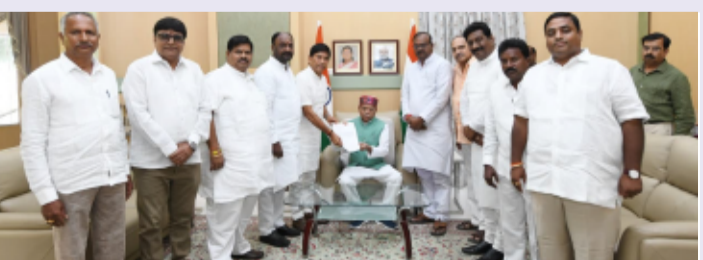
యాదాద్రి భువనగిరి తెలంగాణ పత్రిక జూన్ 17

తెలంగాణ రైతుల విషయంలో ఫసల్ బీమా అమలు చేయాలని వెంటనే రైతాంగ సమస్యలు పరి పూరించాలని కోరుతూ రాష్ట్ర గవ ర్నర్ కు తెలంగాణ కిసాన్ మోర్చా ఆధ్వర్యంలో శివ ప్రతాప్ శుక్ల కి మెమోరండం సమర్పించడం జరిగింది. వారు రాష్ట్ర ప్రభుత్వానికి సూచన లు నలాల్చి అమలు చేసే ప్రయ త్నం చేస్తాను హామీ ఇవ్వడం జరి గింది. ఈ కార్యక్రమంలో భారతీయ జన తా పార్టీ కిసాన్ మోర్చా నాయకు లు పాల్గొన్నారు.