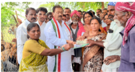
అందజేశారు. అనంతరం కామారెడ్డి జిల్లా కలెక్టర్ గారితో షోన్లో మాట్లాడి, బాధిత రైతుకు తగిన సహాయం ప్రభుత్వ సహాయం అందేలా చర్యలు