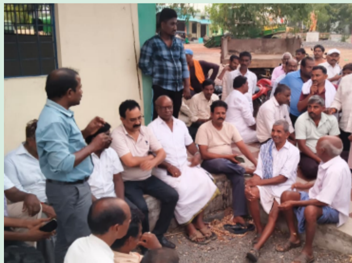
అత్మకూరు, జూన్ 15, (తెలంగాణ పత్రిక)

-నీరుకుళ్ళ పెంచకపేట కేశవాపూర్ ప్రజా ప్రతినిధులుని ప్రజలు డిమాండ్