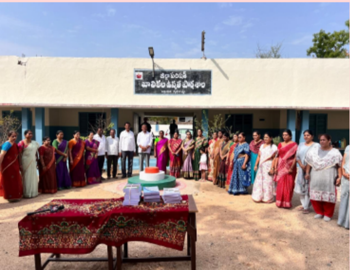
మిర్యాలగూడ ప్రతినిధి//జూన్ 15:(తెలంగాణ పత్రిక):-