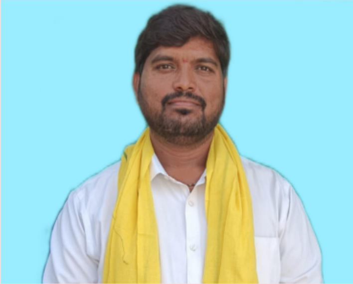
మిర్యాలగూడ ప్రతినిధి //జూన్ 15:(తెలంగాణ పత్రిక):-

తెలంగాణ రాష్ట్రంలో పెండింగ్ లో ఉన్న ఫీజు రియంబర్స్ బకాయిలు వెంటనే చెల్లించాలని తెలంగాణ తెలుగుదేశం పార్టీ నాయకులు పోగుల సైదులు గాడ్ ప్రభుత్వాన్ని డిమాండ్ చేశారు. తెలంగాణ రాష్ట్ర సర్కార్ విద్యార్థుల జీవితాలతో చెలగాటలాడుతుందని అన్నారు ప్రభుత్వం జీవో నెంబర్ 7ను వెంటనే రద్దుచేసి పెండింగ్ బకాయిలు చెల్లించాలని కోరారు. విద్యార్థుల జీవితాలను ప్రశ్నార్థకంగా మార్చే పనులు తక్షణమే ఉపసంహరించుకోవాలన్నారు అలివికాని హామీలతో అధికారంలోకి వచ్చిన తర్వాత హామీలు నెరవేర్చడానికి విద్యార్థుల జీవితాలతో చెలగాటలాడితే సహించేది లేదని హెచ్చరించారు. మీ హామీల అమలు పరచడానికి పథకాలు నిర్వహించడానికి విద్యార్థుల భవిష్యత్తుతో ఆడుకోవద్దన్నారు విద్య విద్యార్థుల హక్కు అని కొట్లాడి సాధించుకుంటామని అన్నారు.