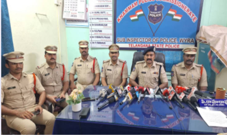
తెలంగాణ పత్రిక జూన్ 13 ఖమ్మం

వ్యవస్థీకృత నేరాలకు పాల్పడే ఇసుక మాఫియాపై కఠిన చర్యలు.. అక్రమార్కులపై హిస్సర్ షీట్లు తెరిచేందుకు చర్యలు చేపట్టిన.. వైరా ఏసీపీ సారంగపాణి