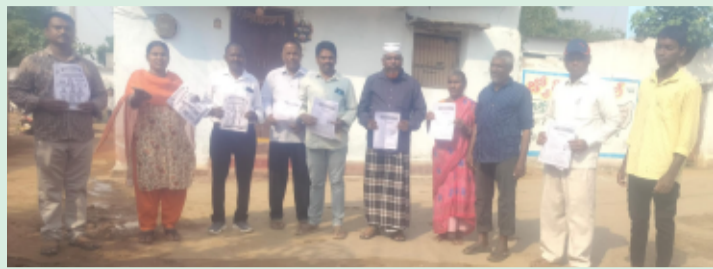
మాడ్లపల్లి/సోన్చేరు/జూన్ 12: (తెలంగాణ పత్రిక):-