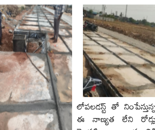
లోపలడస్ట్ తో నింపేస్తున్న ఈ నాణ్యత లేని రోడ్డు మొదటి వర్షానికి కొట్టుకుపోవడం ఖాయమని స్థానికులు మండిపడుతున్నారు. ఇంజనీర్ అధికారులు పర్యవేక్షణ చూద్దాం అన్న ఎక్కడ చూసినా కనిపించదు. సిబ్బంది ఏం చేస్తున్నట్లు ఏ ఒక్కరు తనిఖీ చేసిన దాఖలాలు ఇంత వరకు లేవు అధికారులు కాంట్రాక్టర్లతో చేతులు కలిపి కమిషన్లు మత్తులో మునిగిపోతున్నారు. అందుకే ఈ అక్రమన బాహుళంగా జరుగుతున్నాయని గ్రామస్థులు ఆరోపిస్తున్నారు. ప్రజలు వెంటనే జిల్లా ఉన్నతాధికారులు స్పందించి మాడుగులపల్లి రోడ్డు పనులను తనిఖీ చేయాలని నాణ్యత ప్రమాణాలు పాటించాలని కాంట్రాక్టర్లపై చర్య తీసుకోవాలని స్థానికులు కోరుతున్నారు.

సగానికి వదిలిపెట్టి రోడ్డు వేరుటం వలన అక్కడ ప్రమాదాలు జరిగిపోతుంటే అవకాశం చాలా వరకు ఉన్నది ఏదేమైనా రోడ్డు పటిష్టంగా ఉండాలంటే దాన్ని పునాది బలంగా ఉంచాలి నిబంధనల ప్రకారం రోడ్డు నిర్మాణంలో నిర్ణీత మోతాదులో ఇసుకను వినియోగించి పనులు చేయాలి. కానీ ఇక్కడ కాంట్రాక్టర్లు ఆ నిబంధనలు వర్తించవు కాబోలు ఇసుక వాడితే ఖర్చు పెరుగుతుందని ఉద్దేశంతో దాని స్థానంలో నాణ్యతలేని కంకర పొడి (డస్ట్) ను విచ్చలువిడిగా వాడుతున్నారు. ఈ డస్ట్ తో రోడ్డు నిర్మిస్తే అది లోపల గట్టిదనాన్ని కోల్పోయి వాహనాలు రాకపోకలకు మరియు వర్షాలకు మొదలైన కొద్ది రోజులకే కృంగిపోతుంది కేవలం పైపైన రంగు పూసి