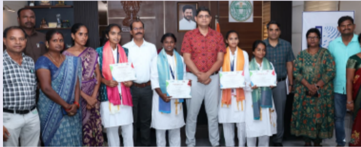
కామారెడ్డి, జూన్ 12, (తెలంగాణ పత్రిక జిల్లా ప్రతినిధి)