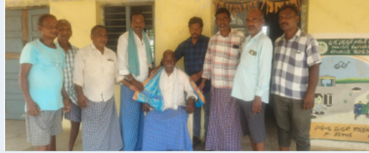
సిరిసిల్ల జిల్లా ప్రతినిధి, జూన్ 12, తెలంగాణ పత్రిక