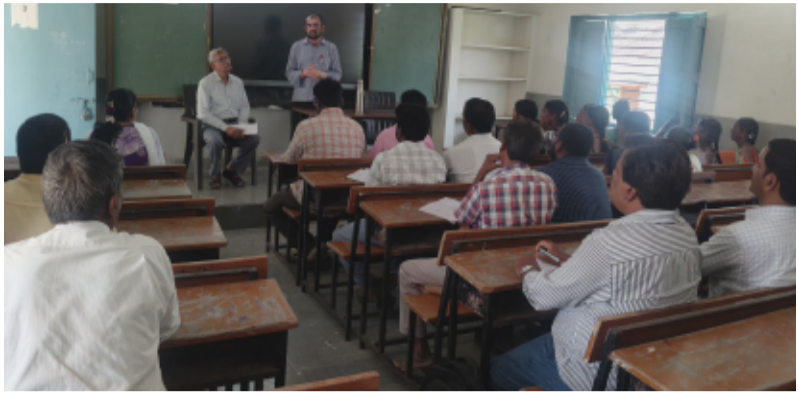
-మధ్యాహ్న భోజన నిర్వహణలో పరిశుభ్రతకు ప్రాధాన్యం -విద్యార్థులకు సురక్షిత ఆహారం అందించడమే ధ్యేయం -మధ్యాహ్న భోజన పథకం సమర్థ నిర్వహణపై ప్రధానోపాధ్యాయులు, వంట కార్మికులకు శిక్షణ -ప్రధానోపాధ్యాయులు సాంబయ్య, సీతారాం వెల్లుర్తిమండల ప్రతినిధి,జూన్ 12 (తెలంగాణ పత్రిక):

రాష్ట్ర ప్రభుత్వం పాఠశాలల్లో విద్యార్థులకు నాణ్యమైన, పరిశుభ్రమైన మధ్యాహ్న భోజనం అందించాలనే లక్ష్యంతో చేపడుతున్న కార్యక్రమాల్లో భాగంగా వెల్లుర్తి మండల కేంద్రంలోని జిల్లా పరిషత్ ఉన్నత పాఠశాలలో శుక్రవారం ప్రధానోపాధ్యాయులు మరియు మధ్యాహ్న భోజన వంట కార్మికులకు ఒకరోజు శిక్షణ కార్యక్రమాన్ని నిర్వహించారు. సోమవారం నుంచి పాఠశాలలు పునఃప్రారంభం కానున్న నేపథ్యంలో విద్యార్థులకు అందించే మధ్యాహ్న భోజనం నాణ్యత, పరిశుభ్రత ప్రమాణాలపై ఈ శిక్షణలో అవగాహన కల్పించారు.