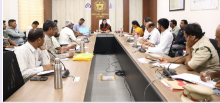
సిరిసిల్ల జిల్లా ప్రతినిధి, జూన్ 10, తెలంగాణ పత్రిక

-వివిధ ప్రాజెక్టులు, రైల్వే ప్రాజెక్ట్ భూ సేకరణపై అధికారులతో సమీక్ష