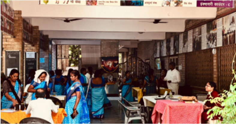
-ఆరోగ్య సేవలో ఆధ్యాత్మికత.. మృగశిర కార్తి సందర్భంగా విశేష స్పందన

మేధుల్ జూన్ 10 (తెలంగాణ పత్రిక):- గుండ్ర పోచంపల్లి డివిజన్ పరిధిలోని కండ్లకోయ గల సాయి గీత ఆశ్రమంలో పరిధిలోని మృగశిర కార్తి పర్వదినం రాగానే ఆస్తమా బాధితుల చూపు ప్రత్యేక వైద్య శిబిరాలపై పడుతుంది. స్వానకోశ సంబంధిత సమస్యలతో బాధపడుతున్న వారికి ఉపశమనం కలిగించాలనే లక్ష్యంతో దేశంలోని పలు ప్రాంతాల్లో నిర్వహించే సంప్రదాయ వైద్య కార్యక్రమాలకు విశేష