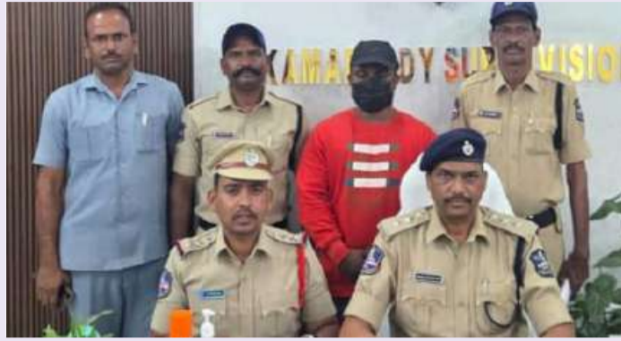
కామారెడ్డి, జూన్ 25, (తెలంగాణ పత్రిక జిల్లా ప్రతినిధి)