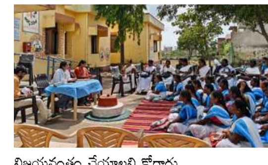
విజయవంతం చేయాలని కోరారు.

బారి నుండి కాపాడడానికి పల్న పోలియో కార్యక్రమం ఎంతగానో దోహద పడుతుందని తెలిపారు. ఐదు సంవత్సరాల లోపు గల పిల్లలందరికీ పోలియో చుక్కలు వేయించాలని తెలిపారు ఈనెల 28న బూత్ లెవెల్ యాక్టివిటీ ఉంటుందని మిగిలిపోయిన చిన్నారులకు 29 30 తేదీలలో ఇంటింటి సర్వే ద్వారా పోలియో చుక్కలు వేయాలని చెప్పారు ఈ కార్యక్రమాన్ని పక్కపట్టణాల్లో నిర్వహించి