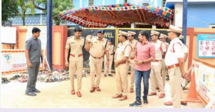
భద్రాద్రి కొత్తగూడెం తెలంగాణ పత్రిక జూన్ 21

నీట్ యూజీ 2026 పరీక్షలు పారదర్శకంగా నిర్వహించేందుకు భద్రాద్రి కొత్తగూడెం జిల్లా ఎస్సీ రోహిత్ రాజు ఐపిఎస్ ఆదివారం కొత్తగూడెం పట్టణంలోని సింగరేణి ఉమెన్స్ కళాశాల, రామచంద్ర డిగ్రీ కళాశాలలో నిర్వహిస్తున్న నీట్ పరీక్ష కేంద్రాలను సందర్శించి భద్రతా ఏర్పాట్లను పరిశీలించారు. పరీక్ష ముగిసే వరకు శాంతి భద్రతల పరిరక్షణలో భాగంగా సెక్షన్ 163దీనికూ అమల్లో ఉంటుందని పేర్కొన్నారు. పరీక్ష కేంద్రాల్లోని సీసీ వెంట్రాల్ పనితీరు, అభ్యర్థుల తనిఖీ విధానం, ఇతర అంశాలపై అధికారులకు సూచనలు చేశారు. ఏదైనా సమస్య తలెత్తితే పోలీసు అధికారులకు తెలియజేయవలసిందిగా అధికారులను కోరారు. పరీక్ష కేంద్రాల వద్ద శాంతి భద్రతలను భంగం కలిగించిన, నిషేధాజ్ఞలు మీరిన కఠిన చర్యలు తీసుకుంటామని హెచ్చరించారు.