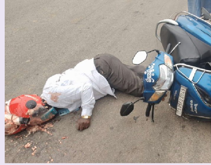
మాడుగులపల్లి/నల్గొండ/జూన్ 21:(తెలంగాణ పత్రిక):-