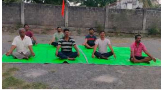
మానసిక ఆరోగ్యం మెరుగుపడటంతో పాటు ఒత్తిడి తగ్గి ఏకాగ్రత పెరుగుతుందని తెలిపారు. ఆధునిక జీవనశైలిలో ఆరోగ్య పరిరక్షణకు యోగా అత్యంత

అంతర్జాతీయ యోగా దినోత్సవాన్ని పురస్కరించుకుని అత్యుక్తారు మండల కేంద్రంలో రాష్ట్రీయ స్వయంసేవకే సంఘ్ (ఆర్ఎస్ఎస్) ఆధ్వర్యంలో ఆదివారం యోగా కార్యక్రమాన్ని ఘనంగా నిర్వహించారు. ఈ కార్యక్రమంలో ఆర్ఎస్ఎస్ స్వయంసేవకులు, యువకులు, విద్యార్థులు, యోగా సాధన చేశారు. ఈ సందర్భంగా యోగా శిక్షకులు వివిధ ఆసనాలు, ప్రాణాయామ పద్ధతులను ప్రదర్శించి వాటి ప్రాముఖ్యతను వివరించారు. ప్రతిరోజూ యోగా చేయడం ద్వారా శారీరక, మానసిక ఆరోగ్యం మెరుగుపడటంతో పాటు ఒత్తిడి తగ్గి ఏకాగ్రత పెరుగుతుందని తెలిపారు. ఆధునిక జీవనశైలిలో ఆరోగ్య పరిరక్షణకు యోగా అత్యంత