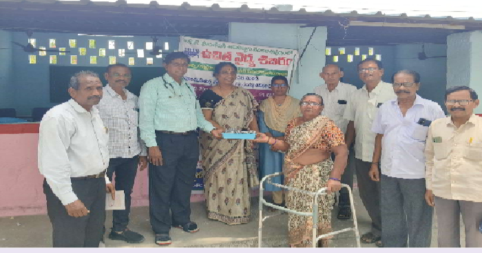
మిర్యాలగూడ ప్రతినిధి//జూన్ 21:(తెలంగాణ పత్రిక):-