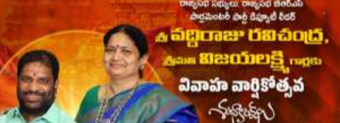
అభినందనీయమన్నారు. వివాహ వార్షికోత్సవ వేడుకలను విద్యార్థుల సమక్షంలో నిర్వహించడం ద్వారా ఆనందాన్ని పంచుకున్నామని తెలిపారు. ఈ కార్యక్రమంలో వనవాసి కళ్యాణ పరిషత్ విద్యార్థులు, బీసీ సంఘ ప్రతినిధులు తదితరులు పాల్గొన్నారు.