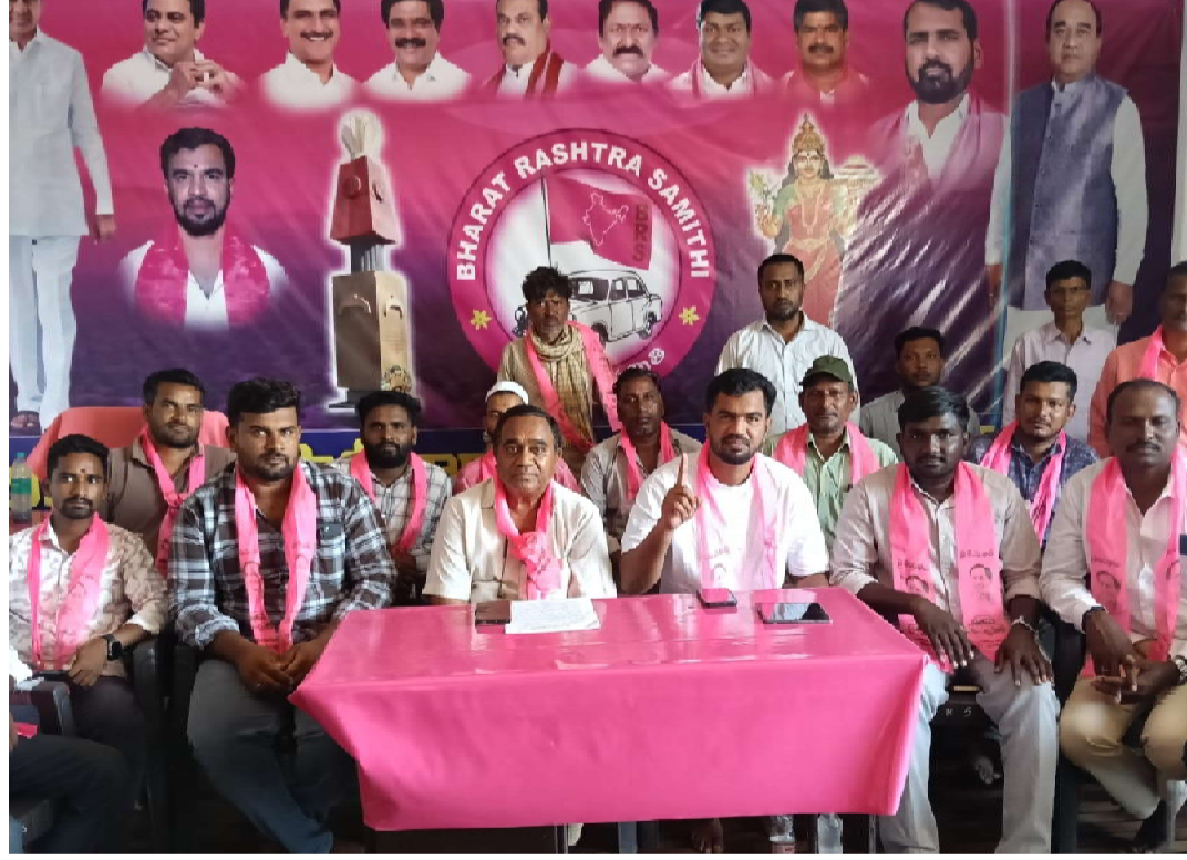
యూరియా యాప్ పై రాష్ట్ర ప్రభుత్వం వెనక్కి తగ్గి వెంటనే యాప్ ను తొలగించాలని షాహూర్ లోనే నేరుగా యూరియా విక్రయించాలని కోరారు. రైతు బీమాకు సంబంధించి ప్రీమియం ఇప్పటివరకు చెల్లించలేదని వార్తలు వస్తున్నాయని వెంటనే రాష్ట్ర ప్రభుత్వం రైతు బీమాకు సంబంధించిన ప్రీమియం చెల్లించి రైతులను ఆదుకోవాలని కోరారు. రైతులను మోసం చేస్తున్న కాంగ్రెస్ ప్రభుత్వానికి వచ్చే ఎన్నికల్లో రైతులే బుద్ధి చెబుతారని అన్నారు. ఇప్పటికే రైతు బంధు పేరు మార్చి రైతు భరోసాగా ఇస్తున్న రేవంత్ రెడ్డి ప్రభుత్వం రెండున్నర సంవత్సరాల్లో మూడుసార్లు రైతు భరోసాను ఎగ్జిట్ చేసింది చెప్పారు. రైతుల పంట పండించే సమయానికి వారికి అకౌంట్లో రైతు భరోసా నిధులు వేయాలని సూచించారు. లేదంటే రైతుల తరఫున రాష్ట్ర ప్రభుత్వంపై పోరాడడానికి బీఆర్ఎస్ పార్టీ