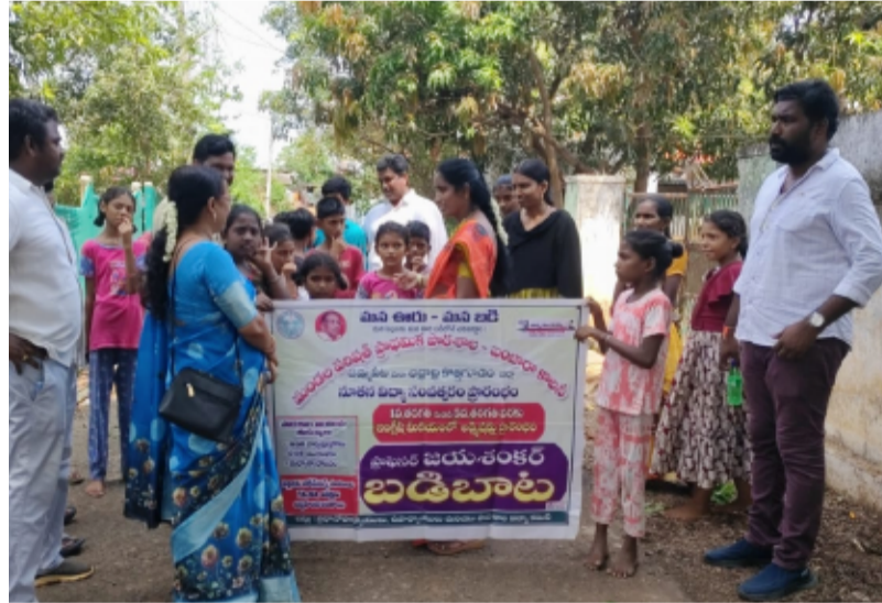
-బంజారా కాలనీ ప్రాథమిక పాఠశాల ప్రాఫెసర్