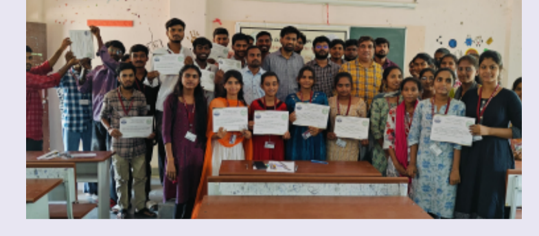
సిరిసిల్ల జిల్లా ప్రతినిధి, జూన్ -03, తెలంగాణ పత్రిక

తెలంగాణ రాష్ట్ర ప్రభుత్వం చేపట్టిన “99 రోజుల ప్రజా వాలన -- ప్రగతి ప్రణాళిక” కార్యక్రమంలో భాగంగా తెలంగాణ కాలవ్య నియంత్రణ మండలి ఆధ్వర్యంలో రాజన్న సిరిసిల్లలోని జేఎన్టీయూ విశ్వవిద్యాలయ ఇంజనీరింగ్ కళాశాల మరియు ప్రభుత్వ డిగ్రీ కళాశాల విద్యార్థులకు పర్యావరణ అంశాలపై అవగాహన కల్పించేందుకు పర్యావరణ క్వీజ్ పోటీ నిర్వహించారు. విద్యార్థుల్లో వాయు కాలుష్యం, జల కాలుష్యం, ప్లాస్టిక్ వ్యర్థాల నిర్వహణ, ఘన వ్యర్థాల నిర్వహణ, శక్తి సంరక్షణ, పర్యావరణ పరిరక్షణ వంటి అంశాలపై అవగాహన పెంపొందించడమే ఈ కార్యక్రమం ప్రధాన లక్ష్యమని నిర్వాహకులు తెలిపారు. విద్యార్థులు ఉత్సాహంగా పాల్గొని తమ పర్యావరణ పరిజ్ఞానాన్ని ప్రదర్శించారు. ఈ సందర్భంగా మాట్లాడిన అధికారులు పర్యావరణ పరిరక్షణలో యువత కీలక పాత్ర పోషించాలని, ప్రకృతి వనరుల సంరక్షణ ప్రతి ఒక్కరి బాధ్యత అని పేర్కొన్నారు. పర్యావరణహిత జీవన విధానాలను అలవర్చుకోవడం ద్వారా స్థిరమైన అభివృద్ధి సాధ్యమవుతుందని వివరించారు. ఈ కార్యక్రమంలో తెలంగాణ కాలవ్య నియంత్రణ మండలి నోడల్ అధికారి, జేఎన్టీయూ విశ్వవిద్యాలయ ఇంజనీరింగ్ కళాశాల ప్రిన్సిపాల్ పాల్గొని విద్యార్థులను ప్రోత్సహించారు. పర్యావరణ పరిరక్షణకు ప్రతి విద్యార్థి బాధ్యతాయుతంగా వ్యవహరించాలని సూచించారు.