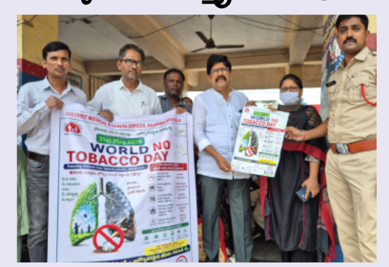
సిరిసిల్ల జిల్లా ప్రతినిధి, జూన్ -03, తెలంగాణ పత్రిక