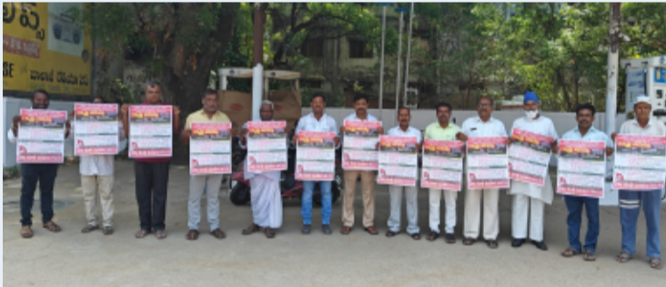
కామారెడ్డి, జూన్ 2 ( తెలంగాణ పత్రిక జిల్లా ప్రతినిధి)