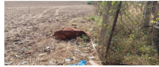
అధికారుల నిర్లక్ష్యం లేక మృతి చెందిందని ఆగ్రహం వ్యక్తం చేశారు. పాఠశాల ఆవరణలో ట్రాన్స్ఫార్మర్ తో పాటు విద్యుత్ లైన్ ఉండటంతో విద్యార్థులకు