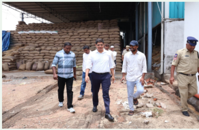
కామారెడ్డి, మే 28, ( తెలంగాణ పత్రిక జిల్లా ప్రతినిధి)