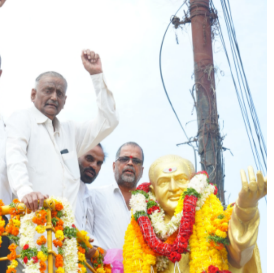
గౌరవించడం మన అందరి బాధ్యత అని అన్నారు. ఈ కార్యక్రమంలో స్థానిక ప్రజాప్రతినిధులు, వివిధ పార్టీల నాయకులు, ఎన్టీఆర్ అభిమాన సంఘాల ప్రతినిధులు, మరియు పెద్ద సంఖ్యలో ప్రజలు పాల్గొని నివాళులర్పించారు.

నూతన ఒరవడి బిరస్కరణీయం అని అన్నారు. పేదలకు రూ.2 కేజిల బియ్యం, జనతా వస్త్రాలు, పక్కా గృహాల వంటి చారిత్రాత్మక పథకాలను ప్రవేశపెట్టి సంక్షేమ పాలనకు ఆయనే నిజమైన నిర్వహనం ఇచ్చారు. సమాజమే దేవాలయం, ప్రజలే దేవుళ్లు అనే నినాదంతో ఆయన చేసిన సేవలు ఎప్పటికీ మరచరానివి అని కొనియాడారు. ఎన్టీఆర్ కేవలం ఒక పార్టీకి పరిమితమైన నాయకుడు కాదు, ఆయన యావత్ తెలుగు జాతి ఆస్తి. రాజకీయాలు వేరైనా, తెలుగువారి ఆత్మగౌరవాన్ని కాపాడిన ప్రజా నాయకుడిగా ఆయన ఆశయాలను, స్ఫూర్తిని