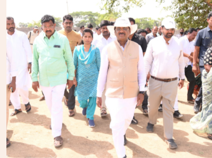
(తెలంగాణ పత్రిక జిల్లా ప్రతినిధి):

-రాష్ట్ర కార్మిక,ఉపాధి శిక్షణ, కర్మాగార,గనులు, భూగర్భ శాఖ మంత్రి గద్దం వివేకా నంద