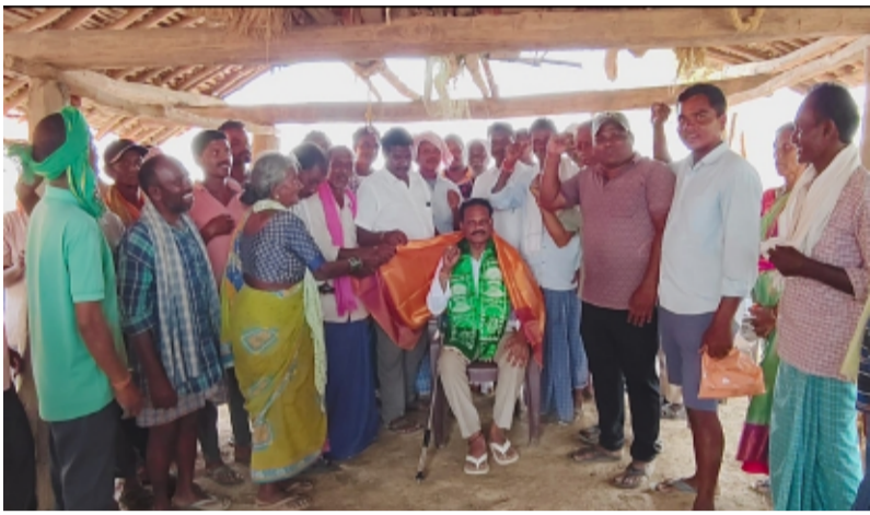
-స్వగ్రామం గోపాలపురంలో మిస్సంటీన సంబరాలు -సాధారణ కార్యక్రమం నుండి జాతీయ స్థాయికి ఎదగడం గర్వకారణం: గ్రామస్తులు