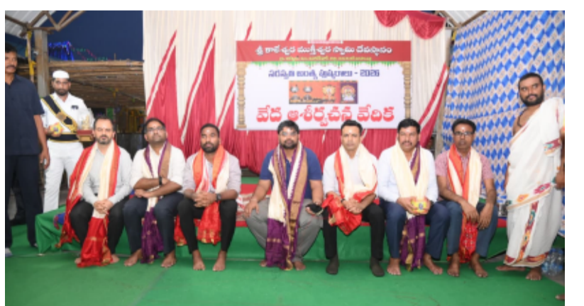
-దేవదాయ శాఖ కమిషనర్ హనుమంతరావు