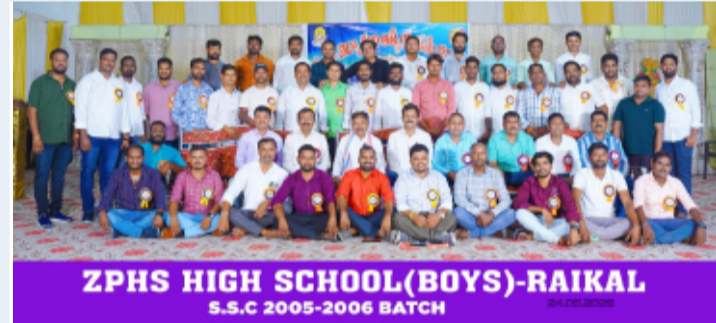
రాయికల్ మండల మే 24(తెలంగాణ పత్రిక):