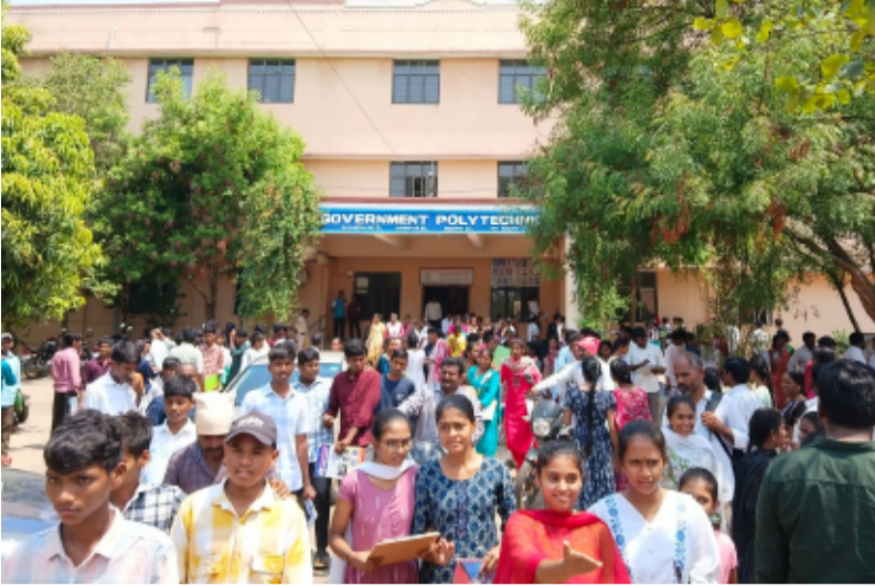
నంగూరు, మే 24(తెలంగాణ పత్రిక):

తెలంగాణ రాష్ట్రంలోని పాలిటెక్నిక్ లలో ఇంజనీరింగ్ డిప్లొమా కోర్సుల్లో ప్రవేశాలకు పెద్దయ్యల్ విడుదల అయింది. పాలిసెట్ ఫలితాలు శనివారం విడుదల అయ్యాయి. దీంతో ప్రవేశాల ప్రక్రియకు రంగం సిద్ధమైంది. పదోతరగతి పాస్ పాలిసెట్ 2026 ఎంపీసీ స్కీమ్ ఉత్తీర్ణులైన విద్యార్థులు ఈ కోర్సుల్లో చేరడానికి విద్యార్థులు చేయాల్సిన ప్రక్రియను ఈ పెద్దయ్యల్ లో ప్రకటించారు.