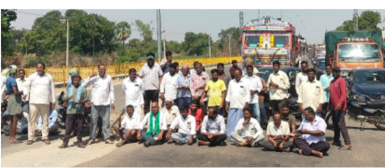
-ఇబ్రందులు పడ్డ ప్రయాణికులు