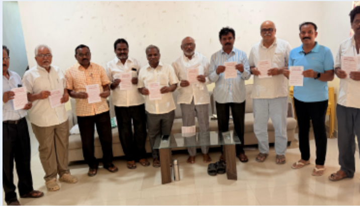
కామారెడ్డి, మే 24, (తెలంగాణ పత్రిక జిల్లా ప్రతినిధి)