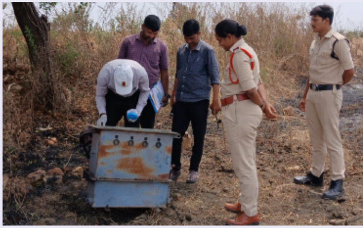
ముధోల్: 22వ(తెలంగాణ పత్రిక)

మండలంలోని విట్టోలి తండా, కారేగాం పెట్రోల్ బంక్ వద్ద గల వ్యవసాయ పంట పొలంలో విద్యుత్ ట్రాన్స్ఫార్మర్ లో ఉన్న కాపర్ తీగలను గుర్తుతెలియని దొంగలు చోరీ చేశారు. బాధిత రైతు శుక్రవారం పంటపొలాలకు వెళ్ళగా విద్యుత్ ట్రాన్స్ఫార్మర్ కింది పడిపోయి కనిపించింది. దీంతో సమాచారాన్ని ముధోల్ ఎస్పి బిట్ల పెర్సన్ అందించగా విద్యుత్ ట్రాన్స్ఫార్మర్ లో గల కాపర్ తీగలను చోరీ గురైందని తెలుసుకున్నారు. క్లోజ్ టీమ్ బృందం తనిఖీలు చేసి వివరాలు సేకరించారు. బాధితుని ఫిర్యాదు మేరకు కేసు నమోదు చేసుకొని దర్యాప్తు చేస్తున్నట్లు పోలీసులు వివరించారు.