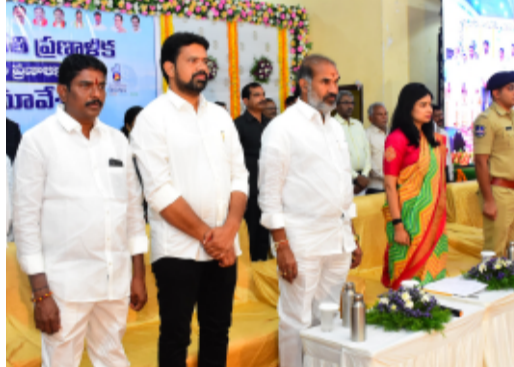
-అభివృద్ధి, సంక్షేమ పథకాలు ప్రజలకు తెలియజేయడం, భవిష్యత్ ప్రణాళికలు సిద్ధం చేసేందుకు ప్రజా పాలన ప్రగతి ప్రణాళిక అమలు