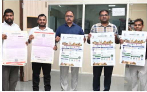
-జూన్ 15 లోపు అసక్తి గల పౌరులు సభ్యులుగా చేరాలి