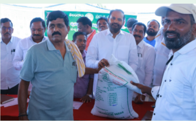
పెద్దపల్లి, ప్రతినిధి మే 20 ( తెలంగాణ పత్రిక )