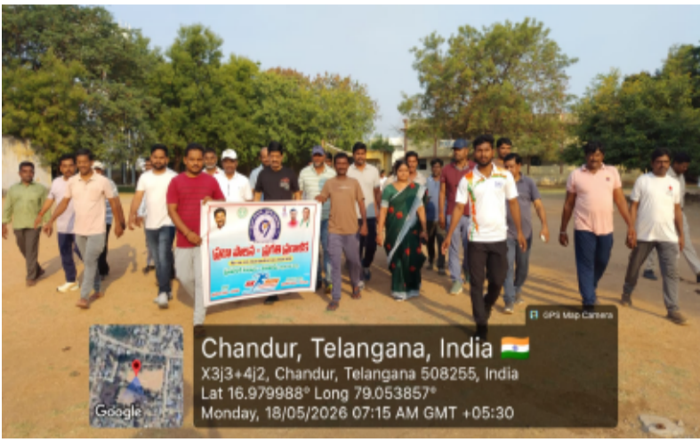
Chandur, Telangana, India X33°42, Chandur, Telangana 508255, India Lat 16.979988° Long 79.053857° Monday, 18/05/2026 07:15 AM GMT +05:30