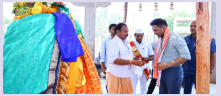
తెలంగాణ పత్రిక ములుగు జిల్లా ప్రతినిధి మే 18: