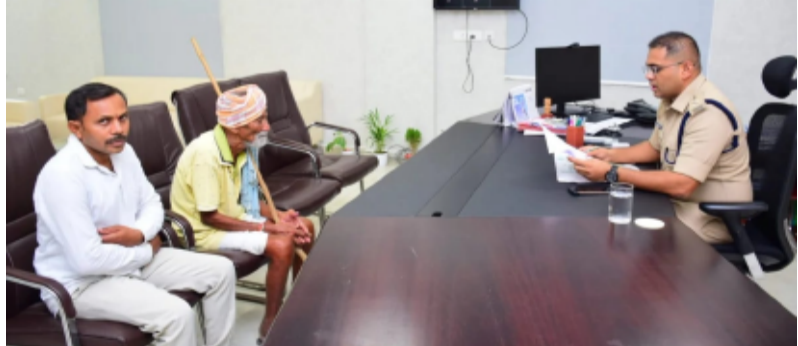
-జిల్లా ఎస్పీ మహేష్ బి.గి.శే.

సిరిసిల్ల జిల్లా ప్రతినిధి, మే 18, తెలంగాణ పత్రిక