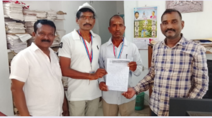
సిరిసిల్ల జిల్లా ప్రతినిధి, మే 18, తెలంగాణ పత్రిక

-అటవీశాఖ అధికారికి ఆర్డీఎస్ హ్యూమన్ రైట్స్ విసతిపత్రం