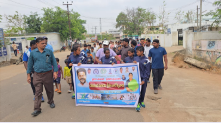
తెలంగాణ పత్రిక ములుగు జిల్లా ప్రతినిధి మే 18

ములుగు జిల్లాలో ఘనంగా ప్రారంభమైన యువజన, క్రీడల వారోత్సవాలు