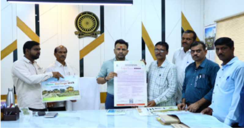
-హెరిటేజ్ వాక్, పర్యాటక క్లబ్ పోస్టర్స్ ను ఆవిష్కరించిన