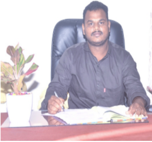
జిల్లా ఉపాధి అధికారి ఒక ప్రకటనలో పేర్కొన్నారు.

నుండి రూ.22 వేల వరకు వేతనం అందజేయనున్నట్లు, ఎంపికైన అభ్యర్థులు పెద్దపల్లి, రామగుండం, జమ్మికుంట, మంధని, కాళేశ్వరం, కాటారం, హుజూరాబాద్, హుస్సాబాద్ ప్రాంతాలలో విధులు నిర్వహించాల్సి ఉంటుందని తెలిపారు. ఆసక్తి ఉన్నవారు మే 22న ఉదయం 11 గంటలకు సర్టిఫికేట్స్ జిరాక్స్ కాపీలు, ఆప్ డేటెడ్ బయోడేటా / రిజ్యూమే, ఆధార్ కార్డు జిరాక్స్ కాపీతో పాటు అనుభవం ఉంటే ఎక్స్ పీరియన్స్ లెటర్ తీసుకొని రూమ్ నెంబర్ 233, మొదటి అంతస్తు, జిల్లా ఉపాధి కల్పన కార్యాలయం, సమీకృత జిల్లా కలెక్టర్ కార్యాలయం పెద్దపల్లిలో హాజరై తమ పేరు నమోదు చేసుకోవాలని, మరిన్ని వివరాలకు 8985336947, 8121262441 ఫోన్ నెంబర్లలో సంప్రదించాలని