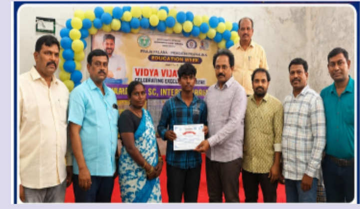
పాపన్నపేట, ప్రతినిధి మే 17:(తెలంగాణ పత్రిక)