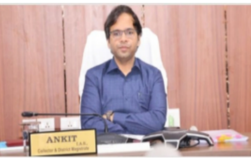
ప్రజలు ఈ అవకాశాన్ని వినియోగించుకోవాలని జిల్లా కలెక్టర్ కోరారు.

10.30 గంటలకు ప్రజావాణి కార్యక్రమం ప్రారంభమవుతుందని కలెక్టర్ పేర్కొన్నారు. సంబంధిత శాఖాధికారులు ప్రజల నుండి అందిన ఫిర్యాదులను వెంటనే స్వీకరించి, తగిన చర్యలు తీసుకునేలా చర్యలు చేపట్టాలని ఆదేశించారు. అదేవిధంగా జిల్లా ప్రజల సౌకర్యార్థం సబ్ కలెక్టర్ భద్రాచలం కార్యాలయంలో, ఆర్డీవో కార్యాలయం కొత్తగూడెంలో ప్రజావాణి నిర్వహించబడుతుందని,