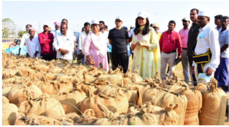
-జిల్లా అధికార యంత్రాంగం క్షేత్ర స్థాయి పర్యటనలు, పర్యవేక్షణ ఇప్పటి దాకా 16,511 మంది రైతుల నుంచి 1,33,125 మెట్రిక్ టన్నుల సేకరణ -దాదాపు 44 శాతం సేకరణ లక్ష్యం పూర్తి

నిరిసిల్ల జిల్లా ప్రతినిధి, మే 17, తెలంగాణ పత్రిక జిల్లాలో ధాన్యం కొనుగోళ్ల ప్రక్రియ వేగవంతంగా కొనసాగుతుంది. ఇప్పటి దాకా 1,33,125 లక్షల మెట్రిక్ టన్నుల సేకరించగా, 44 శాతం పూర్తి అయింది. ప్రతి మండలానికి ఒక ప్రత్యేక అధికారి, కొనుగోలు కేంద్రాలకు, మిల్లులకు, గోడౌన్లకు ప్రత్యేక అధికారులను నియమించి.. కొనుగోళ్లు, తరలింపు, అన్ లోడింగ్ సాఫీగా ముందుకు సాగేలా పక్కా ప్రణాళిక ప్రకారం అధికార యంత్రాంగం ముందుకు సాగుతున్నది. రాజన్న నిరిసిల్ల జిల్లా వ్యాప్తంగా ఐకేపీ, ప్యాక్స్, మెప్పా, డీసీఎంఎస్ ఆధ్వర్యంలో 236 కొనుగోలు కేంద్రాల్లో రైతుల నుంచి సేకరించిన ధాన్యాన్ని ఎప్పటికప్పుడు మిల్లులకు తరలించడానికి, రైతులకు క్షేత్ర స్థాయిలో ఇబ్బందులు తలెత్తకుండా చేయాల్సిన ఏర్పాట్లపై జిల్లా యంత్రాంగం ప్రత్యేక