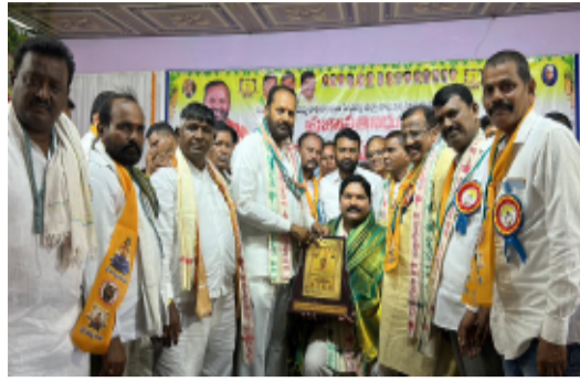
-ప్రభుత్వ విప్, పెద్దపల్లి ఎమ్మెల్యే చింతకుంట విజయరమణ రావు