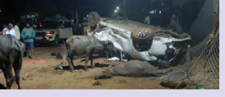
గూడూరు మండల ప్రతినిధి: - మే 17. (తెలంగాణ పత్రిక)