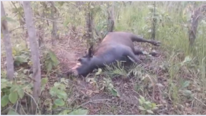
కొత్తగూడ మండల ప్రతినిధి మే 17. (తెలంగాణ పత్రిక)