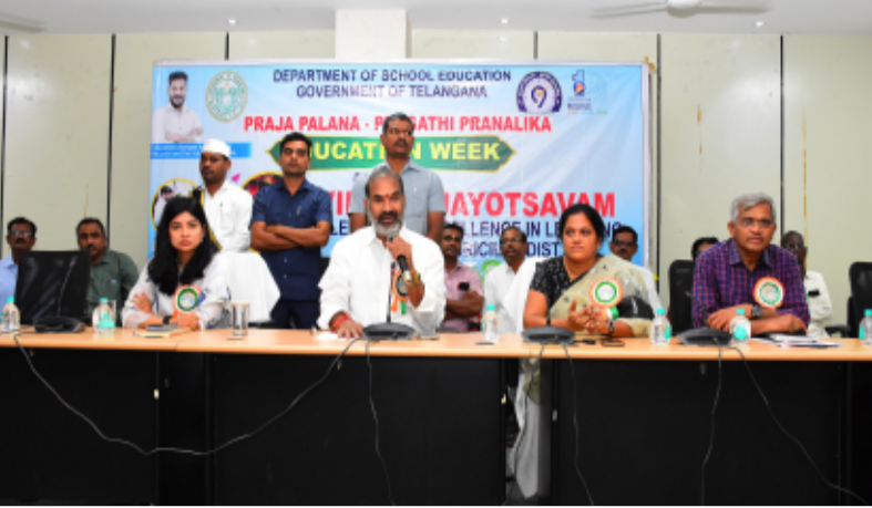
-ప్రభుత్వ స్కూళ్లలో మెరుగైన వసతులు -ప్రభుత్వ విప్, వేములవాడ ఎమ్మెల్యే ఆది శ్రీనివాస్, జిల్లా కలెక్టర్ గరిమ అగ్రవాల్ -ప్రజాపాలన-ప్రగతి ప్రణాళిక 99 రోజుల కార్యచరణలో భాగంగా విద్యా వారోత్సవాల ముగింపు కార్యక్రమం