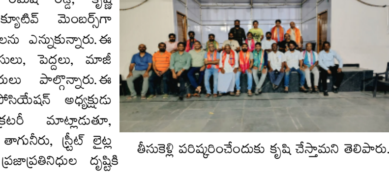
తీసుకెళ్లి పరిష్కరించేందుకు కృషి చేస్తామని తెలిపారు.