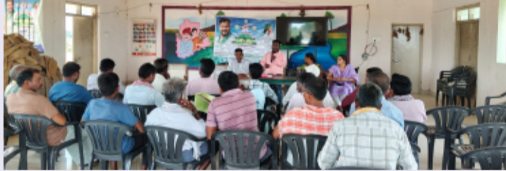
వీణవంక ప్రతినిధి, మే 16( తెలంగాణ పత్రిక).