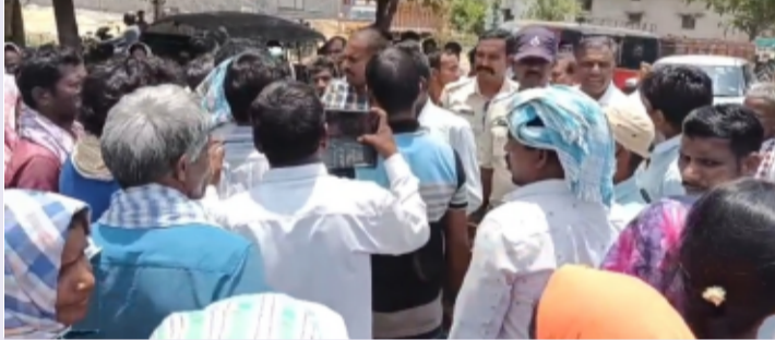
మెడకే జిల్లా చిన్న శంకరంపేట (తెలంగాణ పత్రిక) మే 16