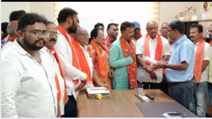
జగిత్యాల పట్టణం (తెలంగాణ పత్రిక) మే 16

జగిత్యాల మండలం నర్సింపూర్ గ్రామంలోని ప్రభుత్వ భూములను కట్టాల నుంచి రక్షించి కేంద్రీయ విశ్వవిద్యాలయం ఏర్పాటు చేయాలని బీజేపీ సీనియర్ నాయకులు అదనపు కలెక్టర్ కు వినతిపత్రం సమర్పించారు. సర్వే నంబర్లు 437, 251లో అక్రమంగా ఇటుక బట్టీలు నిర్మిస్తున్నారని ఆరోపించారు. ప్రభుత్వ భూమిని తిరిగి స్వాధీనం చేసుకుని పేద విద్యార్థుల కోసం విశ్వవిద్యాలయం నిర్మించాలని కోరారు. ఎంపీ ధర్మపురి ఆరవింద్, ఎమ్మెల్యే సంజయ్ కుమార్ సహకారంతో పనులు వూర్తి చేయాలని విజ్ఞప్తి చేశారు.