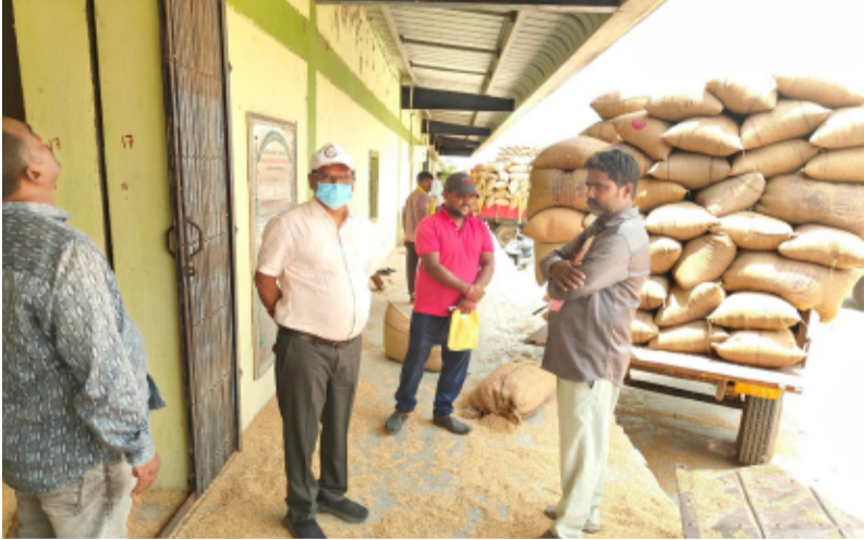
-ముస్తాబాద్, ఎల్లారెడ్డిపేట మండలాల్లోని పలు గ్రామాల్లో ధాన్యం కొనుగోలు కేంద్రాలు, రైస్ మిల్లుల తనిఖీ

నిరిసిల్ల జిల్లా ప్రతినిధి, మే 16, తెలంగాణ పత్రిక