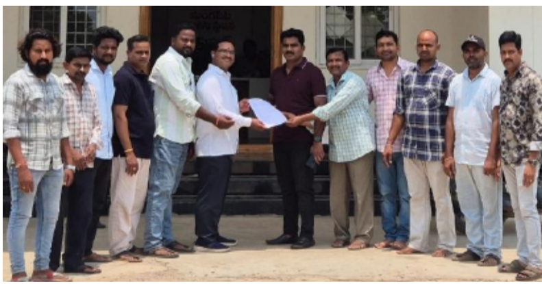
-తాసిల్దార్, ఎస్సెలకు వినతి పత్రం సమర్పణ