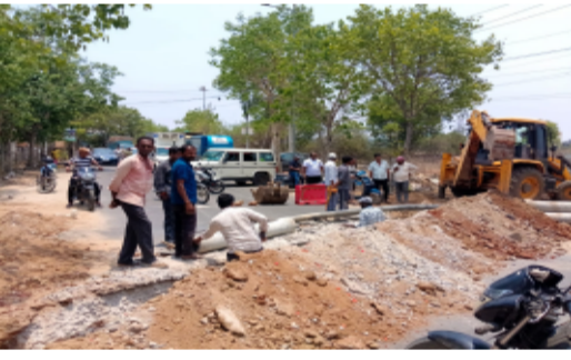
-మేడ్చల్ మండలంలో రైతులపై రైస్ మిల్లర్ జులాం