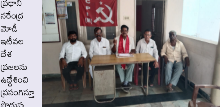
మిర్యాలగూడ ప్రతినిధి/మే 16:(తెలంగాణ పత్రిక):-