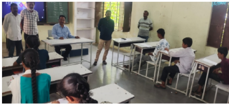
ఓదెల/తెలంగాణ పత్రిక (మే 16)