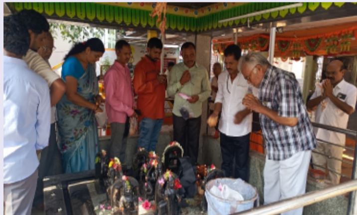
జగిత్యాల పట్టణం (తెలంగాణ పత్రిక) మే 16

జగిత్యాల పట్టణంలోని భక్త మార్కండేయ దేవాలయంలో శనీశ్వరుడి జయంతి సందర్భంగా శనివారం భక్తిశ్రద్ధలతో ప్రత్యేక పూజలు నిర్వహించారు. తెల్లవారుజాము నుంచే భక్తులు త్రైలాభిషేకాలు, అర్చనలు, హారతి పూజ లతో పాల్గొన్నారు. నల్ల వస్త్రాలు, నువ్వులు, కొబ్బరికాయలతో స్వామివారిని ప్రార్థించారు. అంజనేయస్వామికి కూడా ప్రత్యేక పూజలు చేశారు. శని దేవుడి అనుగ్రహంతో అడ్డంకులు తొలగి కోరికలు నెరవేరుతాయని అర్చకులు తెలిపారు.