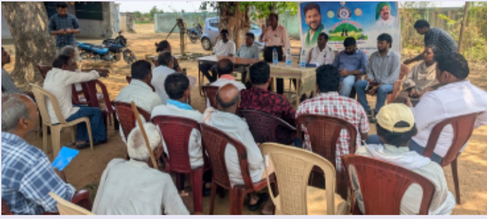
తెలంగాణ పత్రిక, పినపాక నియోజకవర్గం ప్రతినిధి,మే 16.

ఉష్ణాక గ్రామంలో రైతు అవగాహన సమావేశం నిర్వహణ - రైతులు ఖరీఫ్ సాగు కోసం ఎఫ్డీ - 44 విత్తనాలు వాడాలి.