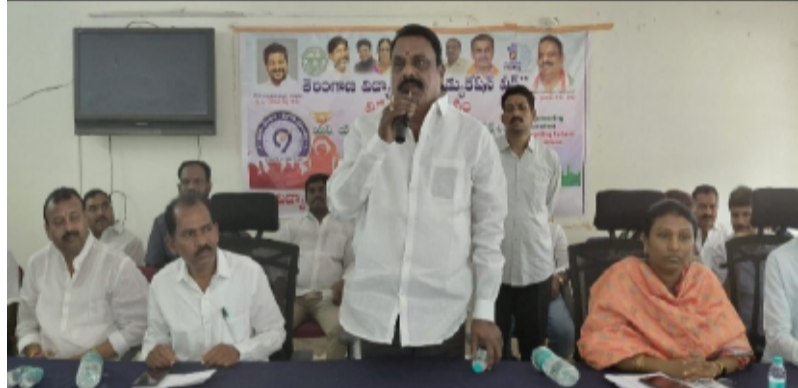
-MDO కార్యాలయంలో పదవ తరగతి టాపర్లను సన్మానించిన ఎమ్మెల్యే ప్రకాష్ గౌడ్

రాజేంద్రనగర్ ప్రతినిధి మే 16 తెలంగాణ పత్రిక.