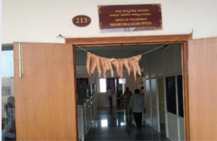
కామారెడ్డి, మే 16, (తెలంగాణ పత్రిక జిల్లా ప్రతినిధి)