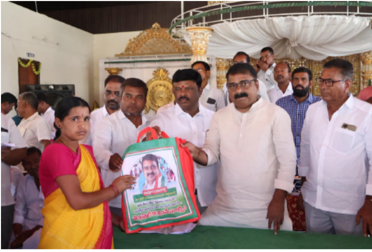
-వెల్తుర్తి మండలం లో గర్భిణీలకు న్యూట్రీషన్ కిట్ల పంపిణీ

-రాజకీయాలకు అతీతంగా సామాజిక సేవ -నర్సాపూర్ నియోజకవర్గ ఇన్చార్జి ఆఫ్ రాజరెడ్డి వెల్తుర్తిమండల ప్రతినిధి, మే 07 (తెలంగాణ పత్రిక):