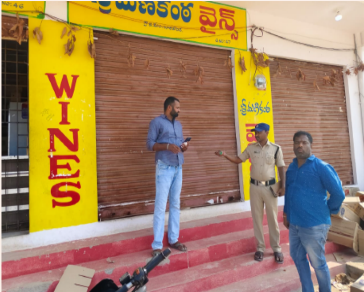
తెలంగాణ షటిక వారకొండ, మే 07:

నాగర్ కర్నూలు జిల్లా వారకొండ మండల కేంద్రంలో మద్యం విక్రయాల తీరు వివాదాస్పదంగా మారింది. వైన్స్ యజమానులు సిండికేట్ గా మారి సామాన్య వినయోగదారులకు ఇబ్బంది కల్పిస్తున్నారంటూ ఆందోళన వ్యక్తం చేశారు. నిబంధనలకు విరుద్ధంగా ఒక వైన్స్ కు కేవలం బెల్ట్ షాపులకే పరిమితం చేయడంతో స్థానికులు ఆగ్రహం వ్యక్తం చేస్తూ గురువారం వైన్స్ కు లాభం వేశారు.