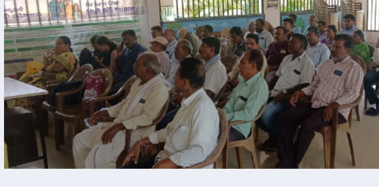
దుబ్బాక, మే07(తెలంగాణ పత్రిక)