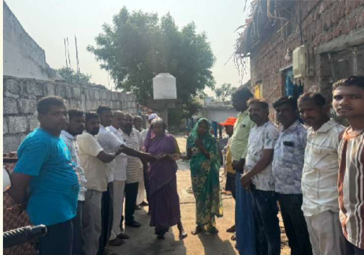
కోటగిరి తెలంగాణ పత్రిక మే 7.