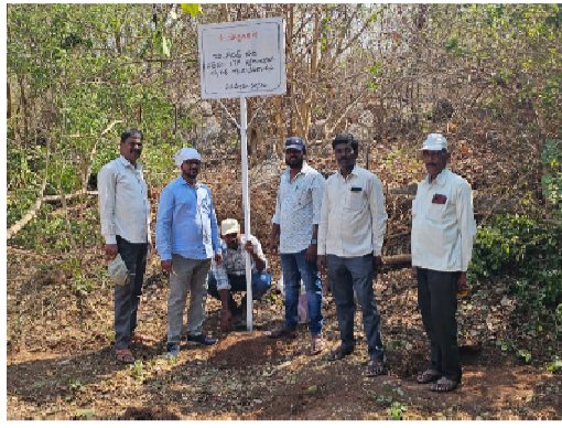
-ప్రభుత్వ భూములపై అక్రమ కబ్బాలు, రిజిస్ట్రేషన్లపై కఠిన చర్యలు