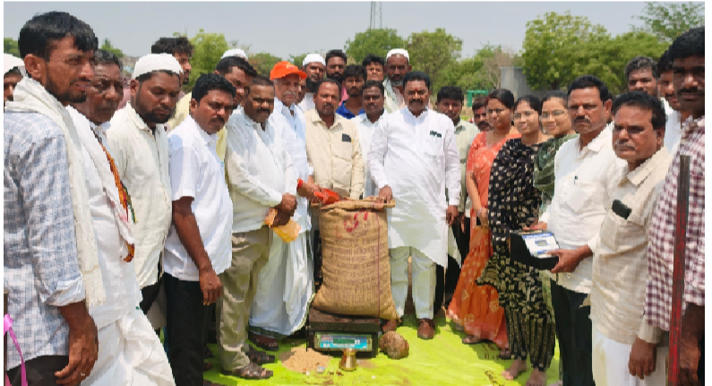
ముధోల్: మే 7 (తెలంగాణ పత్రిక)

మండలంలోని తరోడ గ్రామంలో ఐకేపీ ఆధ్వర్యంలో ఏర్పాటు చేస్తుండన్నారు. రైతులు ప్రైవేటు వ్యాపారుల