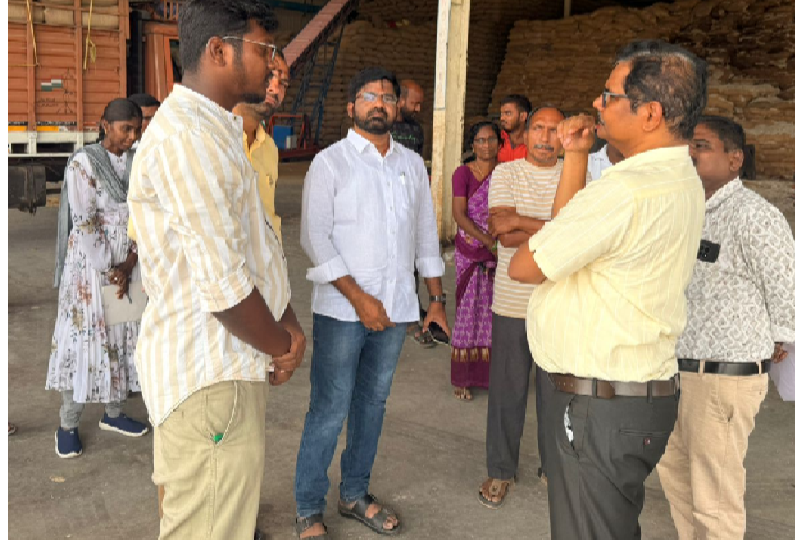
ఇల్లంతకుంట, ఏప్రిల్ 7 తెలంగాణ పత్రిక