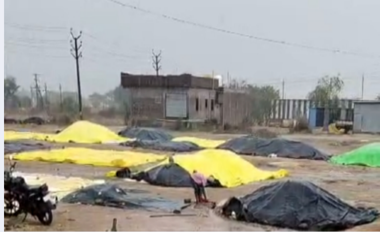
ముధోల్: 07మే(తెలంగాణ పత్రిక)

మండల కేంద్రమైన ముధోల్ తో పాటు మండలంలోని ఆయా గ్రామాల్లో గురువారం ఈదురు గాలులతో కురిసిన అకాల వర్షానికి మొక్కజొన్న,వరి ధాన్యం కల్లాల వద్ద తడిసిపోవడంతో రైతులకు కన్నీటిని మిగిల్చింది. మండల కేంద్రంలో ఇప్పటివరకు వరి కొనుగోలు కేంద్రం ప్రారంభించకపోవడం ఏమిటని రైతులు మండిపడుతున్నారు. అధికారుల నిర్లక్ష్యం వల్లే కొనుగోలు కేంద్రం ప్రారంభించలేదన్నారు. కల్లాల వద్ద ఆరబోసిన పంట తడిసి ముద్ద కావడంతో రైతులు లబోదిబో మంటున్నారు. తడిసిన వరి, మొక్కజొన్న లకు ఎలాంటి అంక్షలు లేకుండా కొనుగోలు చేయాలని రైతులు కోరుతున్నారు. ప్రభుత్వమే తమను ఆదుకోవాలని రైతులు వేడుకుంటున్నారు.