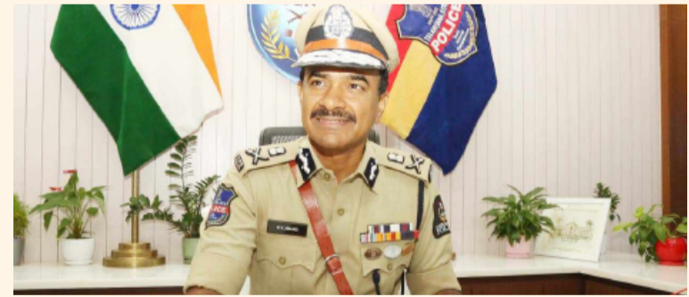
తెలంగాణ పత్రిక ప్రతినిధి

రాష్ట్రంలో డ్రగ్స్ కట్టడి చేయడమే తమ తొలి ప్రాధాన్యమని తెలంగాణ డిజిపి సివి ఆనంద్ స్పష్టం చేశారు. రిపీటెడ్ గా డ్రగ్స్ కేసులో పట్టుబడితే పీడీ యాక్ట్ తరహా చట్టాన్ని ఉపయోగిస్తామన్నారు. రాష్ట్ర డిజిపీగా బాధ్యతలు - మిగతా2లో