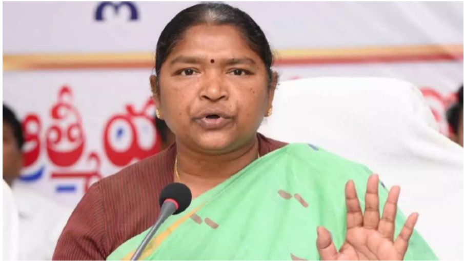
తెలంగాణ పత్రిక ప్రతినిధి

మహిళా స్వయం సహాయక బృందాలకు గుడ్ న్యూస్ చెప్పిన సీతక్క