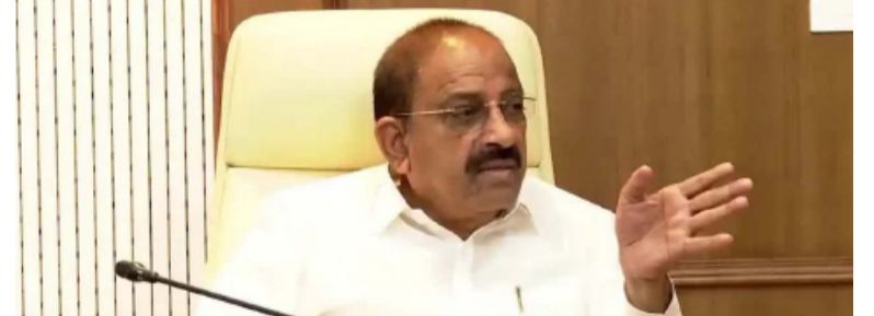
తెలంగాణ పత్రిక ప్రతినిధి

బీఆర్ఎస్ పదేళ్లలో చేయలేని పనులను సీఎం రేవంత్ రెడ్డి రెండేళ్లలోనే చేశారని తెలంగాణ వ్యవసాయ శాఖ మంత్రి తుమ్మల నాగేశ్వరరావు అన్నారు. మొదటి ఏడాదిలోనే రాష్ట్రవ్యాప్తంగా 25 లక్షల మంది రైతులకు రూ.2 లక్ష - మిగతా2లో