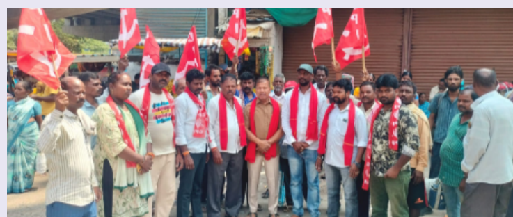
రాజేంద్రనగర్ ప్రతినిధి మే 06 తెలంగాణ పత్రిక.

-సిపిఐ రాష్ట్ర సమితి సభ్యుడు పానుగంటి పర్వతాల