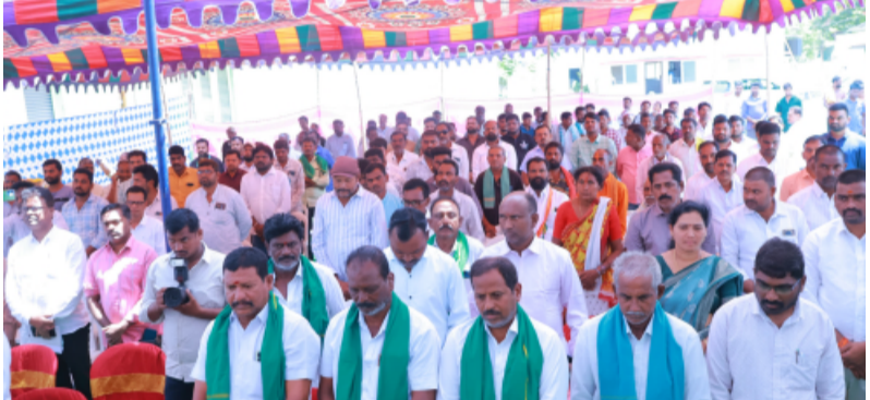
-రైతులు ప్రత్యామ్నాయ పంటలపై దుష్టి సారించాలి..

-కాంగ్రెస్ ప్రభుత్వం రైతు ప్రభుత్వం.. -రైతును మరింత బలోపేతం చేసేందుకు రైతు వారోత్సవాలు..