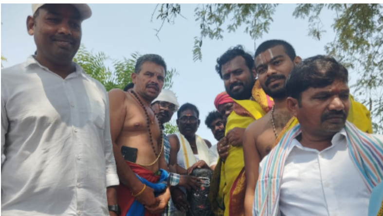
-వాడవాడనా పండుగ వాతావరణం లో గ్రామస్తులు...

వీణవంక ప్రతినధి, మే 6 ( తెలంగాణ పత్రిక).