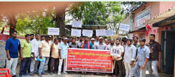
మండపర్తి,మే 06 ( తెలంగాణ పత్రిక).

మండపర్తి డివిజన్ పరిధిలో పనిచేస్తున్న సింగరేణి ఎన్డబిసి ప్రైవేట్ సెక్యూరిటీ గార్డులు తీవ్ర ఆర్థిక సంక్షోభంలో కూరుకుపోయారు. ఫిబ్రవరి నెలలో టెండర్ గడువు ముగిసినప్పటికీ ఇప్పటివరకు కొత్త టెండర్ పిలవకపోవడంతో మూడు నెలలుగా 213 మంది గార్డులకు డ్యూటీలు లేక వేతనాలు అందక కుటుంబాలు ఇబ్బందులు పడుతున్నారు. కొత్త టెండర్ పిలిచి తిరిగి విధులు కల్పించాలని గార్డులు డిమాండ్ చేస్తూ గతంలో ఆందోళన చేపట్టారు. ఈ సందర్భంగా ఏరియా జనరల్ మేనేజర్ హామీ ఇవ్వడంతో, అలాగే నియోజకవర్గ ఎమ్మెల్యే కార్మిక శాఖ మంత్రిపై నమ్మకంతో కార్మికులు తమ పోరాటాన్ని తాత్కాలికంగా వాయిదా వేశారు. అయితే 15 రోజులు గడిచినప్పటికీ ఎలాంటి పురోగతి లేకపోవడంతో గార్డుల్లో అసంతృప్తి వ్యక్తమవుతోంది. ఈ నేపథ్యంలో సింగరేణి కాంట్రాక్టు కార్మిక సంఘం (సిఐటియూ) ఆధ్వర్యంలో నిర్వహించిన జనరల్ బాడీ సమావేశంలో గార్డులు తిరిగి పోరాటానికి సిద్ధమవ్వాలని నిర్ణయించారు. అధికారుల హామీలు అమలు కాకపోవడంతో అవి "నీటి మూటలుగా మారాయని వారు విమర్శించారు. ప్రైవేట్ సెక్యూరిటీ గార్డులతో పాటు వారి కుటుంబ సభ్యులు కూడా ఈసారి ఆందోళనలో పాల్గొనాలని నిర్ణయించుకోవడం విశేషం. సమస్య పరిష్కారం కాకపోతే రాబోయే రోజుల్లో జరిగే పోరాటాలకు సింగరేణి అధికారులు, స్థానిక ఎమ్మెల్యే బాధ్యత వహించాల్సి ఉంటుందని వారు హెచ్చరించారు. ఈ కార్యక్రమంలో పెద్ద సంఖ్యలో ప్రైవేట్ సెక్యూరిటీ గార్డులు పాల్గొన్నారు.