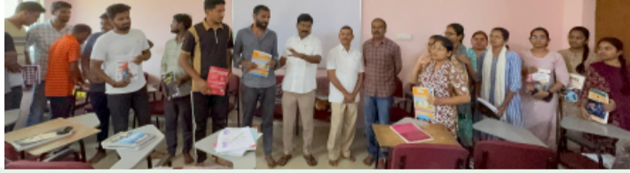
బెల్లంపల్లి, మే 6