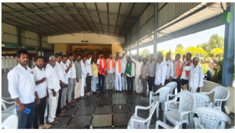
పాపన్నపేట, ప్రతినిధి మే 05:(తెలంగాణ పత్రిక)