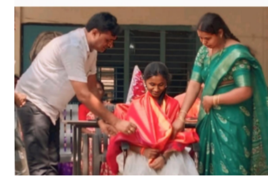
ఊరు మనబడినీ కాపాడుకుందాం మన పిల్లల భవిష్యత్తుని నిర్మించుకుందాం.