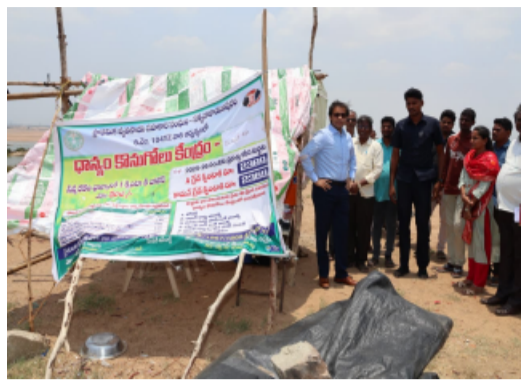
-రైతులకు ఇబ్బందులు లేకుండా ధాన్యం కొనుగోలు ప్రక్రియ వేగవంతం చేయాలి. -రోగులకు మెరుగైన వైద్య సేవలు అందించాలి. -చర్ల పర్యటనలో జిల్లా కలెక్టర్ అంకితం.

భద్రాద్రి కొత్తగూడెం తెలంగాణ పత్రిక మే,5 చర్ల మండలంలో జిల్లా కలెక్టర్ అంకితం మంగళవారం విస్తృత పర్యటన నిర్వహించారు. ఈ పర్యటనలో భాగంగా ధాన్యం కొనుగోలు కేంద్రం, ఇందిరమ్మ ఇండ్ల నిర్మాణాలు, సామాజిక ఆరోగ్య కేంద్రాన్ని ఆకస్మికంగా పరిశీలించి వివిధ అంశాలపై సమీక్ష నిర్వహించారు. సత్యనారాయణపురం గ్రామంలోని పెద్దపల్లి-ముమ్మిడివరం ధాన్యం కొనుగోలు కేంద్రాన్ని సందర్శించిన కలెక్టర్, ఇప్పటివరకు వచ్చిన ధాన్యం పరిమాణం, కొనుగోలు ప్రక్రియ పురోగతిని అధికారులను అడిగి తెలుసుకున్నారు. కేంద్రంలో రైతులకు కల్పిస్తున్న సౌకర్యాలను పరిశీలిస్తూ టార్పాలిన్లు, హమాల్లీలు, తాగునీరు వంటి మౌలిక వసతులు అందుబాటులో ఉన్నాయా అనే అంశాన్ని తనిఖీ చేశారు. కేంద్రానికి వచ్చిన రైతులతో నేరుగా మాట్లాడి వారి సమస్యలను తెలుసుకున్నారు. ధాన్యం కొనుగోలు ప్రక్రియలో ఎలాంటి ఇబ్బందులు తలెత్తకుండా వేగంగా చర్యలు తీసుకోవాలని, సమస్యలు ఉంటే వెంటనే ఉన్నతాధికారుల దృష్టికి తీసుకురావాలని అధికారులను ఆదేశించారు. ధాన్యం లోడింగ్ ప్రక్రియ వేగవంతం చేయడానికి తగినన్ని లారీలను ఏర్పాటు చేయాలని సూచించారు. అకాల వర్షాల కారణంగా ధాన్యం నష్టపోకుండా రక్షణ చర్యలు చేపట్టాలని స్పష్టం చేశారు. ట్యాబ్ ఎంట్రీలను ఆలస్యం లేకుండా నమోదు చేయాలని ఆదేశించారు. అనంతరం సత్యనారాయణపురం గ్రామంలో జరుగుతున్న ఇందిరమ్మ ఇండ్ల నిర్మాణాలను