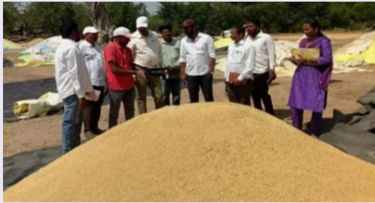
కామారెడ్డి, మే 5 ,(తెలంగాణ పత్రిక జిల్లా ప్రతినిధి)