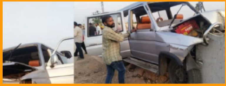
తెలంగాణ పత్రిక మే 5

రెబల్ స్టార్ ప్రభాస్ హీరోగా హను రాఘవపూడి దర్శకత్వంలో తెరకెక్కుతున్న పీరియాడిక్ వార్ డ్రామా 'ఫాజ్' సెట్లో విషాదం నెలకొంది. ఈ ఉదయం షూటింగ్ నిమిత్తం వెళ్తున్న యూనిట్ సభ్యుల కారు హైదరాబాద్ శివార్లలోని అబ్దుల్లాపూర్ మేట్ వద్ద ప్రమాదానికి గురైంది. కారు అదుపు తప్పి డివైడర్ను బలంగా ఢీకొట్టడంతో ఈ దుర్ఘటన చోటుచేసుకుంది. ఈ ప్రమాదంలో ఒకరు అక్కడికక్కడే మరణించగా, మరో ఐదుగురికి తీవ్ర గాయాలయ్యాయి. క్షతగాత్రులను వెంటనే చికిత్స కోసం నవీప ఆసుపత్రికి తరలించారు. సినిమా షూటింగ్ వసుల్లో బిజీగా ఉన్న సమయంలో తమ సహచరుడు మరణించాడనే సమాచారంతో చిత్ర యూనిట్ తీవ్ర దిగ్భ్రాంతికి లోనైంది. మరోవైపు, సమాచారం అందుకున్న పోలీసులు కేసు నమోదు చేసి దర్యాప్తు చేస్తున్నారు. భారీ అంచనాలతో రూపొందుతున్న ఈ సినిమా యూనిట్లో ఈ ఘటన విషాద ఛాయలను నింపింది. మృతుడి కుటుంబానికి చిత్ర బృందం తమ ప్రగాఢ సానుభూతిని తెలియజేసింది.