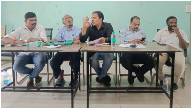
-ఉపాధి హామీ పనుల్లో పాల్గొనే వారి శాతం పెంచాలి.

తెలంగాణ పత్రిక, పినపాక నియోజకవర్గం ప్రతినిధి, మే 5. పినపాక మండలంలో ఉపాధి హామీ పనుల్లో పాల్గొనే కార్మికుల సంఖ్యను గణనీయంగా పెంచాలని ఎంపీడీవో సంకీర్త సూచించారు.