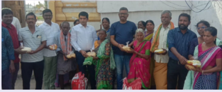
వీణవంక ప్రతినిధి, మే 31( తెలంగాణ పత్రిక).

-హరిహర క్షేత్రం పోషణ సమితి (ట్రస్ట్) సర్పంచిగారు..