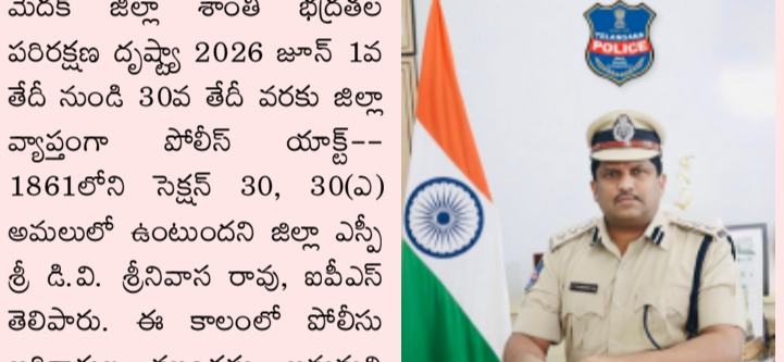
మెదక్ జిల్లా శాంతి భద్రతల పరిరక్షణ దృష్ట్యా 2026 జూన్ 1వ తేదీ నుండి 30వ తేదీ వరకు జిల్లా వ్యాప్తంగా పోలీస్ యాక్ట్-- 1861లోని సెక్షన్ 30, 30(ఎ) అమలులో ఉంటుందని జిల్లా ఎస్పీ శ్రీ డి.వి. శ్రీనివాస రావు, ఐపీఎస్ తెలిపారు. ఈ కాలంలో పోలీసు అధికారుల ముందస్తు అనుమతి లేకుండా ఎటువంటి ధర్నాలు, రాస్తాకోలు, నిరసన కార్యక్రమాలు, ర్యాలీలు, పబ్లిక్ మీటింగ్స్, సభలు, సమావేశాలు నిర్వహించడం నిషేధమని పేర్కొన్నారు. ప్రజల లేదా ప్రభుత్వ ఆస్తులకు నష్టం కలిగించే చట్టవ్యతిరేక చర్యలు, శాంతిభద్రతలకు విఘాతం కలిగించే ప్రయత్నాలు ఎట్టి పరిస్థితుల్లోనూ సహించబోమని స్పష్టం చేశారు. శాంతిభద్రతల నిర్వహణకు భంగం కలిగించే వ్యక్తులపై చట్టపరంగా కఠిన చర్యలు తీసుకుంటామని హెచ్చరించారు. జిల్లా ప్రజలు, ప్రజాప్రతినిధులు, వివిధ సంఘాల నాయకులు పోలీసు శాఖ చేపడుతున్న శాంతిభద్రతల చర్యలకు సహకరించాలని జిల్లా ఎస్పీ విజ్ఞప్తి చేశారు.

వెల్తురుమండల ప్రతినేత్రాంగం, మే 31 (తెలంగాణ పత్రిక):