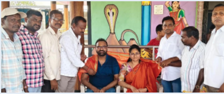
ఇల్లంతకుంట, ఏప్రిల్ 31 తెలంగాణ పత్రిక

కేకే విరాట్ ఆసుపత్రి వైద్య దంపతులకు సన్మానం