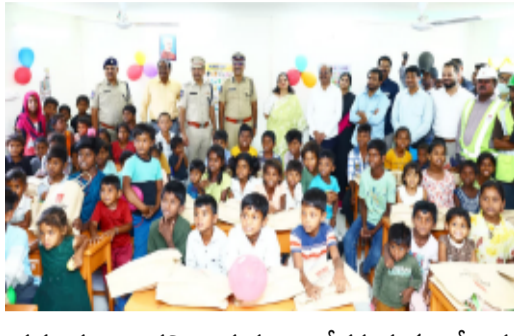
ప్రమాదం ఉందని ఆయన ఆందోళన వ్యక్తం చేశారు.

రంగారెడ్డి జిల్లా, శేరిలింగంపల్లి మే 04, (తెలంగాణ పత్రిక)