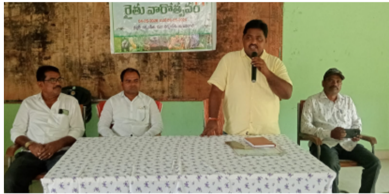
నర్సంపేట మే 04 తెలంగాణ పత్రిక

ప్రజాపాలన ప్రగతిప్రణాళికలో భాగం గా రైతు వారోత్సవాలు నర్సంపేట మండలం లోని నర్సంపేట, లక్ష్మవల్లి గురిజాల రాజుపేట మధ్యపేట రైతు వేదికలలో నిర్వహించబడుతుంది. ఈ కార్యక్రమంలో భూమి ఆరోగ్యం మట్టి నమునాలా ఎలా నిల్వ చేయాలి ఈ కార్యక్రమం లో