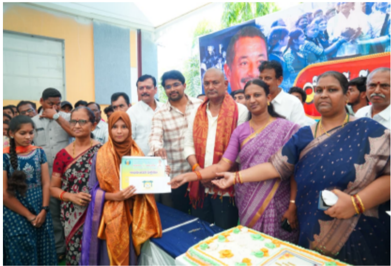
-పదవ తరగతి అత్యుత్తమ ప్రతిభ కనబరిచిన విద్యార్థులకు సత్కరించి, ప్రశంసా పత్రాన్ని అందజేసిన ఎమ్మెల్యే బిఎల్ఆర్

మిర్యాలగూడ ప్రతినిధి/మే 4:(తెలంగాణ పత్రిక):- సల్లోండ జిల్లా మిర్యాలగూడ నియోజకవర్గ విద్యార్థుల భవిష్యత్తుకు భరోసా కల్పిస్తూ వారి ఉన్నత చదువులకు అండగా నిలుస్తామని మిర్యాలగూడ ఎమ్మెల్యే బత్తుల లక్ష్మారెడ్డి పునరుద్ఘాటించారు. ఈరోజు ఎమ్మెల్యే పుట్టినరోజును పురస్కరించుకుని నియోజకవర్గ వ్యాప్తంగా పదవ తరగతి ఫలితాల్లో అత్యుత్తమ ప్రతిభ కనబరిచిన ప్రభుత్వ పాఠశాల విద్యార్థులకు ఘనంగా సన్మానం చేశారు. స్థానిక ఎమ్మెల్యే క్యాంపు కార్యాలయంలో ఏర్పాటు చేసిన ఈ కార్యక్రమంలో నియోజకవర్గంలోని ప్రభుత్వ పాఠశాలలో చదివి అత్యధిక మార్కులు సాధించిన 66మంది