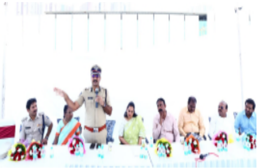
-చిన్నారుల భవిష్యత్తుకు భరోసానిచ్చడం మనందరి బాధ్యత: సీఎంసీ కమిషనర్ సృజన