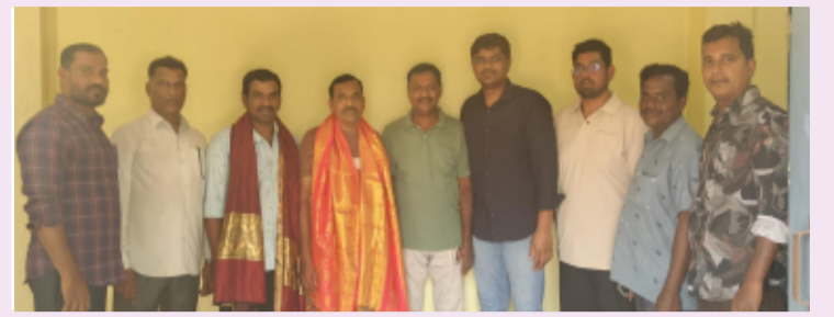
ఇల్లంతకుంట మే 4 తెలంగాణ పత్రిక