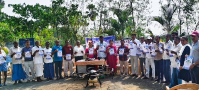
-పంటమార్పిడి పాటించండి - సుస్థిర ఆదాయం పొందండి