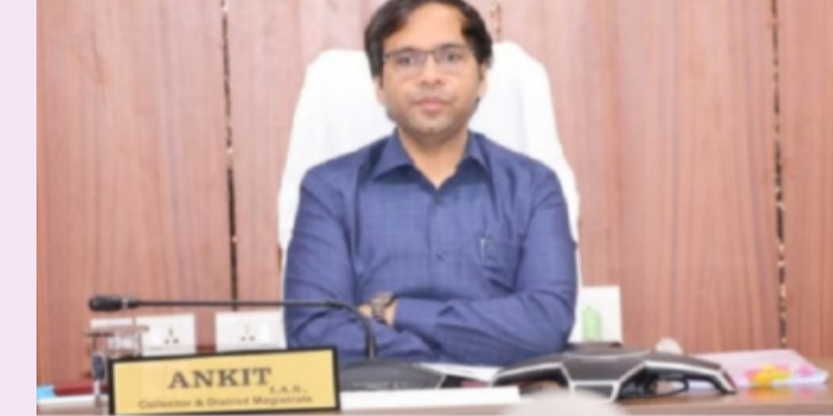
భద్రాద్రి కొత్తగూడెం తెలంగాణ పత్రిక మే 2

ఆదివారం నిర్వహించబడుతున్న నీట్ పరీక్ష సందర్భంగా అభ్యర్థులు తల్లిదండ్రులకు సహాయార్థం జిల్లా కాలే సెంటర్ నంబర్ 9392919743 ఏర్పాటు చేసినట్లు జిల్లా కలెక్టర్ తెలిపారు. మన జిల్లాలో మొత్తం 3 పరీక్షా కేంద్రాలు ఏర్పాటు చేయబడగా, అన్ని కేంద్రాల్లో అవసరమైన ఏర్పాట్లు పూర్తి చేసినట్లు తెలిపారు. ఈ కాలే సెంటర్ ఆది వారం ఉదయం 11:00 గంటల నుండి సాయంత్రం 5:00 గంటల వరకు అందుబాటులో ఉంటుంది. పరీక్షకు సంబంధించిన ఏవైనా సహాయం లేదా సమాచారం అవసరమైతే పై నంబర్ ను సంప్రదించవచ్చని తెలిపారు.