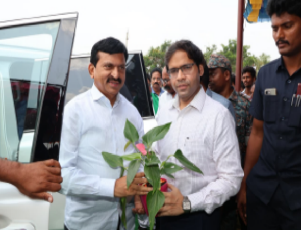
-మంత్రి పొంగలేటి శ్రీనివాస్ రెడ్డి.