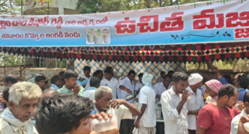
-దాహా నివారణ సేవ.....