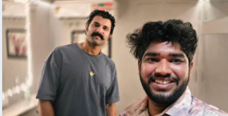
మే 02, తెలంగాణ పత్రిక

టాలీవుడ్ యువ కథానాయకుడు విజయ్ దేవరకొండ తన అభిమానుల పట్ల ఎంతో ప్రేమగా ఉంటారని మరోసారి రుజువైంది. అనపరీకి చెందిన ఓ అభిమాని ఇటీవల ఆయన్ను వ్యక్తిగతంగా కలిసి తన పెళ్లి పత్రాకాశాన్ని అందించాడు. త్వరలో జరగబోయే తన వివాహానికి తప్పకుండా హాజరు కావాలని ఆ అభిమాని మనస్ఫూర్తిగా కోరాడు. అభిమాని చూపిన ప్రేమకు విజయ్ దేవరకొండ సంతోషం వ్యక్తం చేశారు. ఆప్యాయంగా అతడిని పలకరించి, పెళ్లి పత్రాకాశం అందుకున్నారు. ఈ సందర్భంగా నూతన జీవితం లోకి అడుగుపెడుతున్న ఆ అభిమానికి, కాబోయే వధువుకు శుభాంక్షలు తెలిపారు. ఈ ఘటనతో విజయ్ దేవరకొండ తన మంచి మనసును చాటుకు న్నారని ఫ్యాన్స్ సోషల్ మీడియాలో కామెంట్స్ చేస్తున్నారు. తనను కలవడానికి వచ్చిన అభిమానిని నిరాశపరచకుండా, విజయ్ చూపిన ఆత్మీయత అందరినీ ఆకట్టుకుంటోంది.