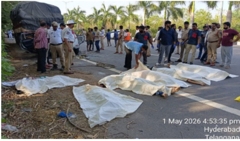
1 May 2026 4:53:35 pm Hyderabad Telangana

-రోజంతా ప్రయాణం, ఎండ వేడితో డ్రైవింగ్? చేస్తున్న వ్యక్తి -నిద్ర పోవడమే యాక్సిడెంట్ కు కారణం! -అందరూ సిరిసిల్ల వాసులు.. ఒకే కుటుంబానికి చెందినవారు