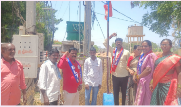
కామారెడ్డి ,మే0 1, (తెలంగాణ పత్రిక జిల్లా ప్రతినిధి)