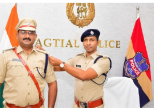
నిర్వహించవలసి ఉంటుందని ఎస్పీ అన్నారు.

అభినందించి పదోన్నతి శుభాకాంక్షలు తెలియజేశారు. పోలీస్ శాఖలో పనిచేస్తూ ఎన్నో ఏళ్లుగా ప్రజా సంరక్షణ కోసం అవిశ్రాంతంగా చేస్తున్న కృషికి పదోన్నతి ఒక గొప్ప గుర్తింపు అన్నారు. పదోన్నతి అనేది ప్రతి ఉద్యోగి జీవితంలో ఒక మైలురాయి వంటిదని ముఖ్యంగా పోలీస్ శాఖలో మరింత బాధ్యతాయుతంగా విధులు