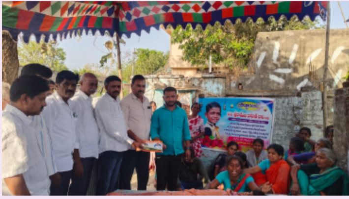
పరకాల/గిసుకొండ/ మే 01 తెలంగాణ పత్రిక