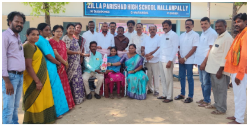
-శాలువాలతో ఘన సన్మానం, నగదు బహుమతులు అందజేత