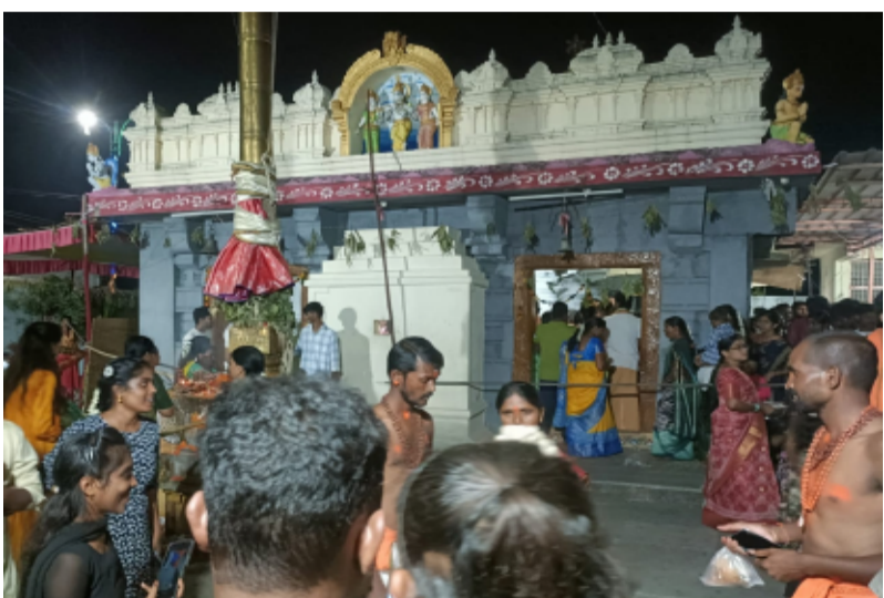
-వ్యాస పూర్ణిమ సందర్భంగా భక్తులతో కిక్కిరిసిన ఆలయం -ఘనంగా జాతర వేడుకలు

అత్యుత్సాహం, మే 01: (తెలంగాణ పత్రిక): వ్యాస పూర్ణిమను పురస్కరించుకుని అత్యుత్సాహం మండల కేంద్రంలోని రుక్మిణి, సత్యభామ సమేత శ్రీ వేణుగోపాలస్వామి ఆలయంలో నిర్వహించిన మహా జాతర అత్యంత వైభవంగా, భక్తి శ్రద్ధల మధ్య ఘనంగా జరిగింది. తెల్లవారుజాము నుంచే ఆలయ పరిసరాలు భక్తులతో కిక్కిరిసి పండుగ వాతావరణాన్ని సంతరించుకున్నాయి. ఉదయం నుంచి భక్తులు బారులు తీరుతూ స్వామివారిని దర్శించుకుని తమ మొక్కులు తీర్చుకున్నారు. ప్రత్యేక పూజలు, అభిషేకాలు, అర్చనలు ఘనంగా