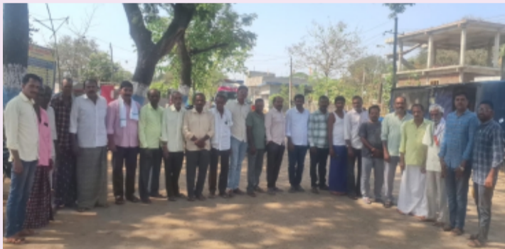
గూడూరు మండల ప్రతినిధి మే 01. (తెలంగాణ పత్రిక)