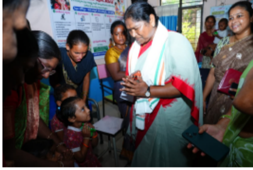
-ముందస్తు ఆరోగ్య పరీక్షల ద్వారా చిన్నారులను ఆరోగ్యవంతులు గా మార్చడమే బాల భరోసా ఉద్దేశ్యం.