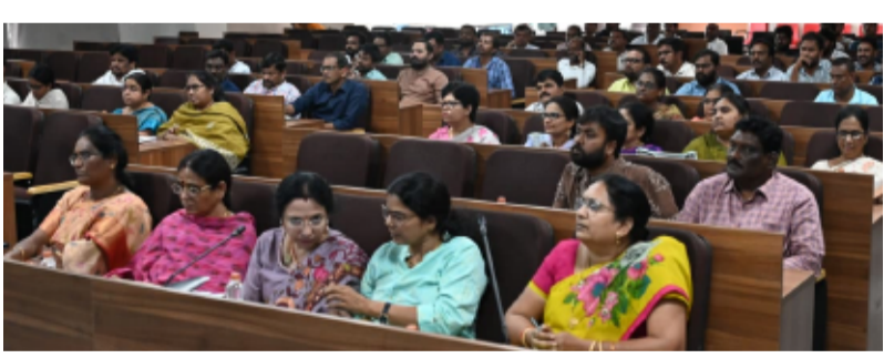
-రంగారెడ్డి జిల్లాలో జిల్లా స్థాయి ప్రత్యేక బృందాల కీలక నిర్ణయాలు