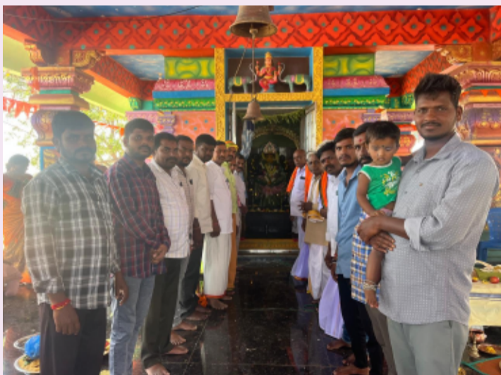
వెల్దుర్తిమండల ప్రతినిధి, మే 01 (తెలంగాణ పత్రిక):