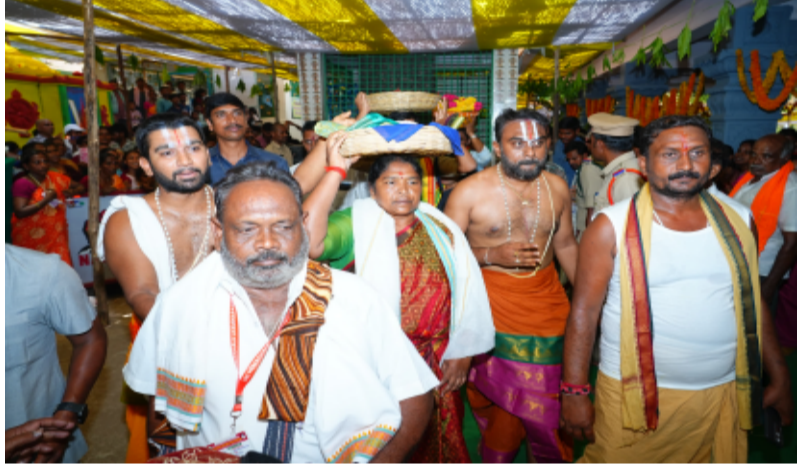
-రాష్ట్ర ప్రభుత్వం తరఫున పట్టుపస్త్రాలు సమర్పించిన మంత్రి సీతక్క