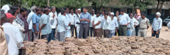
కామారెడ్డి, మే 15, (తెలంగాణ పత్రిక జిల్లా ప్రతినిధి)