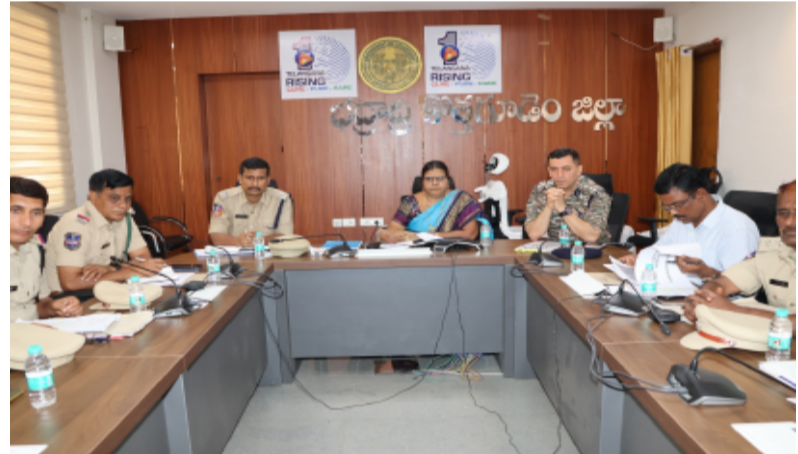
-మే 18న బూర్గంపాడులో మాక్ ఎక్స్చేంజ్ నిర్వహణ