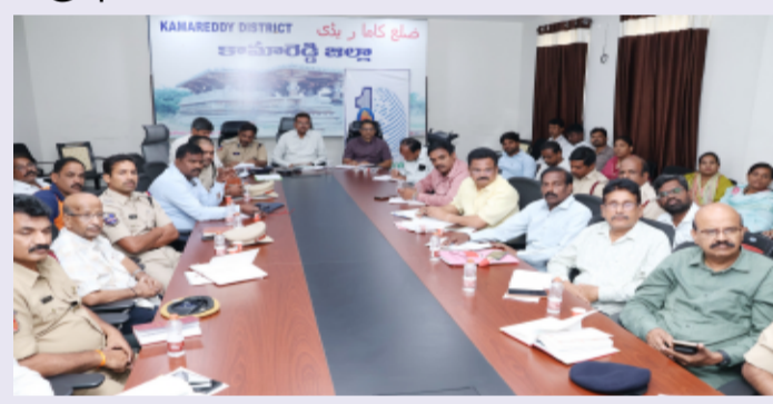
కామారెడ్డి, మే 15, (తెలంగాణ పత్రిక జిల్లా ప్రతినిధి)

అత్యవసర పరిస్థితులు, విపత్తు సందర్భాల్లో కామారెడ్డి జిల్లా స్థాయి సన్నద్ధత, శాఖల మధ్య సమన్వయం, స్పందన వ్యవస్థలను సమీక్షించేందుకు రాష్ట్ర ప్రభుత్వం అన్ని జిల్లాల కోసం రాష్ట్రస్థాయి టేబుల్ టాప్ ఎక్స్ సైజ్ నిర్వహించింది. ఈ సందర్భంగా కామారెడ్డి జిల్లా ఐ.డి.ఓ.సీ. కలెక్టర్, కామారెడ్డి నుండి ఆన్ లైన్ విధానంలో ఈ కార్యక్రమంలో చురుకుగా పాల్గొంది. జిల్లా కలెక్టర్, జిల్లా మేజిస్ట్రేట్ ఆన్ లైన్ ద్వారా టేబుల్ టాప్ ఎక్స్ సైజ్ లో పాల్గొని జిల్లా సన్నద్ధత చర్యలను సమీక్షించారు. అదనపు కలెక్టర్ (రెవెన్యూ), అదనపు కలెక్టర్ (లోకల్ బాడీస్)తో పాటు వివిధ శాఖల జిల్లా అధికారులు ఈ కార్యక్రమంలో పాల్గొని అత్యవసర పరిస్థితుల్లో శాఖల పాత్రలు, బాధ్యతలపై చర్చించారు. ఈ కార్యక్రమంలో శాఖల మధ్య సమన్వయం, విపత్తు స్పందన వ్యవస్థలు, కమ్యూనికేషన్ వ్యవస్థలు, అత్యవసర సన్నద్ధత, సహజ, మానవ వనస్థితి విపత్తుల సమయంలో తక్షణ స్పందనపై ప్రధానంగా దృష్టి సారించారు. అధికారులు వివిధ అత్యవసర పరిస్థితులను ఊహించి, పాటికి అనుగుణంగా స్పందన పూర్వకంపై చర్చించి జిల్లాలో సమర్థవంతమైన విపత్తు నిర్వహణకు చర్యలను సమీక్షించారు. ఇలాంటి టేబుల్ టాప్ ఎక్స్ సైజ్ లు శాఖల మధ్య సమన్వయాన్ని మరింత బలోపేతం చేయడంతో పాటు, అత్యవసర పరిస్థితులు, విపత్తులను సమర్థవంతంగా ఎదుర్కొనేందుకు జిల్లా స్థాయి సన్నద్ధతను పెంపొందించడంలో ఉపయోగకరంగా ఉంటాయని అధికారులు తెలిపారు.