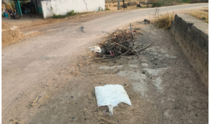
ఓదెల/ తెలంగాణ పత్రిక (మే 15)

వదిలేసారే తప్ప దాని పరిష్కరించే నాధుడే లేదని ప్రయాణికులు గ్రామ ప్రజలు ఆవేదన వ్యక్తం చేస్తున్నారు, రాత్రి అనక పగలనక అదే దారి గుంట ప్రభుత్వ కార్యాలయంలో పనిచేస్తున్న అధికారులు కూడా ఇదే దారిన పొద్దున సాయంత్రం వెళు తుంటారని అంతే కాకుండా అనేకమంది రైతులు తమ పొలాల కాడికి ఇదే దారిలో వెళుతూ ఉంటారు ఇప్పటివరకు గతంలో ఒక కారు కూడా అందులో పడ్డట్లు ఒక మనిషికి తీవ్రంగా గాయాలైనట్లు సమాచారం ప్రయాణికుల ప్రాణాల మీద ప్రభుత్వాలకు గాని నాయకులకు గాని ఇంత నిర్లక్ష్యమాని కొంతమంది ప్రయాణికులు ఆవేదన వ్యక్తం చేస్తున్నారు ఎంత మంచిగా ఏర్పడుతున్న