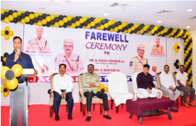
తెలంగాణ పత్రిక మే 15 జగిత్యాల జిల్లా ప్రతినిధి