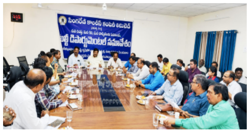
భద్రాద్రి కొత్తగూడెం తెలంగాణ పత్రిక మే 15

శుక్రవారం కొత్తగూడెం ఏరియా జిఎం కార్యాలయం నందు మల్టీ డిపార్ట్మెంట్ల టీమ్ సమావేశం నిర్వహించడం జరిగింది. ఈ సమావేశం లో సంస్థ అమలు చేస్తున్న సంక్షేమ కార్యక్రమాలు, ఉద్యోగుల బద్రతా ప్రమాణాలు, కంపెనీ ముందున్న సవాళ్ళు, నాణ్యతతో కూడిన బొగ్గును సరఫరా చేయడం వంటి విషయాలు చర్చించడం జరిగింది. అలాగే 2026 - 27 సంవత్సరానికి గాను సింగరేణి సంస్థ వ్యాప్తంగా 680 లక్షల టన్నుల బొగ్గు ఉత్పత్తి ని నిర్దేశించడం జరిగిందని, అందులో భాగంగా కొత్తగూడెం ఏరియాకు గాను 22.50, (PVK కి 2.50 వి కే సీఎం కి 20.00) లక్షల టన్నుల బొగ్గు ఉత్పత్తి లక్ష్యాలను నిర్దేశించారని తెలియజేశారు. సింగరేణి వ్యాప్తంగా అన్ని ఏరియాలలో ఈ ఆర్థిక