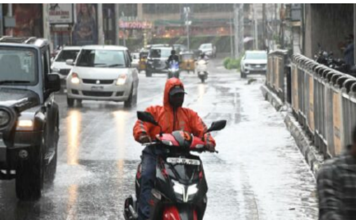
వాతావరణ శాఖ అధికారులు తెలిపారు. దీంతో ఉష్ణోగ్రతలు కొంత మేర తగ్గి అవకాశముందని అధికారులు చెప్పారు.

రహదారులపై స్వల్పంగా వర్షపు నీరు నిల్వ ఉండటంతో వాహనదారులు ఇబ్బందులు ఎదుర్కొన్నారు. ముఖ్యంగా ఇళ్లకు బయలుదేరిన ఆఫీసు సిబ్బంది ట్రాఫిక్ సమస్యలతో అవ్వలు పడ్డారు. పిల్లలు, యువత వర్షాన్ని ఆస్వాదిస్తుండగా, వ్యాపారులు మాత్రం ఆకస్మిక వర్షంతో ఇబ్బందులు ఎదుర్కొన్నారు. రాబోయే రోజుల్లో కూడా హైదరాబాద్ పరిసర ప్రాంతాల్లో అక్కడక్కడ చిరుజల్లులు కురిసే అవకాశం ఉందని