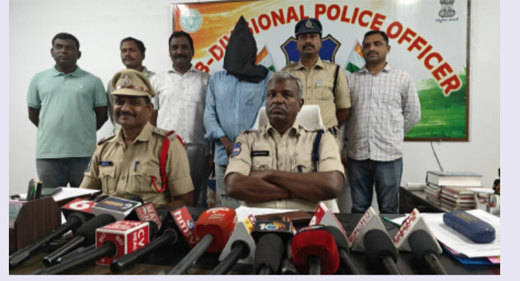
సిరిసిల్ల జిల్లా ప్రతినిధి, ఏప్రిల్ 16, తెలంగాణ పత్రిక