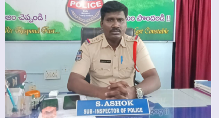
ఇల్లంతకుంట ఏప్రిల్ 16 తెలంగాణ పత్రిక