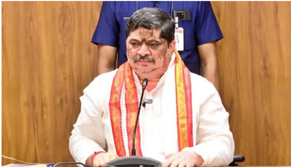
తెలంగాణ పత్రిక ప్రతినీధి