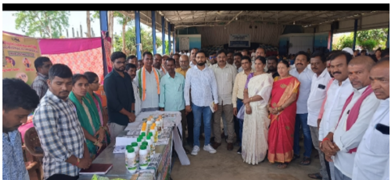
గంభీరావుపేట తెలంగాణ పత్రిక ఏప్రిల్ 16