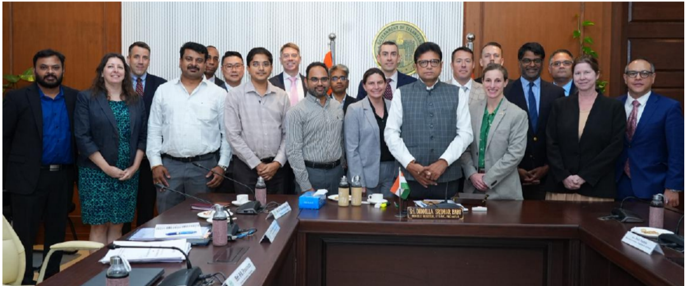
తెలంగాణ పత్రిక ప్రతినీధి

ఇప్పుడు ప్రపంచవ్యాప్తంగా మేడిన్ తెలంగాణ' మార్క్