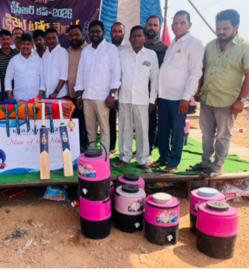
ఉందని చెప్పారు. జిల్లా స్థాయిలో ప్రథమ బహుమతి రూ. 2,00,000, ద్వితీయ బహుమతి రూ. 1,00,000గా ఉండనున్నట్లు తెలిపారు. గ్రామీణ యువత ఎలాంటి ఆటంకాలు లేకుండా క్రీడల్లో పాల్గొని విజయవంతం చేయాలని ఆయన పిలుపునిచ్చారు.

ఎంపీటీసీ పరిధి నుంచి 14 జట్లను ఎంపిక చేసినట్లు తెలిపారు. క్రీడామైదానంలో అవసరమైన అన్ని సదుపాయాలు ఏర్పాటు చేసినట్లు చెప్పారు. ఈ టోర్నీలో ప్రథమ బహుమతి రూ. 50,000, ద్వితీయ బహుమతి రూ. 20,000గా నిర్ణయించినట్లు వెల్లడించారు. గ్రామీణ ప్రాంతాల క్రీడాకారులను ప్రోత్సహించాలనే ఉద్దేశంతోనే ఈ కార్యక్రమం చేపట్టినట్లు పేర్కొన్నారు. మండల స్థాయి పోటీలు పూర్తయ్యాక గెలుపొందిన జట్లు జిల్లా స్థాయి పోటీల్లో పాల్గొనేందుకు పంపబడుతుందని తెలిపారు. జిల్లా స్థాయి పోటీల్లో ప్రతి లీగ్ మ్యాచ్ లో కేసీఆర్ పాల్గొనే అవకాశం