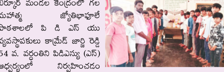
కోటగిరి తెలంగాణ పత్రిక ఏప్రిల్ 14.