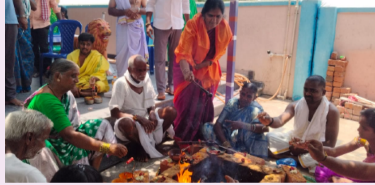
మెదక్ జిల్లా చిన్నశంకరంపేట (తెలంగాణ పత్రిక) ఏప్రిల్ 14