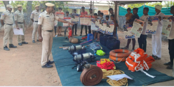
తెలంగాణ పత్రిక, పినపాక ప్రతినిధి, ఏప్రిల్ 14.

ఏప్రిల్ 14, మే నెలల్లో అగ్ని ప్రమాదాలు సంభవించే అవకాశాలు ఉంటాయని వీటి నివారణకై మండలంలోని ప్రజలందరూ తగు జాగ్రత్తలు తీసుకొని ప్రతి ఒక్కరు అప్రమత్తతతో వ్యవహరించాలని పినపాక మండల కేంద్రంలోని అగ్నిమాపక శాఖ కార్యాలయం సిబ్బంది తెలిపారు. ఈ సందర్భంగా వారు మాట్లాడుతూ 1944 ఏప్రిల్ 14న ఒక నౌకలో జరిగిన అగ్ని ప్రమాదంలో విధి నిర్వహణలో ఉన్న 66 మంది అగ్నిమాపక దళ సిబ్బంది అనువులు బాసిన కారణంగా వారి జ్ఞాపకార్థం అగ్నిమాపక వారోత్సవాలను నిర్వహించడం జరుగుతుందని తెలిపారు. ప్రతి సంవత్సరం వేసవి కాలంలో అధికంగా అగ్ని ప్రమాదాలు సంభవించే అవకాశం ఉంది... కావున ప్రజల్లో అవగాహన పెంచడానికి ప్రభుత్వం తరపున ప్రభుత్వ పాఠశాలల్లో, కళాశాలల్లో అవగాహన కార్యక్రమాలను నిర్వహించడం జరుగుతుందని ప్రజల్లో అగ్ని ప్రమాదాల నివారణలపై చైతన్యం పెంచడం ప్రమాదాల బారిన పడకుండా తగు జాగ్రత్తలు తీసుకోవడం అత్యవసర పరిస్థితుల్లో ఎలా స్పందించాలి తెలియజేయడమే ఈ కార్యక్రమ ముఖ్య ఉద్దేశమని తెలిపారు. చిన్న జాగ్రత్తలతో పెద్ద అగ్ని ప్రమాదాల నుంచి కాపాడుకోవచ్చని, గ్రామాల్లోని ప్రజలు తమ గృహాల్లో విద్యుత్ వైర్ల సర్క్యూట్ జరగకుండా, గ్యాస్ లీకేజీని అరికట్టటం వంటి తగు జాగ్రత్తలతో వ్యవహరించడం ద్వారా ప్రమాదాలు జరగకుండా నివారించే అవకాశం ఉందని అన్నారు. అగ్ని ప్రమాదం సంభవించిన వెంటనే 101 కి చరవాణి ద్వారా సమాచారం అందిస్తే వెంటనే అగ్నిమాపక శాఖ సిబ్బంది స్పందించి ప్రమాద తీవ్రతను తగ్గించి, అగ్ని నష్టం, ప్రాణనష్టం జరగకుండా కాపాడే వీలు ఉంటుందని తెలిపారు. ఈ అవగాహన కార్యక్రమంలో అగ్నిమాపక కార్యాలయ సిబ్బంది వెంకటాద్రి, చంద్ర, రామానాయుడు, ఉదయ్ తేజ పాల్గొన్నారు.