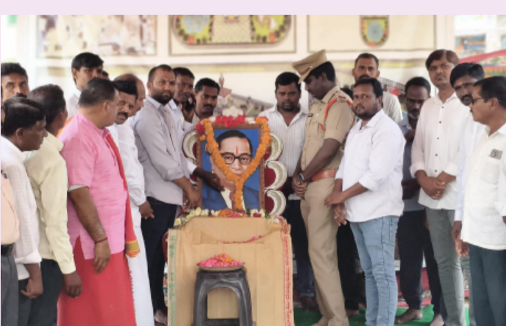
ఇల్లంతకుంట, ఏప్రిల్ 14 తెలంగాణ పత్రిక