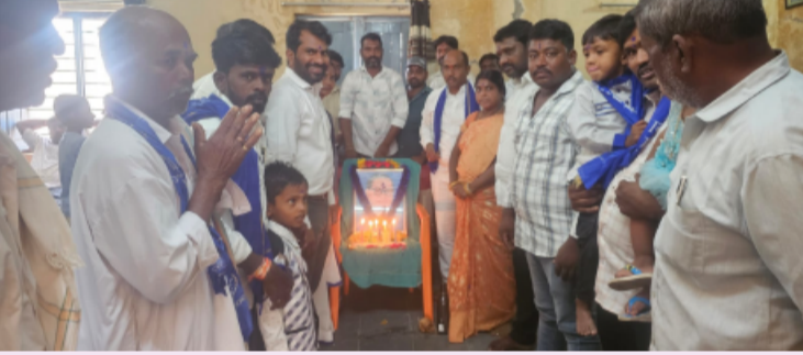
ముద్దోల్: 14ఏప్రిల్(తెలంగాణ పత్రిక)