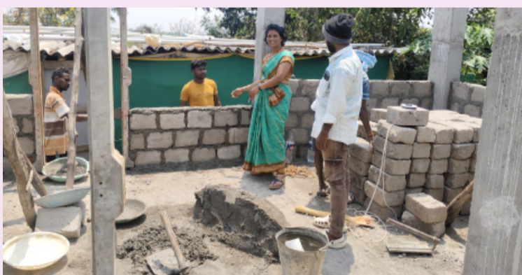
తెలంగాణ పత్రిక ములుగు జిల్లా ప్రతినిధి ఏప్రిల్ 14: