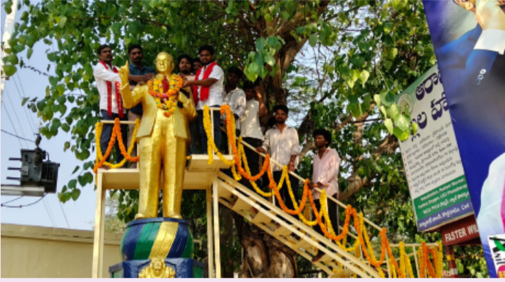
కొత్తగూడెం, ఏప్రిల్ 14: (తెలంగాణ పత్రిక)