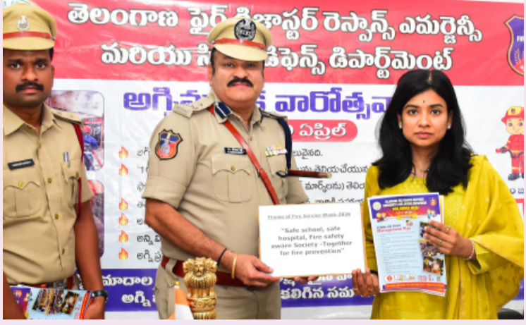
సిరిసిల్లా జిల్లా ప్రతినిధి, ఏప్రిల్ 14, తెలంగాణ పత్రిక

-జిల్లా కలెక్టర్ గరిమ అగ్రవాల్ -అగ్నిమాపక వారోత్సవాల పోస్టర్ల ఆవిష్కరణ