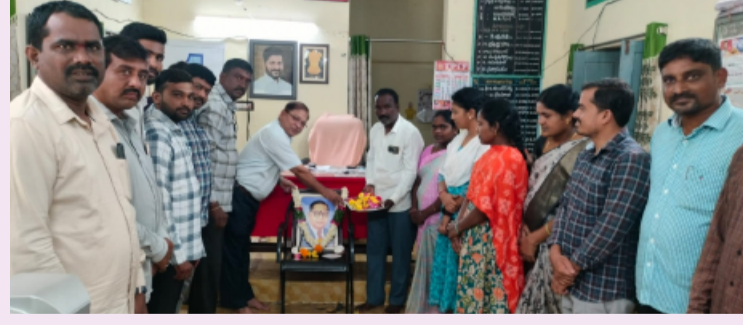
చేపరవల్లం, ఏప్రిల్ 14 (తెలంగాణ పత్రిక):