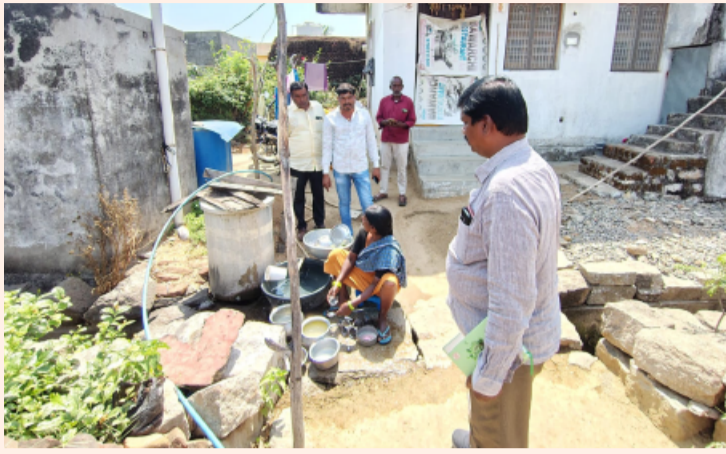
గంభీరాపుపేట తెలంగాణ పత్రిక ఏప్రిల్ 11

-ఆర్ డబ్ల్యు ఎస్ ఏ ఈ సిపావ్ ప్రేమ్ చందర్