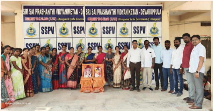
దేవరపల్లె, ఏప్రిల్ 11 (తెలంగాణ పత్రిక):