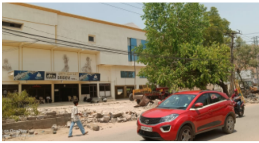
పూర్వం తర్వాత ట్రాఫిక్ సమస్యలు తగ్గి ప్రజలకు మెరుగైన రవాణా సౌకర్యం అందుతుందని అధికారులు ఆశాభావం వ్యక్తం చేశారు..