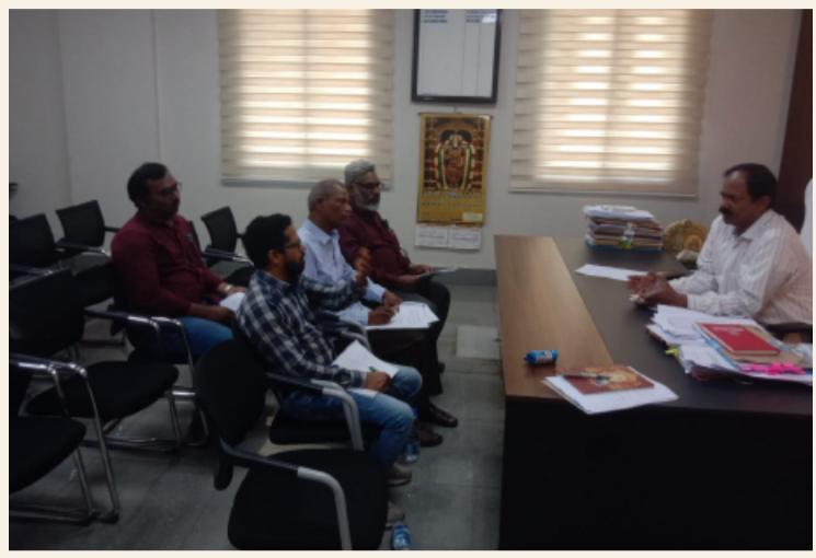
కొత్తగూడెం, ఏప్రిల్ 10 (తెలంగాణ పత్రిక)

రాష్ట్ర ఓపెన్ స్కూల్ సానైటీ నిర్వహిస్తున్న ఎస్సెస్సీ (పదో తరగతి), ఇంటర్మీడియట్ పబ్లిక్ పరీక్షలు ఈ నెల 20వ తేదీ నుంచి ప్రారంభం కానున్నాయని జిల్లా అదనపు కలెక్టర్ వేణుగోపాల్ రావు తెలిపారు. జిల్లాలో ఈ నెల 20వ తేదీ నుంచి ఓపెన్ ఎస్సెస్సీ, ఇంటర్ పరీక్షలు నిర్వహించేందుకు అన్ని ఏర్పాట్లు పూర్తి చేసినట్లు ఆయన తెలిపారు. జిల్లాలో మొత్తం 5 పరీక్షా కేంద్రాలు ఏర్పాటు చేశారు. వదో తరగతికి 1045 మంది, ఇంటర్మీడియట్ కి 1196 మంది విద్యార్థులు పరీక్షలకు హాజరుకానున్నారు. పరీక్షలు ఉదయం 9.00 గంటల నుంచి మధ్యాహ్నం 12.00 గంటల వరకు, మధ్యాహ్నం 2.30 గంటల నుంచి సాయంత్రం 5.30 గంటల వరకు నిర్వహించబడతాయి. పరీక్షా కేంద్రాలలో తాగునీరు, వైద్యం, విద్యుత్ తదితర సదుపాయాలు కల్పించారు. విద్యార్థులు హాల్ టికెట్లు అధికారిక వెబ్సైట్ http://www.telanganaopenschool.org ద్వారా డౌన్లోడ్ చేసుకోవచ్చని తెలిపారు. అలాగే వాట్సాప్ (8096958096) ద్వారా కూడా పొందవచ్చని పేర్కొన్నారు. విద్యార్థులు సమయానికి పరీక్షా కేంద్రాలకు చేరుకోవాలని, అన్ని నిబంధనలు పాటించాలని అధికారులు సూచించారు. మరిన్ని వివరాలకు సంబంధిత అధికారులను సంప్రదించవచ్చని తెలిపారు.