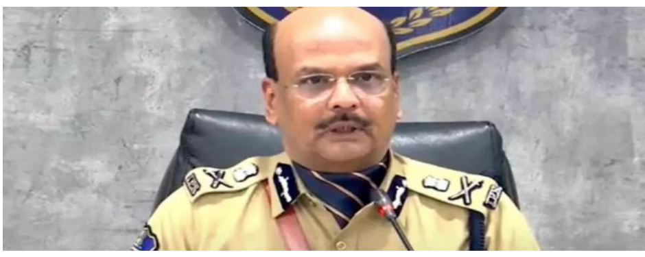
తెలంగాణ పత్రిక ప్రతినిధి