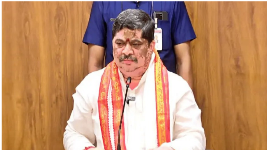
తెలంగాణ పత్రిక ప్రతినిధి

తెలంగాణ రాష్ట్ర రోడ్డు రవాణా సంస్థ (టీజీఎస్ఆర్టీసీ) ఉద్యోగులకు రాష్ట్ర ప్రభుత్వం శుభవార్త చెప్పింది. ఉద్యోగుల కరవు భత్యం (డీపీ) 2.1 శాతం పెంచుతూ కీలక నిర్ణయం తీసుకుంది. ఈ విషయాన్ని రవాణా శాఖ మంత్రి పొన్నం ప్రభాకర్ అధికారికంగా ప్రకటించారు. తాజా పెంపుతో ఆర్టీసీ ఉద్యోగుల డీపీ 50.7 శాతం నుంచి 52.8 శాతానికి చేరింది. ఈ నిర్ణయంతో సుమారు 38 వేల మందికి పైగా ఆర్టీసీ సిబ్బందికి లబ్ధి చేకూరునుంది. డీపీ పెంపు నిర్ణయం 2026 జనవరి నుంచే - మిగతా2లో