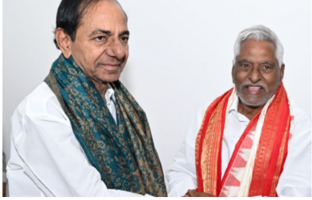
తెలంగాణ పత్రిక ప్రతినిధి

తెలంగాణ రాజకీయాల్లో మరో కీలక ఘట్టం చోటుచేసుకుంది. కాంగ్రెస్ పార్టీకి రాజీనామా చేసిన సీనియర్ నాయకుడు, మాజీ మంత్రి డి. జీవన్ రెడ్డి ఎర్రవెల్లిలోని ఫామ్ హౌస్ లో బీఆర్ఎస్ అధినేత కేసీఆర్ ను ఈరోజు కలిశారు. - మిగతా2లో