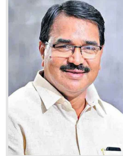
తెలంగాణ పత్రిక ప్రతినిధి