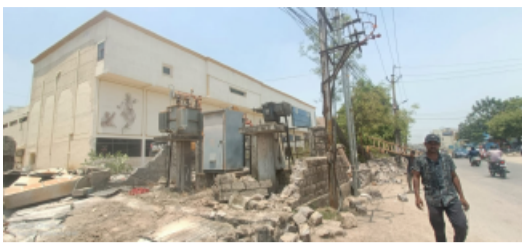
ఇచ్చిన అనంతరం ఈ చర్యలు చేపట్టినట్లు సమాచారం. స్థానికంగా కొంతసేపు ఉద్రిక్త పరిస్థితులు నెలకొన్నప్పటికీ, అధికారులు పరిస్థితిని అదుపులోకి తీసుకువచ్చారు. రోడ్డు విస్తరణ

రంగారెడ్డి జిల్లా, శేరిలింగంపల్లి పట్టణంలో 10, (తెలంగాణ పత్రిక) మియాపూర్ సర్కిల్ 48, పరిధిలో రోడ్డు విస్తరణ పనులు వేగవంతంగా కొనసాగుతున్న నేపథ్యంలో, శ్రీదేవి శ్రీలత థియేటర్ ప్రహారీ గోడను సైబరాబాద్ మున్సిపల్ కార్పొరేషన్ అధికారులు కూల్చివేశారు. ట్రాఫిక్ రద్దీని తగ్గించడం, రహదారులను విస్తరించడం లక్ష్యంగా ఈ చర్యలు చేపట్టినట్లు అధికారులు తెలిపారు. ఈ కూల్చివేత కార్యక్రమంలో మున్సిపల్ సిబ్బంది, ఇంజనీరింగ్ విభాగం అధికారులు పాల్గొన్నారు. ముందస్తు నోటీసులు