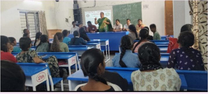
గుంటూరుపేట తెలంగాణ పత్రిక ఏప్రిల్ 8