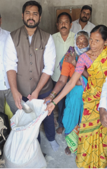
పెద్దపల్లి, ప్రతినాటి ఏప్రిల్ 08 ( తెలంగాణ పత్రిక )

పెద్దపల్లి జిల్లా కొలనూరు లో ప్రభుత్వం పేదలకు అందిస్తున్న సన్న బియ్యం పంపిణీ విధానాన్ని పెద్దపల్లి ఎంపీ గడ్డం వంశీకృష్ణ ఆకస్మికంగా పరిశీలించారు. రేషన్ దుకాణానికి చేరుకుని నిల్వలు, పంపిణీ విధానం, బియ్యం నాణ్యతను స్వయంగా పరిశీలించారు. రాబోయే మూడు నెలలకు సరిపడా బియ్యం నిల్వలు ఉన్నాయా అని స్థానిక డిలర్ ను అడిగి వివరాలు తెలుసుకున్నారు. పంపిణీ అవుతున్న బియ్యం పరిమాణం, నాణ్యతపై స్పష్టత తీసుకుని ప్రజలకు ఎలాంటి ఇబ్బందులు లేకుండా సరఫరా చేయాలని సూచించారు. బియ్యం తీసుకోవడానికి వచ్చిన ప్రజలతో కూడా మాట్లాడి, వారికి సకాలంలో బియ్యం అందజేస్తున్నారా? డిలర్ ఏమైనా ఇబ్బంది పెడుతున్నారా? అనే అంశాలను తెలుసుకున్నారు. ప్రజల అభిప్రాయాలను తెలుసుకుని సమస్యలు ఉంటే వెంటనే పరిష్కరించాలని అధికారులకు తెలిపారు. ఈ సందర్భంగా ఎంపీ స్వయంగా కొంతమంది లబ్ధిదారులకు బియ్యం పంపిణీ చేసి వారికి భరోసా కల్పించారు. ప్రభుత్వం అమలు చేస్తున్న పథకాలు నిజంగా అర్హులకు చేరాలని, ఎలాంటి అక్రమాలు జరిగితే కఠిన చర్యలు ఉంటాయని హెచ్చరించారు.