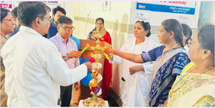
కొత్తగూడెం, ఏప్రిల్ 08(తెలంగాణ పత్రిక)

జిల్లా వైద్య ఆరోగ్య శాఖ ఆధ్వర్యంలో ప్రజా పాలన ప్రగతి ప్రణాళికలో భాగంగా నిర్వహిస్తున్న ఆరోగ్య వారోత్సవాల సందర్భంగా రామవరం మాతా శిశు కేంద్రంలో సురక్షిత మాతృత్వ దినోత్సవ కార్యక్రమం ఘనంగా నిర్వహించారు. ఈ కార్యక్రమంలో మాతా శిశు కేంద్ర సిబ్బంది, ప్రభుత్వ నర్సింగ్ కళాశాల విద్యార్థులు, బోధకులు, ఆశా కార్యకర్తలు, అంగన్వాడీ సిబ్బంది, వివిధ ప్రాథమిక ఆరోగ్య కేంద్రాల పర్యవేక్షకులు, అలాగే జిల్లాలోని పలు మండలాల నుండి వచ్చిన గర్భిణీలు మరియు ప్రసవనంతర తల్లులు ఉత్సాహంగా పాల్గొన్నారు. ఈ సందర్భంగా గర్భధారణ ముందు తీసుకోవాల్సిన జాగ్రత్తలు, ప్రసవ సమయంలో పాటించాల్సిన విధానాలు, ప్రసవనంతర సంరక్షణ, గర్భంలో శిశు లింగ నిర్ధారణ నిషేధ చట్టం ప్రాముఖ్యత, బాలికల సంరక్షణ--విద్య ప్రోత్సాహక వధకం, తల్లి ఆరోగ్యం మరియు పోషణ వంటి అంశాలపై సమగ్ర అవగాహన కల్పించారు. ఈ కార్యక్రమానికి ప్రభుత్వ సాధారణ ఆసుపత్రి కొత్తగూడెం అధికారి, మాతా శిశు కేంద్ర ప్రసూతి వైద్య విభాగ అధిపతి, ప్రభుత్వ నర్సింగ్ కళాశాల ప్రధానాచార్యులు, నర్సింగ్ పరిపాలకులు, తల్లి శిశు ఆరోగ్య కార్యక్రమ అధికారులు మరియు ఇతర సిబ్బంది హాజరయ్యారు. ఈ కార్యక్రమం ద్వారా తల్లి మరియు శిశు ఆరోగ్యం పై ప్రజల్లో అవగాహన పెంపొందించడంలో కీలక పురోగతి సాధించబడిందని అధికారులు తెలిపారు. మంచి పాల్గొనడంతో కార్యక్రమం విజయవంతంగా ముగిసింది.