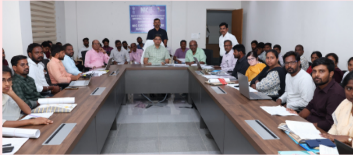
కామారెడ్డి, ఏప్రిల్ 7, (తెలంగాణ పత్రిక జిల్లా ప్రతినిధి)