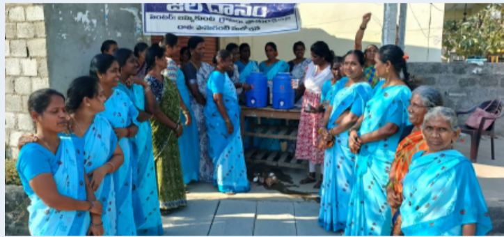
వీణవంక ప్రతినిధి, ఏప్రిల్ 7 ( తెలంగాణ పత్రిక).