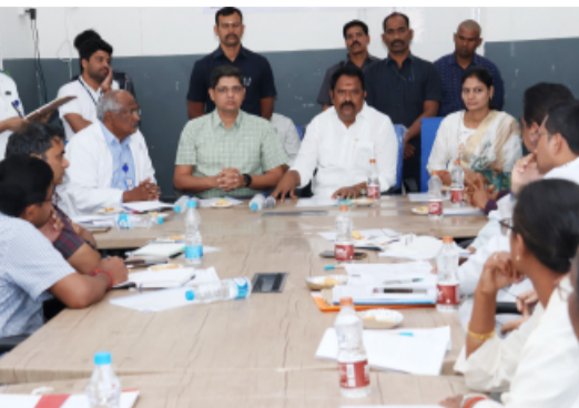
తీసుకు రావాలని నిర్ణయించారు.

సదుపాయాల కల్పన కొరకు ప్రభుత్వ డిగ్రీ కళాశాల భూమిలో నూతనంగా నిర్మించిన మెడికల్ కళాశాల భవనంలో ఒకే ప్రాంగణంలో ట్రామా కేర్ సెంటర్, క్రిటికల్ కేర్ సెంటర్, జనరల్ హాస్పిటల్, మాతా శిశు సంక్షేమ అసుపత్రి , మెడికల్ కళాశాల లను అందుబాటులోనికి తీసుకురావాలని నిర్ణయించడం జరిగింది. గౌరవ కలెక్టర్ చైర్మన్ గా హాస్పిటల్ డెవలప్మెంట్ సొసైటీ. నిర్ణయం మేరకు కమిటీ ఏర్పాటు చేసి జిల్లా నుండి ఆగస్టు లోగా అన్ని విభాగాలు నూతన ప్రాంగణంలో అందుబాటులోకి