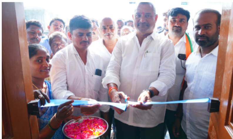
మిర్యాలగూడ ప్రతినిధి/ఏప్రిల్ 7:(తెలంగాణ పత్రిక)