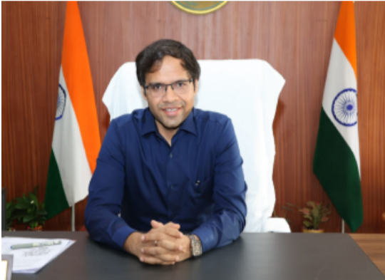
తమకు సంబంధించిన కేంద్ర ప్రభుత్వ పథకాల ప్రగతి నివేదికలు, వివరాలతో సమావేశానికి సిద్ధంగా హాజరు కావాలని ఆదేశించారు.