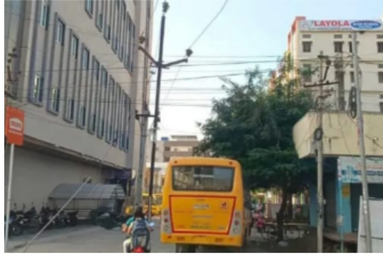
దారిలో వెళ్తు ప్రమాదాల గురయ్యే అవకాశాలు ఉన్నాయి అని పలువురు వాహనదారులు ఆవేదన వ్యక్తం చేస్తున్నారు.

ముందుకు వెళ్లే మారు అపార్థమెంట్లు ఉన్నాయి. వీటన్నిటికీ వెళ్లే దారి సూపర్ మార్కెట్, లయాలా పాఠశాల మధ్యలో ఉంది. అయితే ప్రధాన రహదారికి ఆనుకుని పాఠశాలకు వెళ్లే దారిలో అటు ఇటువైపుగా సిమెంట్ విద్యుత్ స్తంభాలు ఉన్నాయి. రోడ్డు మధ్యలో మాత్రం ఇసుప విద్యుత్ స్తంభం ప్రమాదకరంగా మారింది. పాఠశాలకు విద్యార్థులను తీసుకెళ్లేందుకు విద్యార్థుల తల్లిదండ్రులు కార్లు, బైక్లపై వెళ్తుండగా రద్దీ ఏర్పడుతోంది. మధ్యలో విద్యుత్ స్తంభం ఉండడంతో రహదారి ఇరుకుగా మారుతోంది. అలాగే పాఠశాలకు సంబంధించిన బస్సులు సైతం అదే