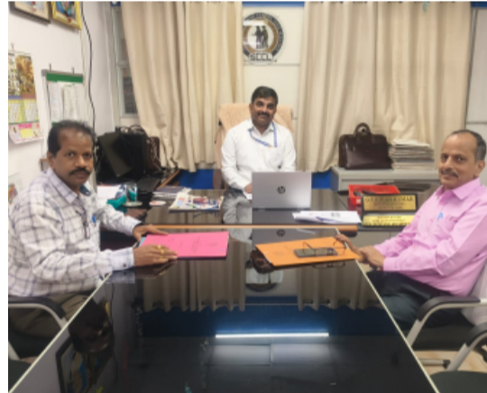
ఏరియాల పర్సనల్ డిపార్ట్మెంట్ అధికారులు వీడియో కాన్ఫరెన్స్ ద్వారా పాల్గొన్నారు.