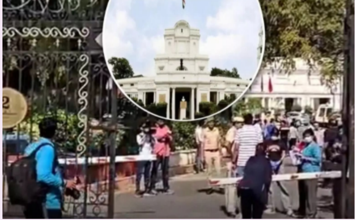
తెలంగాణ పత్రిక ఏప్రిల్ 06