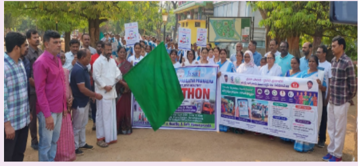
తెలంగాణ పత్రిక పరంగల్ ఉమ్మడి జిల్లా బ్యూరో 6 ఏప్రిల్