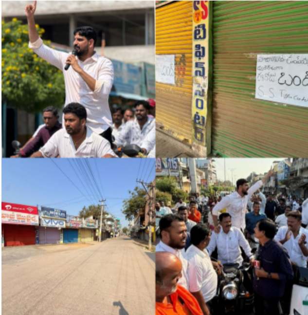
పాల్గొంటానని తెలిపారు. బండ్ కు సహకరించిన అన్ని వర్గాల ప్రజలకు ఎమ్మెల్యే కౌశిక్ రెడ్డి ప్రత్యేక కృతజ్ఞతలు తెలిపారు.

అనారోగ్య సమస్యలకు గురయ్యే ప్రమాదం ఉందని అన్నారు. దేశానికి నాణ్యమైన విత్తనాలను అందించే ఈ ప్రాంతంలోని వ్యవసాయ భూములు నాశనం అయ్యే ప్రమాదం ఉందని ఆందోళన వ్యక్తం చేశారు. ఈ అంశంలో రాజకీయాలకు అతీతంగా అందరూ కలిసి డంపింగ్ యార్డ్ కు వ్యతిరేకంగా పోరాడాలని ఆయన పిలుపునిచ్చారు. రాష్ట్ర ప్రభుత్వం వెంటనే స్పందించి డంపింగ్ యార్డ్ ప్రతిపాదనను ఉపసంహరించుకోవాలని, లేదంటే భవిష్యత్తులో మరిన్ని ఆందోళన కార్యక్రమాలు చేపడతామని హెచ్చరించారు. ఈ నెల 7, 8 తేదీల్లో అఖిలవక్షం ఆధ్వర్యంలో ఏర్పాటు చేసిన ధర్నా కార్యక్రమంలో రెండు రోజుల పాటు