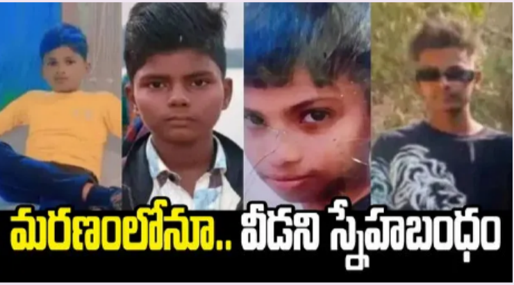
మరణం లోనూ.. వీడని స్వేచ్ఛాబంధం