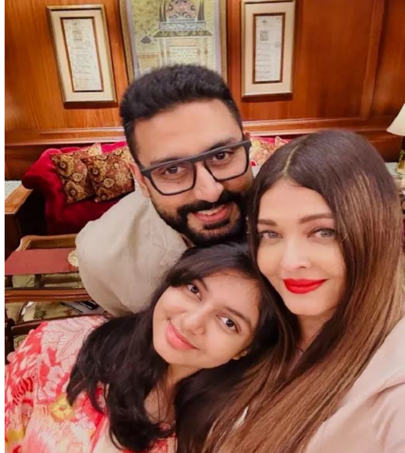
విధంగానే వారిని భవిష్యత్తుకు సిద్ధం చేయాలి. మా ఇంట్లో ఎవరు ముగ్గురు, ఎవరు ఆడ అనే పోటీ ఎప్పుడూ ఉండదు" అని ఆయన స్పష్టం చేశారు. కాగా, అభిషేక్, ఐశ్వర్య 2007 ఏప్రిల్ 20న వివాహం చేసుకున్నారు. ఈ ఏడాదితో వారి వైవాహిక బంధానికి 19 ఏళ్లు పూర్తి కానున్నాయి.