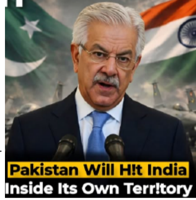
Pakistan Will Hit India Inside Its Own Territory