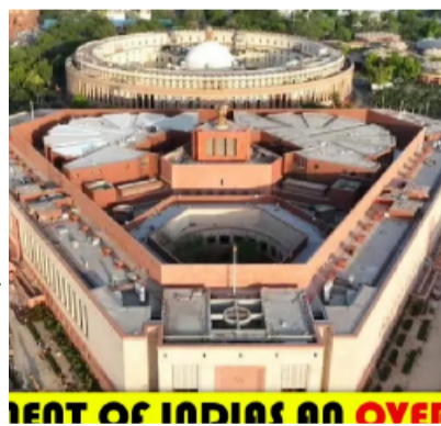
FEAT OF INDIAN AN OVER

మహిళా రిజర్వేషన్ల సవరణ బిల్లు, ఎఫ్ సీఆర్ఎ సవరణ బిల్లు వంటి ముఖ్యమైన బిల్లులను ఆమోదించే జేసుకునేందుకు కేంద్ర ప్రభుత్వం బడ్జెట్ సమావేశాలను పొడిగించేందుకు ప్రయత్నిస్తోంది. గురువారం బడ్జెట్ సమావేశాల రెండో దశ ముగిసిన తరువాత పార్లమెంట్