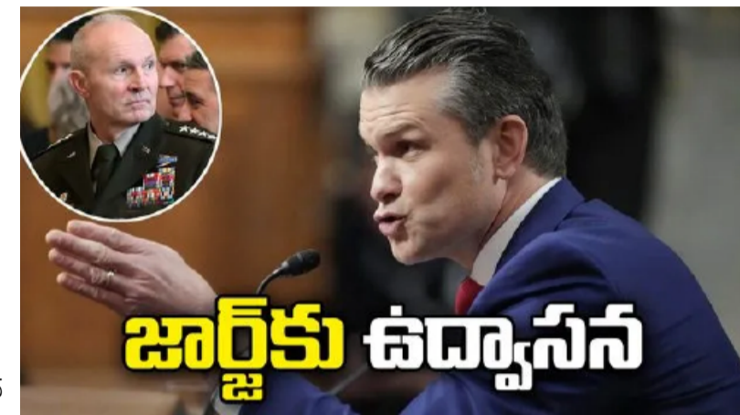
జార్జ్ కు ఉద్వాసన

ఇప్పటివరకు సైన్యంలోని ఉన్నతస్థాయి పదవుల్లోని సుమారు డజనుకుపైగా అధికారులను తొలగించడం గమనార్హం. అందులో జార్జ్ ఒకరు. 1988 వెస్ట్ పాయింట్ మిలిటరీ అకాడమీ గ్రాడ్యుయేట్, పదాతిదళ అధికారి అయిన జార్జ్.. అమెరికన్ ఆర్మీ 41వ చీఫ్ ఆఫ్ స్టాఫ్ జనరల్ గా 2023 సెప్టెంబర్ 21న బాధ్యతలు స్వీకరించారు. అంతకుముందు ఆయన 38వ వైస్ చీఫ్ ఆఫ్ స్టాఫ్ గా.. తొలి గల్ఫ్ యుద్ధంతో పాటు ఇరాక్, అఫ్ఘానిస్థాన్ లలోనూ పనిచేశారు. సైన్యంలో బాధ్యతలు చేపట్టడానికి ముందు ఆయన యూఎస్