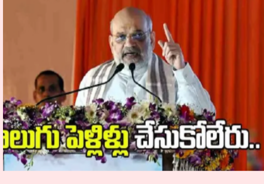
నాలుగు పెళ్లిళ్లు చేసుకోలేరు..

చౌరబాటుదారులు నాలుగు పెళ్లిళ్లు చేసుకోకుండా ఉమ్మడి పౌరస్మృతి (UCC)తో అడ్డుకునే విలుటుందని కేంద్ర హోం మంత్రి అమితేషా అన్నారు. అస్సాంలోని గోల్ పాదాలో శుక్రవారంనాడు జరిగిన