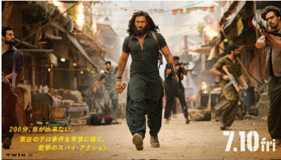
206分、息が出来ない。 実在のテロ事件を背景に描く、 衝撃のスパイ・アクション。 7.10 in

బాలీవుడ్ స్టార్ హీరో రణవీర్ సింగ్ నటించిన బ్లాక్ బస్టర్ చిత్రం 'ధురంధర్' (పార్ట్ 1) ఇప్పుడు జపాన్ లో సందడి చేసేందుకు సిద్ధమైంది. ప్రపంచవ్యాప్తంగా బాక్సాఫీస్ రికార్డులను తిరగరాసిన ఈ పై యాక్షన్ థ్రిల్లర్, జూలై 10న జపాన్ లోని థియేటర్లలో విడుదల కానుంది. ఈ విషయాన్ని నిర్మాణ సంస్థలైన జియో స్టూడియోస్, టీ62 స్టూడియోస్ తమ అధికారిక ఇన్స్టాగ్రామ్ ఖాతాల ద్వారా ప్రకటించాయి. జపాన్ లో వివరాలతో కూడిన పోస్టర్ ను కూడా విడుదల చేశాయి. "ఇక జపాన్ 'ధురంధర్' ఎన్టీవీ చూసే సమయం వచ్చింది" అంటూ క్యాప్షన్ జోడించాయి. 2025 డిసెంబర్ 5న ప్రపంచవ్యాప్తంగా విడుదలైన ఈ చిత్రం, అప్పట్లో ఏకంగా రూ. 1328 కోట్లకు పైగా వసూళ్లు సాధించి సంచలనం సృష్టించింది. ముఖ్యంగా అంతర్జాతీయ మార్కెట్ లో ఈ సినిమా అద్భుతమైన ప్రదర్శన కనబరిచింది. నార్త్ అమెరికాలో ఆల్ టైమ్ సెంబర్ 1 హిందీ చిత్రంగా నిలవడమే కాకుండా కెనడా, ఆస్ట్రేలియాలో అత్యధిక వసూళ్లు సాధించిన భారతీయ సినిమాగా చరిత్రకెక్కింది. యూకేలో కూడా అత్యంత ప్రదర్శన కనబరిచిన చిత్రాల్లో ఒకటిగా నిలిచింది. ఆదిత్య ధర్ రచన, దర్శకత్వం, నిర్మాణంలో ఈ సినిమా తెరకెక్కింది. 'ధురంధర్' రెండు భాగాలుగా వస్తున్న చిత్రం. మొదటి భాగంలో, భారతదేశాన్ని లక్ష్యంగా చేసుకున్న ఉగ్రవాద నెట్ వర్క్ ను ఛేదించడానికి పాకిస్థాన్ లోని కరాచీకి వెళ్లిన ఒక అందరికవర్ భారతీయ ఇంటెలిజెన్స్ ఏజెంట్ కథను చూపించారు. దక్షిణాసియాలోని పలు వాస్తవ భౌగోళిక, రాజకీయ సంఘటనల స్ఫూర్తితో ఈ సినిమా కథను రూపొందించారు. ఈ చిత్రంలో రణవీర్ సింగ్ తో పాటు అక్షయ్ ఖన్నా, సంజయ్ దత్, అర్జున్ రాంపాల్, ఆర్. మాధవన్ వంటి ప్రముఖ తారలు నటించారు. ప్రపంచవ్యాప్తంగా ఘన విజయం సాధించిన ఈ చిత్రం, జపాన్ లో ఎలాంటి స్పందన రాబట్టుకుంటుందోనని సినీ వర్గాల్లో ఆసక్తి నెలకొంది.