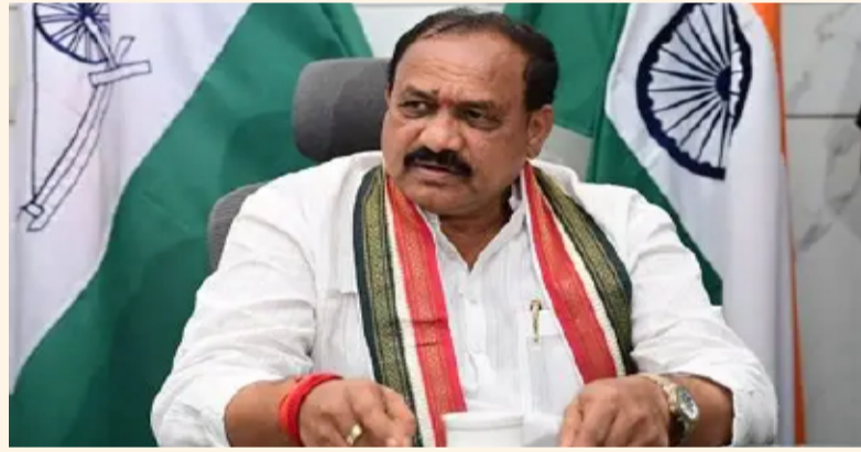
తెలంగాణ పత్రిక ప్రతినీధి