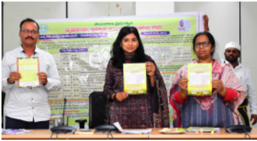
-వ్యవసాయ అధికారులు, పోలీసులు సంయుక్తంగా తనిఖీలు చేయాలి