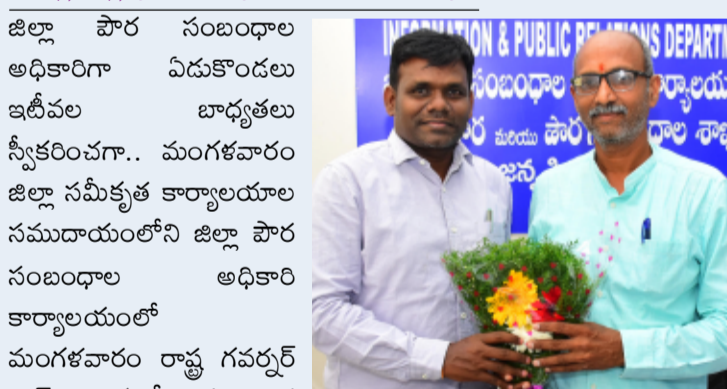
నిరిసిల్ల జిల్లా ప్రతినిధి, ఏప్రిల్ 28, తెలంగాణ పత్రిక