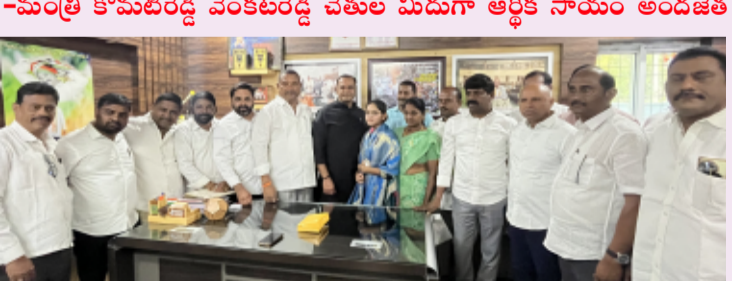
మిర్యాలగూడ ప్రతినిధి/ఏప్రిల్ 28: (తెలంగాణ పత్రిక):-

-మంత్రి కోమటిరెడ్డి వెంకటరెడ్డి చేతుల మీదుగా అర్థిక సాయం అందజేశ