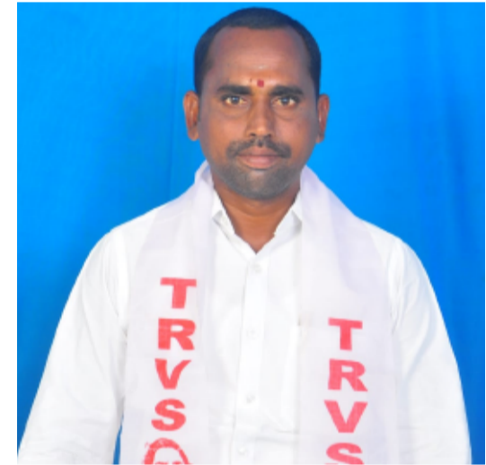
రజక వృత్తిదారుల సంఘం ప్రభుత్వాన్ని కోరింది.

అన్నారు. తీవ్రంగా గాయపడిన ఆయనను వెంటనే ఆస్పత్రికి తరలించి చికిత్స అందిస్తున్నారని తెలిపారు. ఈ ఘటనకు సంబంధించి పోలీసులు ఇప్పటికే ఇద్దరిని అదుపులోకి తీసుకున్నట్లు సమాచారం. అయితే, మిగిలిన నిందితులను కూడా త్వరితగతిన గుర్తించి అరెస్టు చేయాలని సారయ్య డిమాండ్ చేశారు. కేసులో అన్ని కోణాల్లో సమగ్ర విచారణ జరిపి బాధ్యులపై చట్టపరమైన చర్యలు తీసుకోవాలని కోరారు. అలాగే, గ్రామంలో శాంతిభద్రతల పరిరక్షణ కోసం ప్రత్యేక పోలీసు పిటెట్ ఏర్పాటు చేయాలని, స్థానిక ప్రజల్లో భద్రతాభావం కల్పించేలా పోలీస్ యంత్రాంగం నిష్పక్షపాతంగా వ్యవహరించాలని విజ్ఞప్తి చేశారు. ఈ ఘటనపై పూర్తి స్థాయి విచారణ జరిపి బాధిత కుటుంబానికి న్యాయం చేయాలని