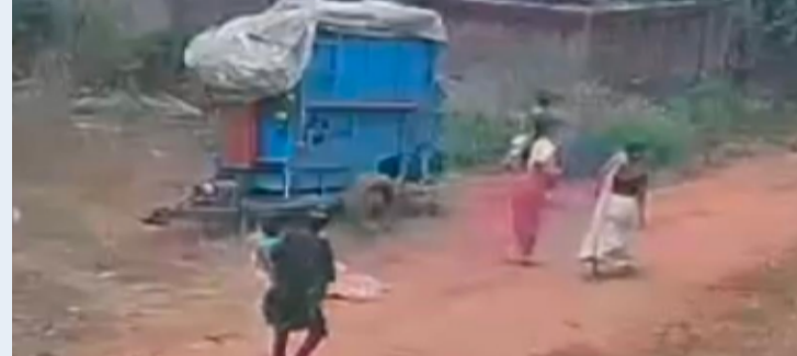
తెలంగాణ పత్రిక దమ్మపేట ఏప్రిల్ 28