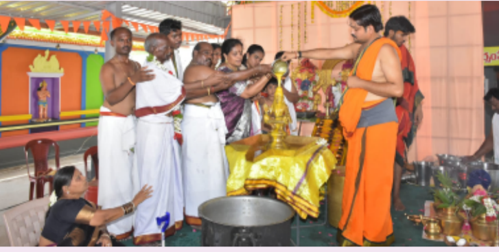
సర్పంపేట ఏప్రిల్ 28 తెలంగాణ పత్రిక