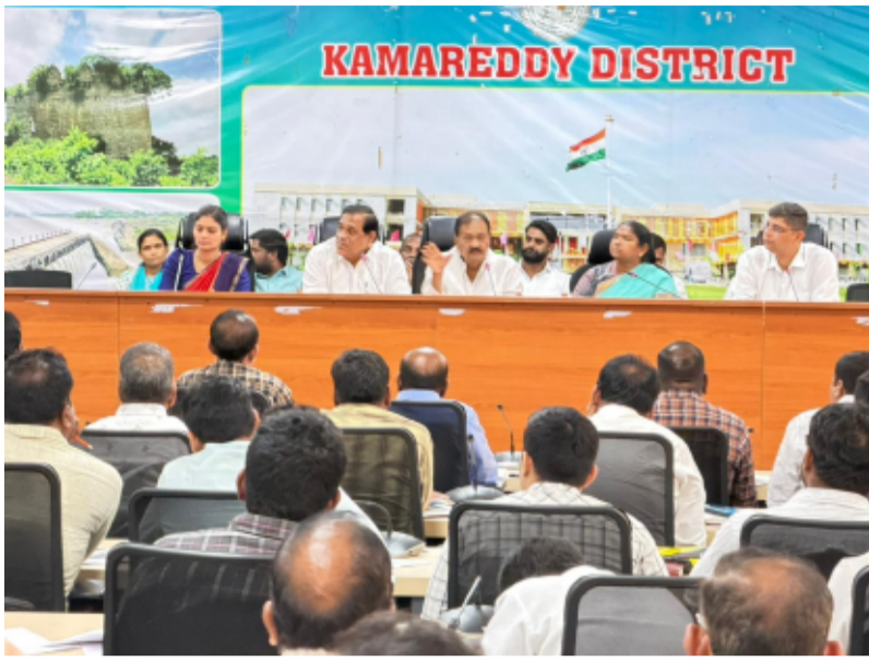
-రాష్ట్ర శిశు సంక్షేమ శాఖ మంత్రి సీతక్క

కామారెడ్డి, ఏప్రిల్ 28, (తెలంగాణ పత్రిక జిల్లా ప్రతినిధి) పథకాల అమల్లో రాష్ట్రంలోనే కామారెడ్డి జిల్లా ఆదర్శంగా నిలపాలని జిల్లా ఇంచార్జ్ మంత్రి, రాష్ట్ర శిశు సంక్షేమ శాఖ మంత్రి సీతక్క జిల్లా అధికారులకు దిశా నిర్దేశం చేశారు. మంగళవారం కామారెడ్డి పట్టణంలోని కలెక్టర్ కార్యాలయంలో జిల్లా ఇన్చార్జ్ మంత్రి సీతక్క అధ్యక్షతన సమీక్ష సమావేశం ఘనంగా నిర్వహించారు. ఈ సమావేశంలో ప్రభుత్వ సలహాదారు మహమ్మద్ అలీ షబ్దీర్, జహీరాబాద్ పార్లమెంట్ సభ్యులు సురేష్ షట్టర్, జిల్లా అధికార యంత్రాంగం పాల్గొన్నారు. జిల్లాలో తాగునీటి సరఫరా, సాగునీటి పరిస్థితి, సివిల్ సప్లై, ఇందిరమ్మ ఇళ్ల నిర్మాణం, ఎండాకాలంలో వడదెబ్బల నివారణ చర్యలు, అలాగే ప్రభుత్వం అమలు చేస్తున్న 99 సంక్షేమ, అభివృద్ధి పథకాలపై సమగ్రంగా సమీక్ష నిర్వహించారు. ఈ సందర్భంగా మంత్రి సీతక్క మాట్లాడుతూ, కామారెడ్డి జిల్లా రాష్ట్రంలోనే ఆదర్శంగా నిలవాలని అధికారులను దిశానిర్దేశం చేశారు.