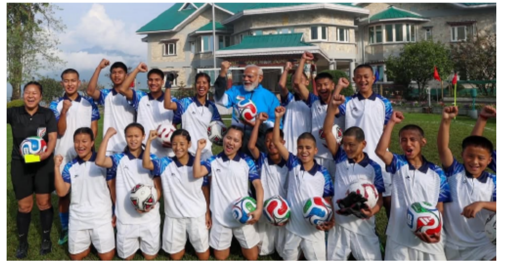
తెలంగాణ పత్రిక ప్రతినీధి

నరేంద్ర మోదీ సిక్కిం రాష్ట్ర రాజధాని గ్యాంగ్టక్ లో సందడి చేశారు. యువతతో కలిసి ఫుట్ బాల్ ఆడుతూ ఉల్లాసంగా గడిపారు. సిక్కిం రాష్ట్ర అవతరణ జరిగి 50 సంవత్సరాలు పూర్తయిన సందర్భంగా వేడుకలు జరుగుతున్నాయి. మంగళవారం జరగబోయే ముగింపు వేడుకల కోసం ప్రధాని గ్యాంగ్టక్ చేరుకున్నారు. ప్రధాని నరేంద్ర మోదీ ఫుట్ బాల్ ఆడారు. సిక్కిం 50వ అవతరణ దినోత్సవం సందర్భంగా ఆ రాష్ట్రంలో పర్యటిస్తున్న ప్రధాని మంగళవారం ఉదయం - మిగతా2లో