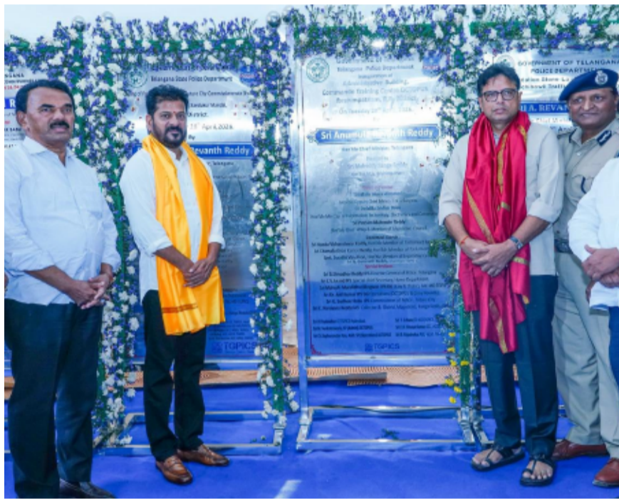
తెలంగాణ పత్రిక ప్రతినీధి

ఘోషచర్ సిటీ భవిష్యత్ తరాలకు వరమని తెలంగాణ సీఎం రేవంత్ రెడ్డి అన్నారు. అందరి కృషితోనే ఘోషచర్ సిటీ నిర్మాణం జరుగుతోందని తెలిపారు. ఈ సిటీ నిర్మాణం అంత సులభం కాదన్నారు. అయితే వక్కా ప్రణాళికతో ప్రపంచ నగరాలకు దీటుగా నిర్మించబోతున్నామని అన్నారు. సూతనంగా ఏర్పాటు చేసే నగరంలో తమనూ కలవాలని స్థానిక గ్రామాల ప్రజలు డిమాండ్ చేస్తున్నారని వెల్లడించారు. ప్రజల్ని అభివృద్ధిలో భాగస్వాములు చేయడమే కాంగ్రెస్ ప్రభుత్వ లక్ష్యమని రేవంత్ చెప్పుకొచ్చారు. రంగారెడ్డి జిల్లా మిర్జాపూర్ పేట్లో ఘోషచర్ సిటీ పోలీస్ కమిషనరేట్ భవన నిర్మాణానికి ముఖ్యమంత్రి రేవంత్ శంకుస్థాపన చేశారు. అలాగే పలు అభివృద్ధి పనులను ప్రారంభించారు. మల్కాజ్ గిరి కమిషనరేట్ భవనం, ఆక్టోపస్ ఆడినిస్ట్రేటివ్ బ్లాక్, కుత్బుల్లాపూర్ డి.సి.పి కార్యాలయాలను ప్రారంభించారు. - మిగతా2లో