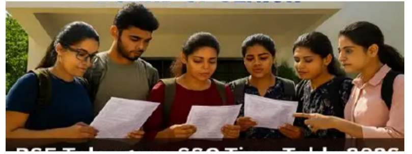
తెలంగాణ పత్రిక ప్రతినీధి

తెలంగాణలో పదో తరగతి పరీక్షా ఫలితాల విడుదలకు ముహూర్తం ఖరారైంది. బుధవారం మధ్యాహ్నం 2 గంటలకు ఫలితాలు వెల్లడించనున్నట్లు ప్రభుత్వ పరీక్షల విభాగం వెల్లడించింది. ప్రభుత్వ నలహాదారు - మిగతా2లో