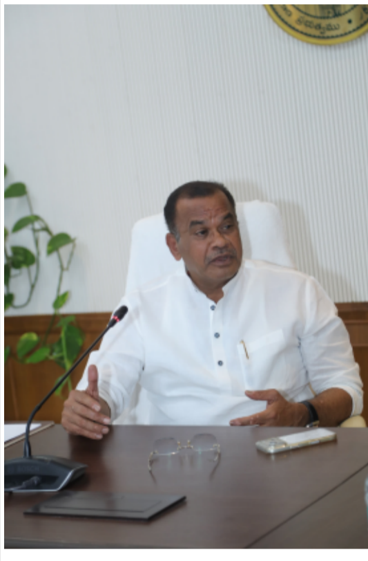
తెలంగాణ పత్రిక ప్రతినిధి