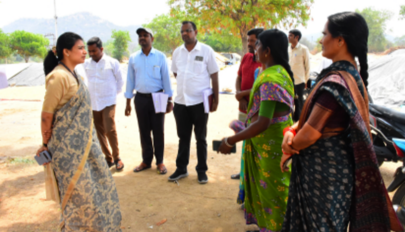
-రైతులు సన్నరకం వడ్లు సాగు చేయాలి