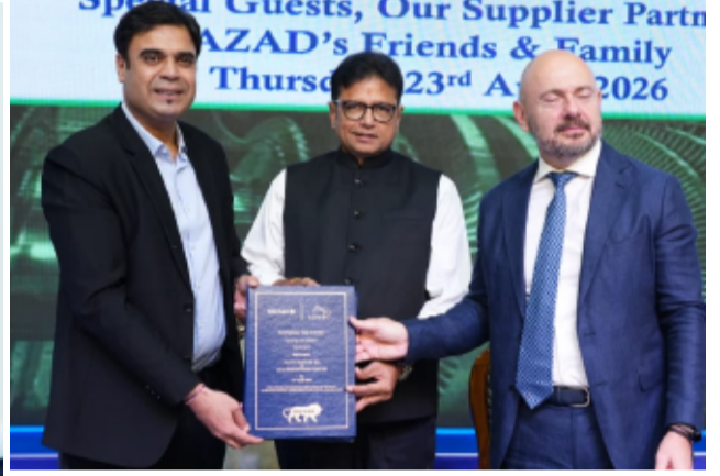
తెలంగాణ పత్రిక ప్రతినిధి

ఆర్టీసీ కార్మికులు తొందరపాటు నిర్ణయాలు తీసుకోవద్దని తెలంగాణ ముఖ్యమంత్రి రేవంత్ రెడ్డి అన్నారు. కేబినెట్ భేటీలో మాట్లాడారు. ప్రాణాలు తీసుకోవడం వల్ల సమస్య పరిష్కారం కాదన్నారు. సమస్యలు పరిష్కరించేందుకు తాము చిత్తుతో ఉన్నామని.. ఈ అంశంపై ప్రభుత్వం దృష్టి సారించిందని తెలిపారు. శుక్రవారం కార్మిక సంఘాలతో చర్చించాలని మంత్రులకు సీఎం సూచించారు. ఈక్రమంలో డిప్యూటీ సీఎం భట్టి విక్రమార్క ఆధ్వర్యంలో మంత్రులు.. కార్మిక సంఘాలతో సమావేశం కానున్నారు. - మిగతా2లో