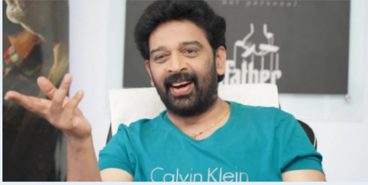
ఏప్రిల్ 22 (తెలంగాణ పత్రిక)

ఎప్పుడూ ముక్కుసూటిగా మాట్లాడే సినీ నటుడు జేడీ చక్రవర్తి, తాజాగా ఒక ఇంటర్వ్యూలో తెలుగు సినీ పరిశ్రమలోని కొన్ని చేదు నిజాలను బయటపెట్టారు. ముఖ్యంగా నటీమణులకు ఎదురయ్యే నష్టాలు, అగ్ర హీరోల ఆలోచనా దృక్పథంపై ఆయన చేసిన వ్యాఖ్యలు చర్చనీయాంశమయ్యాయి. ఇండస్ట్రీలో ఎన్నో అన్యాయాలు జరుగుతున్నాయని, కానీ అవి బయటి ప్రపంచానికి తెలియవని జేడీ పేర్కొన్నారు. తెలిసిన వారు కూడా భయం వల్ల నోరు విప్పరని చెప్పారు. అగ్ర హీరోలు తమ కూతుళ్లను వెండితెరపై చూడటానికి ఎందుకు వెనకాడుతారనే ప్రశ్నపై స్పందిస్తూ... ఇక్కడ ఉండే పరిస్థితులు, ఆడపిల్లల పట్ల ఉండే ధోరణి దానికి ప్రధాన కారణమని అన్నారు. ఇతర భాషల నటీమణులకు ఇచ్చే ప్రాధాన్యత మన తెలుగు అమ్మాయిలకు దక్కడం లేదని, ప్రతిభ ఉన్నా కొన్ని అలిఖిత నిబంధనలు వారిని అడ్డుకుంటున్నాయని నటిజన్లు వ్యాఖ్యానిస్తున్నారు. గతంలో సీనియర్ నటి రాధికా శర్మ కుమార్ కూడా తన భర్త తమ కుమార్తెను సినిమాల్లోకి పంపడానికి ఇష్టపడలేదని చెప్పిన విషయాన్ని ఈ సందర్భంగా గుర్తు చేసుకుంటున్నారు.