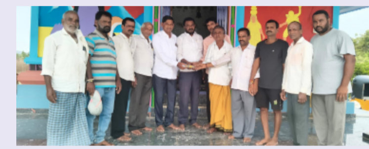
ఇల్లంతకుంట 21 ఏప్రిల్ తెలంగాణ పత్రిక