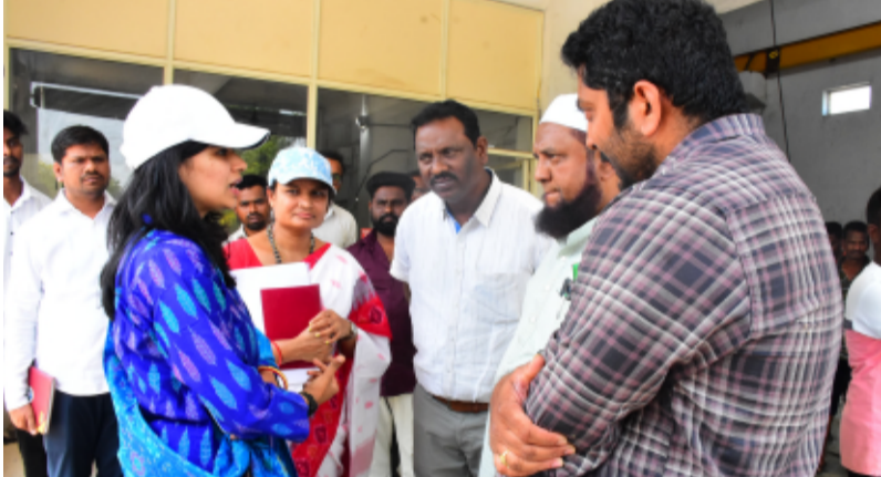
-అగ్రహారం సమీపంలోని మిషన్ భగీరథ ఫిల్టర్ టెక్, వాటర్ ట్రీట్ మెంట్ ప్లాంట్, రుద్రవరం ఇన్ టెక్ వెల్ పరిశీలన