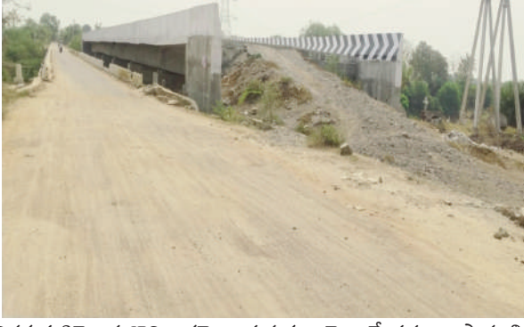
నిర్లక్ష్యమా? తెలుసుకొని ఇకనైనా ప్రభుత్వం వెంటనే పనులు ప్రారంభి పంతులను పూర్తి చేసి ఇవ్వాలని స్థానికులు కోరుకుంటున్నాను

నిర్మల్ జిల్లా (ఆర్ సి )మార్చి 31 ( తెలంగాణ పత్రిక ) సోన్ మండల కేంద్రంలోని మాదాపూర్ గ్రామం సమీపంలో ఉన్నటువంటి వాగు పైన నిర్మించిన వంతెన నేటికీ రోడ్డు పనులతో సహా పూర్తి కాలేదు రాబోయే వర్షాకాలంలో ప్రయాణించే లెక్క పోవచ్చు, గాంధీనగర్, పాక్ పట్టణ , మాదాపూర్ ప్రజలకు తీవ్ర ఇబ్బందులు ఎదురవుతున్నాయి ఇప్పటికీ అక్కడ పాతవి రెండు వంతెనలు ఉన్న వాగు ఉద్రిక్తత తరచుగా పెరగడంతో మరో భారీ వంతెన పనులు చేపట్టి సంవత్సరాలు గడిచిన నేటికీ పనులు మిగిలే ఉన్నాయి, ప్రజలు తీవ్ర ఇబ్బంది గురవుతున్నారు. కావున అధికారులు ఆ యొక్క వంతెనను పరిశీలించి పనులు ఏ స్థాయిలో ఉన్నాయో ప్రభుత్వము నుండి నిధుల నిర్లక్ష్యమా? కాంట్రాక్టర్