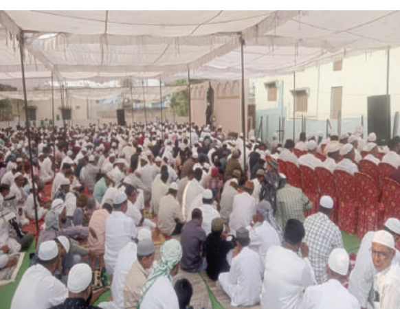
- ముస్లింలకు అతి పెద్ద పండుగ ఈదుల్ ఫిత్ర్

తెలంగాణ పత్రిక-బోర్డ్ ఆర్చి- మార్చి 31:అల్లాహు అక్షర్.. అల్లాహు అక్షర్.. అంటూ నెల రోజులుగా ఉపవాస దీక్షలు ఆచరించిన ముస్లింలు సోమవారం అత్యంత పవిత్రంగా, భక్తి శ్రద్ధలతో రంజాన్ పండుగను జరుపుకోనున్నారు. ఈదుల్ ఫిత్ర్ సందర్భంగా పరస్పరం 'ఈద్ ముబారక్' అంటూ శుభాకాంక్షలు తెలుపుకుంటారు. షవ్వాల్ చాంద్(నెలవంక) ఆదివారం రాత్రి చూడగానే ఈదుల్ ఫిత్ర్(రంజాన్) పండుగ ఏర్పాట్లలో ముస్లింలు నిమగ్నమయ్యారు. రంజాన్ పండుగను పురస్కరించుకుని ముస్లింల సందడితో పండుగ శోభ సంతరించుకుంది. ఆదిలాబాద్ జిల్లాలోనే ఈడాల్నిండినీ ముస్లింలు చేశారు. నెల రోజుల కఠిన ఉపవాస దీక్షలు ఆచరించిన ముస్లింలు 30 రోజుల పాటు కఠిన ఉపవాస దీక్షలు ఆచరించిన ముస్లింలు