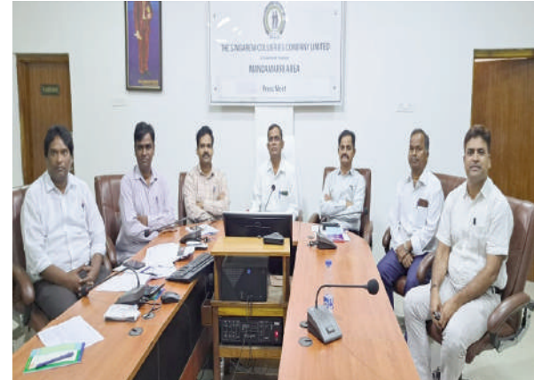
అనేక ఉన్నాయిని కార్మికులు అధికారులు యూనియన్ నాయకులు సమిష్టి కృషితో వచ్చే ఆర్థిక సంవత్సరం నిర్దేశిస్తున్న లక్ష్యాలను అధిగమిస్తామని ఆయన ఆశాభావం వ్యక్తం చేశారు ఈ విలేజ్ కలెక్షన్ సమావేశం లో సింగరేణి అధికారులు పాల్గొన్నారు.

మెరుగుపరచి నిర్దేశించిన లక్ష్యాలను అధిగమించేలా ప్రణాళికలూపాదిస్తామన్నారు. ఏరియాలోని శాంతిఖనిలో మూడవ సీమ్, నాలుగో సీమ్ లలో త్వరలో రెండు నూతన ప్యానెల్లు ప్రారంభించనున్నట్లు తెలిపారు. అంతేకాకుండా నూతన ప్యానెల్లైడింగ్ ఏర్పాటుకు కృషి చేస్తున్నామని శాంతిఖనిలో నూతన ప్యానెల్లైడింగ్ ద్వారా బొగ్గు ఉత్పత్తి మెరుగు పడు తుందన్నారు. అంతే కాకుండా నూతనంగా లాంగ్ వాల్ టెక్నాలజీ ద్వారా బొగ్గు ఉత్పత్తి సాధించేందుకు ఇటీవల ప్రణాళికలూ సేకరణ నిర్వహించడం జరిగిందన్నారు. 681 హెక్టార్ల భూసేకరణ జరిపి 8 మిలియన్ టన్నుల బొగ్గును వెలికి తీయ సున్నామని వివరించారు. కేకే 5 గనికి మరో నాలుగు సంవత్సరాల జీవిత కాలం ఉందని త్వరలో నూతన ప్యానెల్లైడింగ్ ఏర్పాటు చేసి బొగ్గు ఉత్పత్తి మెరుగు పరచడానికి కృషి చేస్తున్నామని తెలిపారు. వచ్చే 2025 - 26 ఆర్థిక సంవత్సరానికి గాను సంవత్సరానికి గాను ఏరియా కు 27.8 లక్షల టన్నుల బొగ్గు ఉత్పత్తి నిర్దేశించడం జరిగిందని నిర్దేశించిన బొగ్గు ఉత్పత్తి లక్ష్యాలను అధిగమించేందుకు అవకాశాల