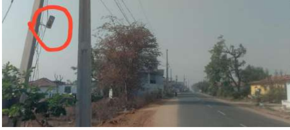
తెలియదు. ఈ మధిర గ్రామంలో ఒక్క సీసీ కెమెరా అమర్చిన...నాభుడే లేదని ఈ గ్రామం అంటే ఇంత నిర్లక్ష్యమా అంటూ ప్రజలు అన్వయిస్తున్నారు. ఈ నెల 25 న గ్రామానికి చెందిన ఓ రైతు ఎద్దును దొంగలు దొంగిలించారు. నిఘా నేత్రాలు లేకపోవడం వల్ల ఇలాంటి దొంగతనాలు, ఇతర అసాధుక కార్యకలాపాలు జరిగే అవకాశం ఉంది కాబట్టి గ్రామంలో మాత్రం సీసీ కెమెరాలను ఏర్పాటు చెయ్యాలని గ్రామస్థులు కోరుకుంటున్నారు. ఇప్పటికైనా పోలీస్ అధికారులు, ప్రజాప్రతి నిధులు ఇంక ఎవరైనా స్పందిస్తారో వేచి చూడాలి.

దుబ్బాక ప్రతినిధి, మార్చి 29 (తెలంగాణ పత్రిక): ఎక్కడ ఏం జరిగినా చీమ చీమి కుప్పమన్న... సీసీ కెమెరాలు ఉంటే ఇట్టే తెలిసిపోతుంది కానీ దుబ్బాక మండలం రాజకృపేట గ్రామంలో ఉన్న సీసీ కెమెరాలు మాత్రం దాదాపు రెండు సంవత్సరాల నుండి పనిచేయడం లేదు సీసీ కెమెరాలపై తెలంగాణ పత్రిక ప్రత్యేక కథనం... నేటి ఆధునిక కాలంలో గ్రామాలలో, జన సంచారం ఉన్న ప్రాంతాలలో సీసీ కెమెరాలు ఉంటే “ఒక్క కెమెరా 100 మంది పోలీస్” లతో సమానం అన్నట్లుగా పోలీస్ శాఖ వారు అవగాహన కల్పిస్తుంటారు. రాజకృపేట, మధిర గ్రామం ఎల్లాపూర్ మొత్తం జనాభా 2312, పది వార్డులు ఉన్న ఈ గ్రామంలో 2018 సంవత్సరంలో కుల సంఘాలు, ప్రజా ప్రతినిధులు, గ్రామస్థల సహకారంతో 12 సీసీ కెమెరాలను రాజకృపేట గ్రామంలో అమర్చారు. దాదాపు రెండు సంవత్సరాల నుండి నిఘా...నేత్రాలు పూర్తిగా నిద్రలో ఉన్నాయి. నేటి వరకు వాటిని ఎప్పుడుకూడా పరీక్షించుకున్న పాపాన పోలీస్ గ్రామస్థులు ఆరోపిస్తున్నారు. దాదాపు రెండు సంవత్సరాల నుండి నిఘా నేత్రాలు పని చెయ్యకపోవడం, అధికారులు చూడకపోవడమే దీనికి కారణమా అని ప్రజలు వాపోతున్నారు. ఇక్కడ ఏం జరిగినా ఎప్పుడీ