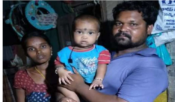
కానీ దాతలు ఎవరైనా ఉంటే 83093 59189 నెంబర్ కి ఫోన్ చేసి, గుర్రులో పే చేయాలని బాలుడు తల్లిదండ్రులు, కుటుంబ సభ్యులు వేడుకుంటున్నారు.