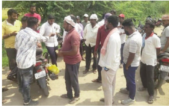
పేర్కొన్నారు. అయితే రైతులు మాత్రం ఈ క్వారీని తక్షణమే మూసివేయాలని డిమాండ్ చేస్తున్నారు.

నిజామాబాద్ ( తెలంగాణ పత్రిక ) జిల్లా ప్రతినీధి మార్చి 29తమ పొలాలకు వెళ్లేందుకు ఇబ్బందులు ఎదురవుతున్నాయని పేర్కొంటూ జోధన్ మండల శివారులోని సిద్ధాపూర్ క్వారీ వద్ద శనివారం రైతులు ఆందోళన చేశారు. ఇటీవలే ఇసుక క్వారీ తెరవడంతో నిత్యం ట్రాక్టర్ల రాకపోకలు జోరుగా సాగుతున్నాయి. దీంతో రైతులు తమ పొలాలకు వెళ్లేందుకు దారి దొరకట్టెదు. అలాగే వేటిల్లులు లేకుండా పెద్ద సంఖ్యలో ట్రాక్టర్లు తిరుగుతున్నాయని రైతులు ఆరోపించారు. శనివారం పెద్ద సంఖ్యలో ట్రాక్టర్లను రోడ్డుపైనే నిలిపి వేశారు. దీంతో రైతులు నిరసన తెలిపారు. ఈ విషయమై తహశీల్దార్ విరల్ ను వివరణ కోరగా.. సిబ్బంది కొరత కారణంగా వేటిల్లులు ఇష్యుడం అలస్యమైందని, అనుమతులిచ్చి ట్రాక్టర్లను పంపించేస్తామని