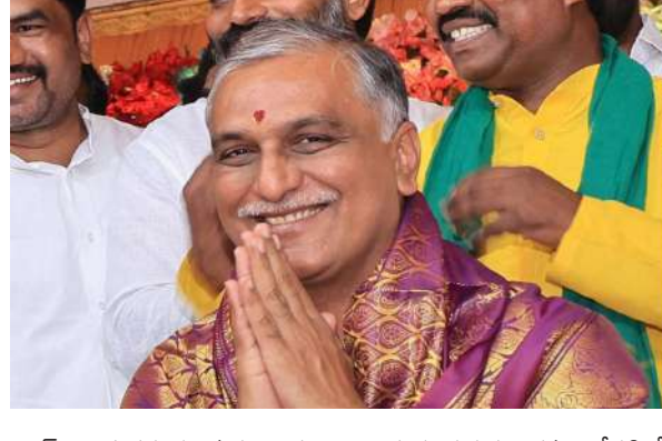
ద్వాపేలు మత్తర్ల దుంకుతున్నాయని. కొంత ఈ ప్రభుత్వ నిర్లక్ష్యం ధోరణితో సాగు నీటి ఇబ్బందులు తలెత్తి రైతులు ఆందోహం చెందుతున్నారన్నారు. ఈ యేడాది వర్షాలు సమృద్ధిగా కురువాలని, రైతులు ఆనందంతో పాడి పంటలతో వర్షిల్లాలన్నారు. అన్నింటా శుభం జరగాలని భగవంతుణ్ణి ప్రార్థిస్తున్నారని తెలిపారు. ఈ కొత్త సంవత్సర పర్వదినం అందరి కుటుంబాల్లో కొత్త మొగులు నింపాలన్నారు.

సిద్దిపేట జిల్లా ప్రతినిధి, మార్చి 29 (తెలంగాణ పత్రిక ): తెలుగు నూతన సంవత్సరాది శ్రీ విశ్వా వసు నామ సంవత్సర ఉగాది పర్వదినం సందర్భంగా “విశ్వావసు”లో విజయాలు సిద్ధించాలి... సిద్దిపేట జిల్లా ప్రజలకు మాజీ మంత్రి, సిద్దిపేట ఎమ్మెల్యే హరీష్ రావు శుభాకాంక్షలు తెలిపారు. తెలుగు నూతన సంవత్సరాన్ని ఆనందోత్సాహాలతో, సుఖంతోషాల మధ్య అన్ని వర్గాల ప్రజలు జరుపుకోవాలని ఆకాంక్షించారు. ఈ ఉగాది పచ్చడిలాగే మీ జీవితం షుభ్రుల సంగమంగా మారాలని కోరుతూ... ఈ ఉగాది మీ కష్టాలకు ముగింపు మీ విజయాలకు ఆరంభం కావాలి... తెలుగు వారి సంప్రదాయాలకు ప్రతిరూపమైన ఉగాది సందర్భంగా శ్రీ విశ్వా వసు నా విశ్వం అంత ఆనందం తో విరిజిల్లాలని ఆకాంక్షించారు. విశ్వా వసు అంటే విశ్వాసం, సమృద్ధి అని అనితూ ప్రజలు పెట్టుకున్న సమృద్ధిని ప్రభుత్వాల నిలుపుకోవాలన్నారు. ఈ సంవత్సరం అన్నిరంగాల్లో పురోభివృద్ధిని సాధించాలని తెలిపారు. గత వదేళ్లలో తెలంగాణ అన్ని రంగాల్లో అద్భుతమైన ప్రగతి సాధించి పురోగమంలోకి వచ్చిందని.. ఈ పదిహేను నెలల్లో ప్రజా సంక్షేమ రాష్ట్ర అభివృద్ధి పేరు ప్రతిష్టలు తిరుగుమానంలోకి వచ్చిందన్నారు. తెలంగాణ రాష్ట్ర తొలి సీఎం కెసీఆర్ గారి నిర్మించిన కాకేశ్వరం ప్రాజెక్టుతో ఈ మండల బెండల్లో చెరువులు, చెక్