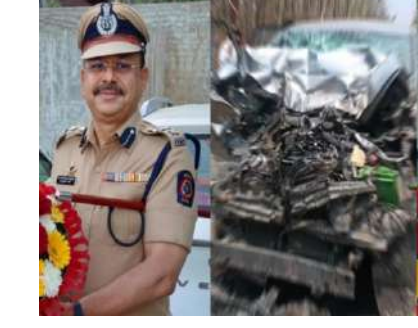
చెందిన పోలీసు అధికారి గుర్తించారు. మరో వ్యక్తిని భగవత్ గా గుర్తించారు.

నాగర్ కర్నూలు, మార్చి 29, తెలంగాణ పత్రిక : నాగర్ కర్నూలు జిల్లాలో ఘోర రోడ్డు ప్రమా దం వోటు చేసుకుంది. ఈ ప్రమాదంలో ము ంబై పోలీసు పోస్ట్ జోన్ డీసీపీ సుధాకర్ ప రాణాతో పాటు మరో వ్యక్తి మృతి చెందారు. నాగర్ కర్నూలు జిల్లాలోని ఆర్కాట్ మం డలం దోమలపెంల సమీపంలో ఎదురుగా